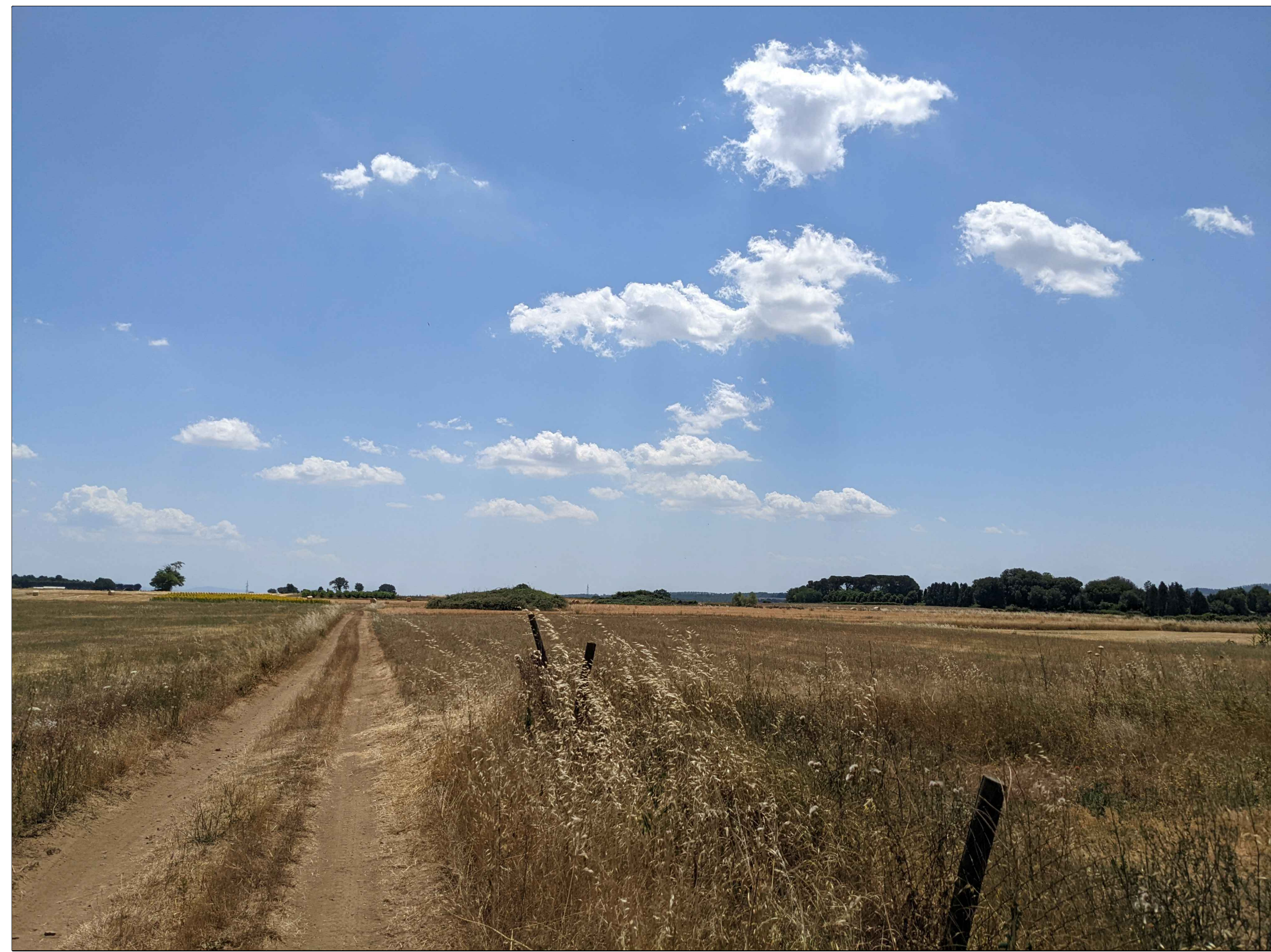
FOTINSERIMENTO 5 - STATO DI FATTO