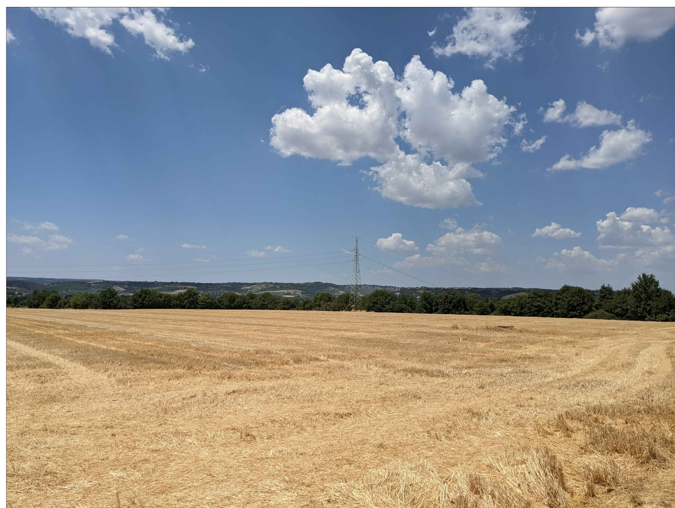
FOTINSERIMENTO 7 - STATO DI FATTO

NOTA: il numero del Fotoinserimento fa riferimento al Recettore individuato, nel navigatore sono stati riportati solo i recettori dai quali è stato sviluppato il fotoinserimento. Per un elenco completo dei recettori selezionati si faccia riferimento allo Studio di Impatto Ambientale.