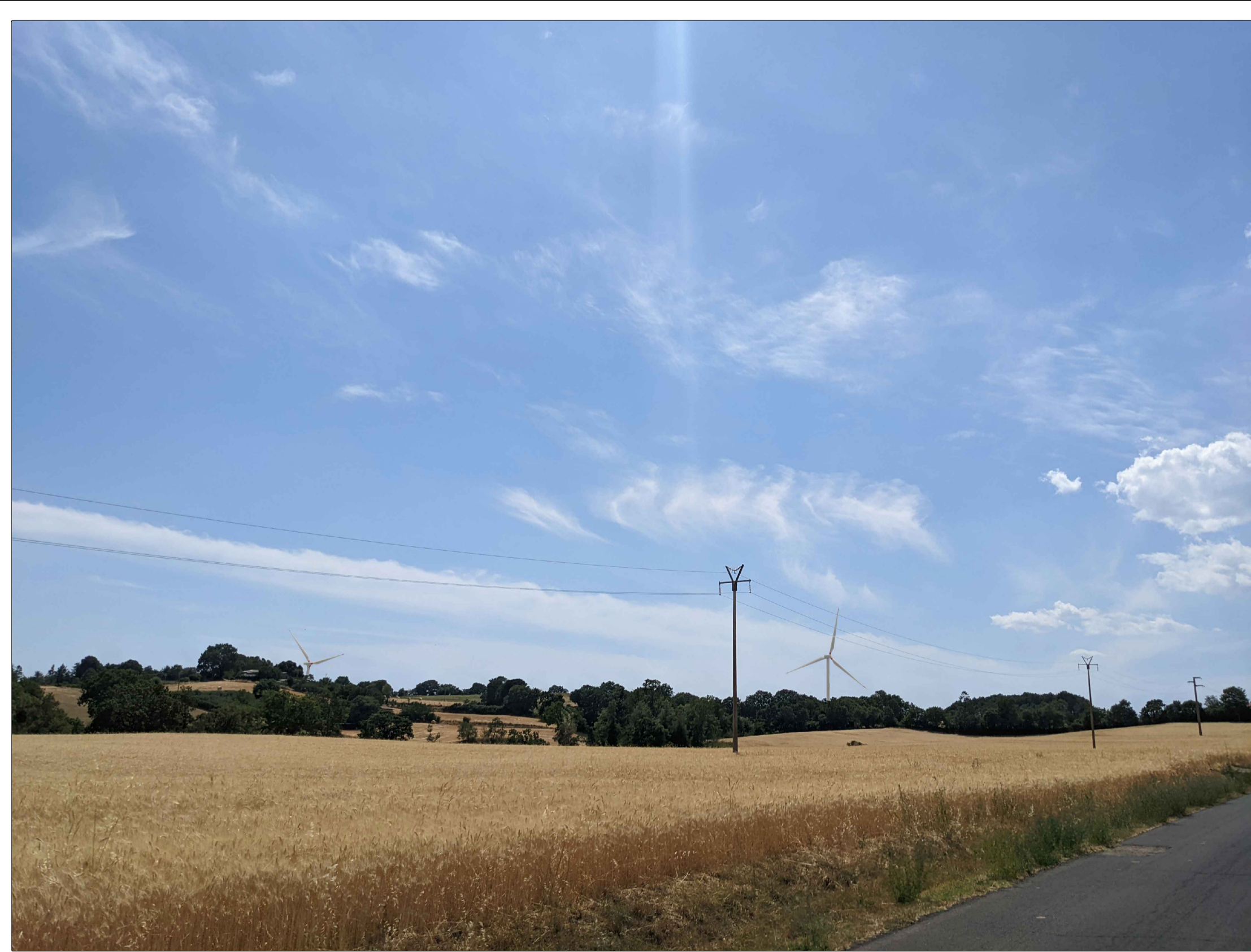
FOTINSERIMENTO 13 - STATO DI FATTO

NOTA: il numero del Fotoinserimento fa riferimento al Recettore individuato, nel navigatore sono stati riportati solo i recettori dai quali è stato sviluppato il Fotoinserimento. Per un elenco completo dei recettori selezionati si faccia riferimento allo Studio di Impatto Ambientale.