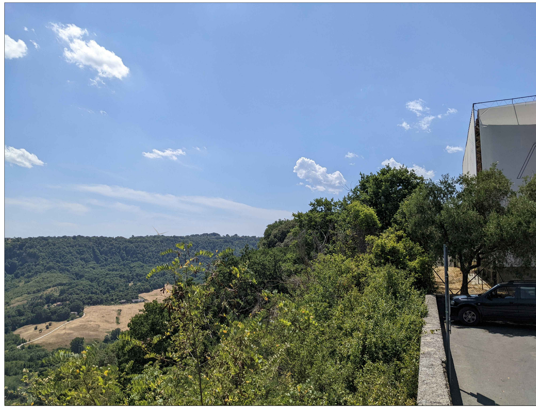
FOTINSERIMENTO 12 - STATO DI PROGETTO