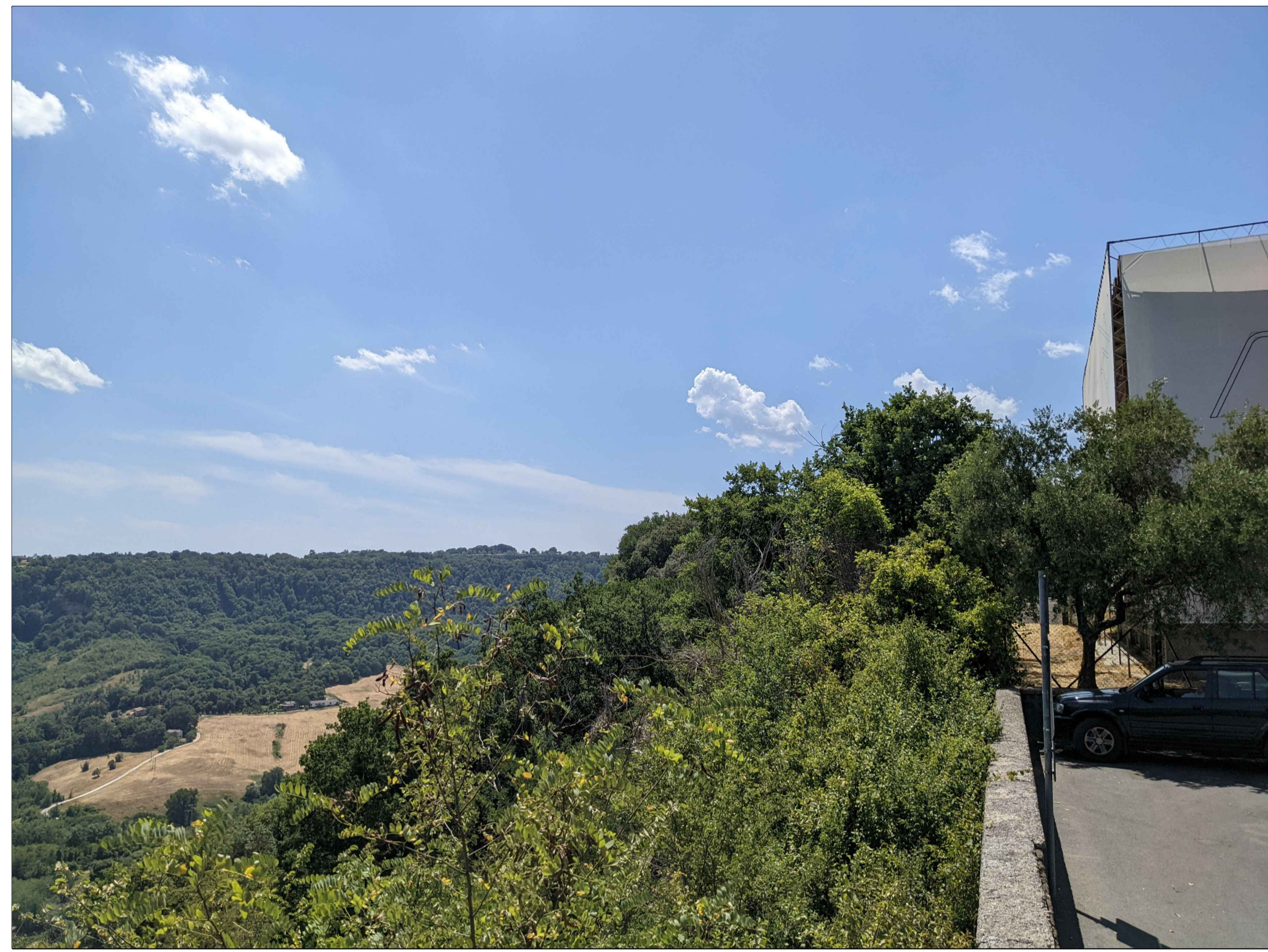
FOTINSERIMENTO 12 - STATO DI FATTO