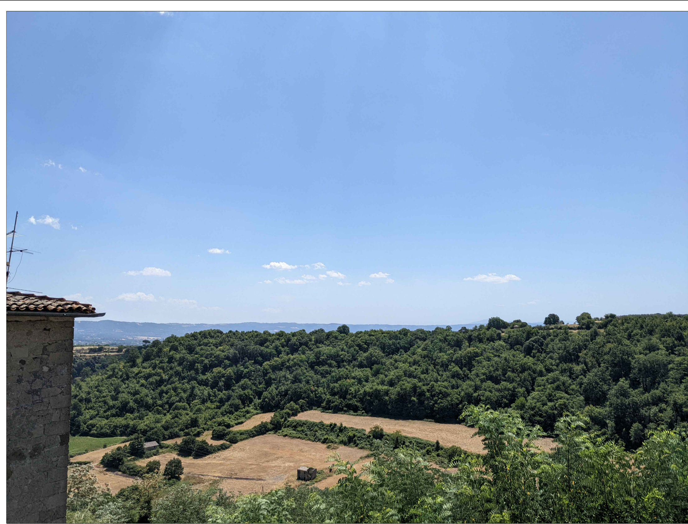
FOTINSERIMENTO 7 - STATO DI FATTO

NOTA: il numero del Fotoinserimento fa riferimento al Recettore individuato, nel navigatore sono stati riportati solo i recettori dai quali è stato sviluppato il Fotoinserimento. Per un elenco completo dei recettori selezionati si faccia riferimento allo Studio di Impatto Ambientale.