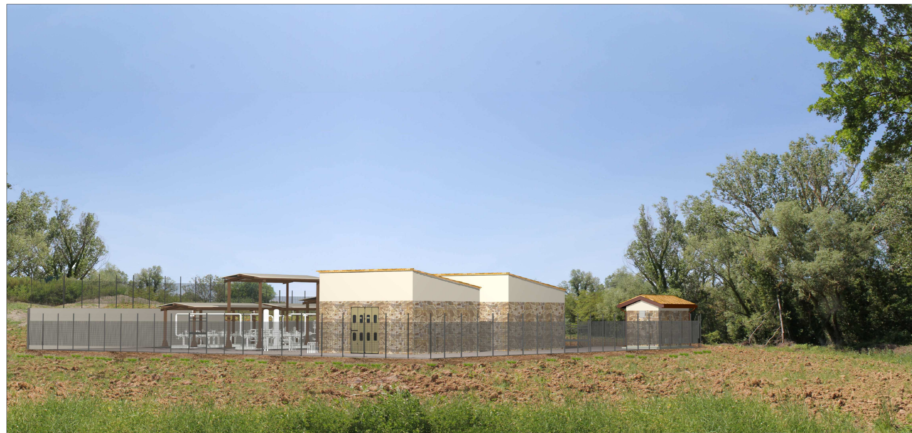
VISTA 3: Fotosimulazione nodo 6495, opera ultimata