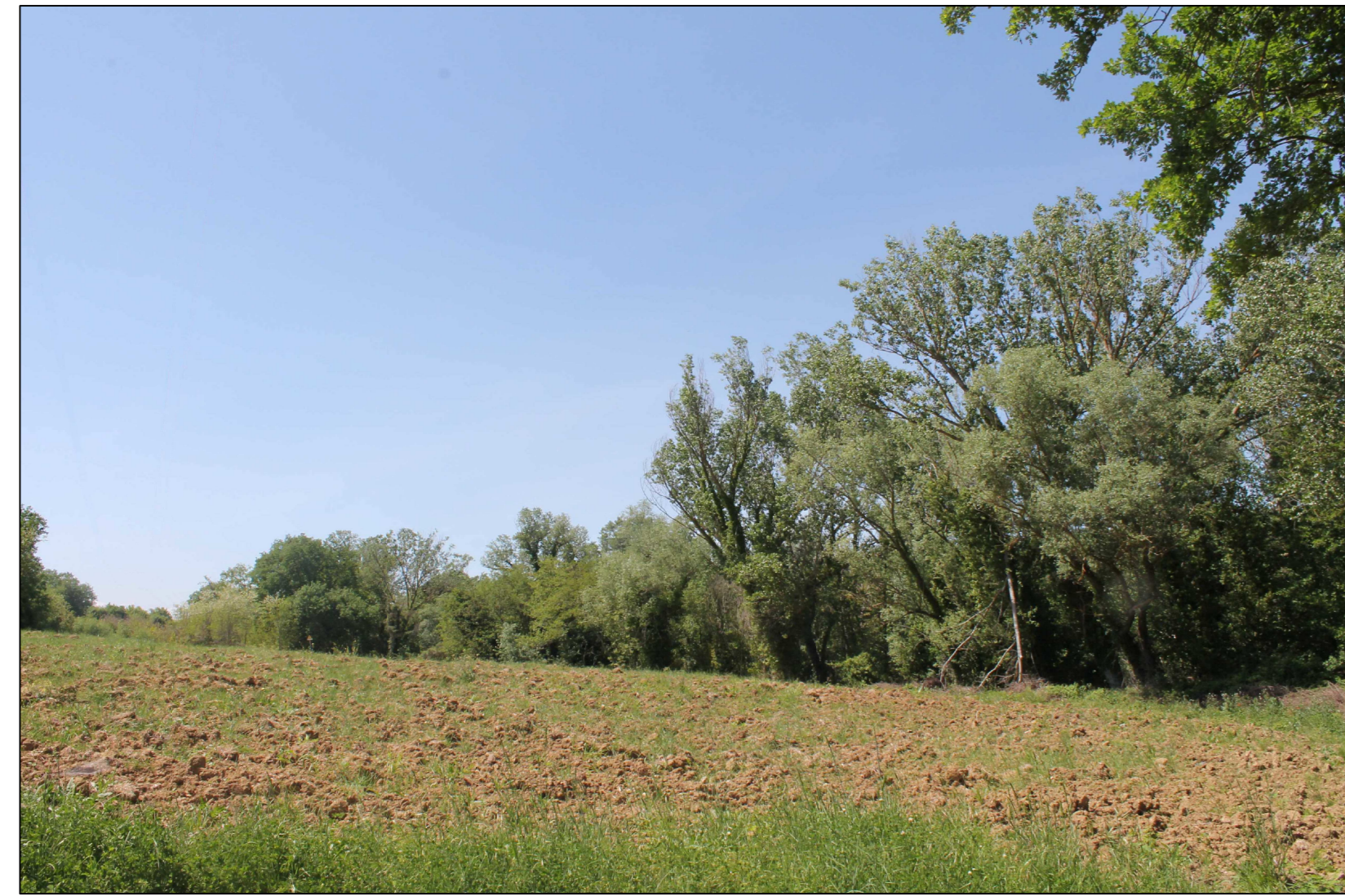
VISTA 1: Area di futura realizzazione del nodo 6495, stato attuale