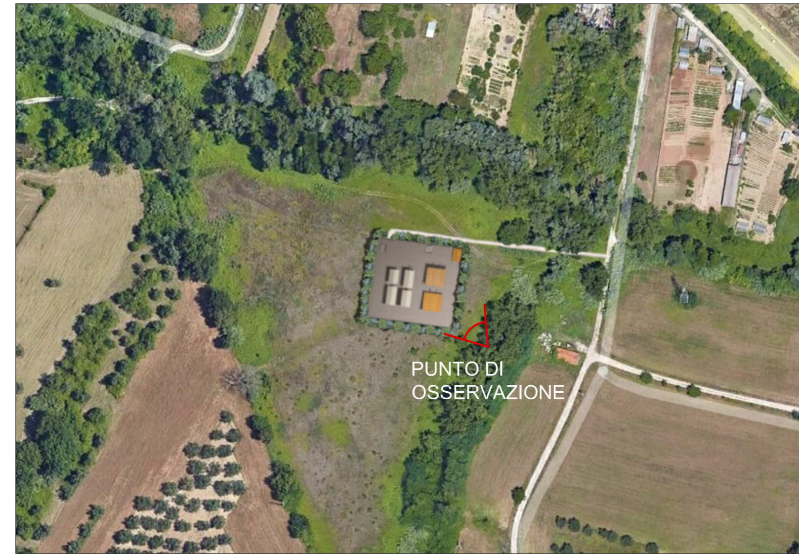
VISTA 5: Fotosimulazione nodo 6495, opera ultimata con mascheramento vegetazionale vista dall'alto