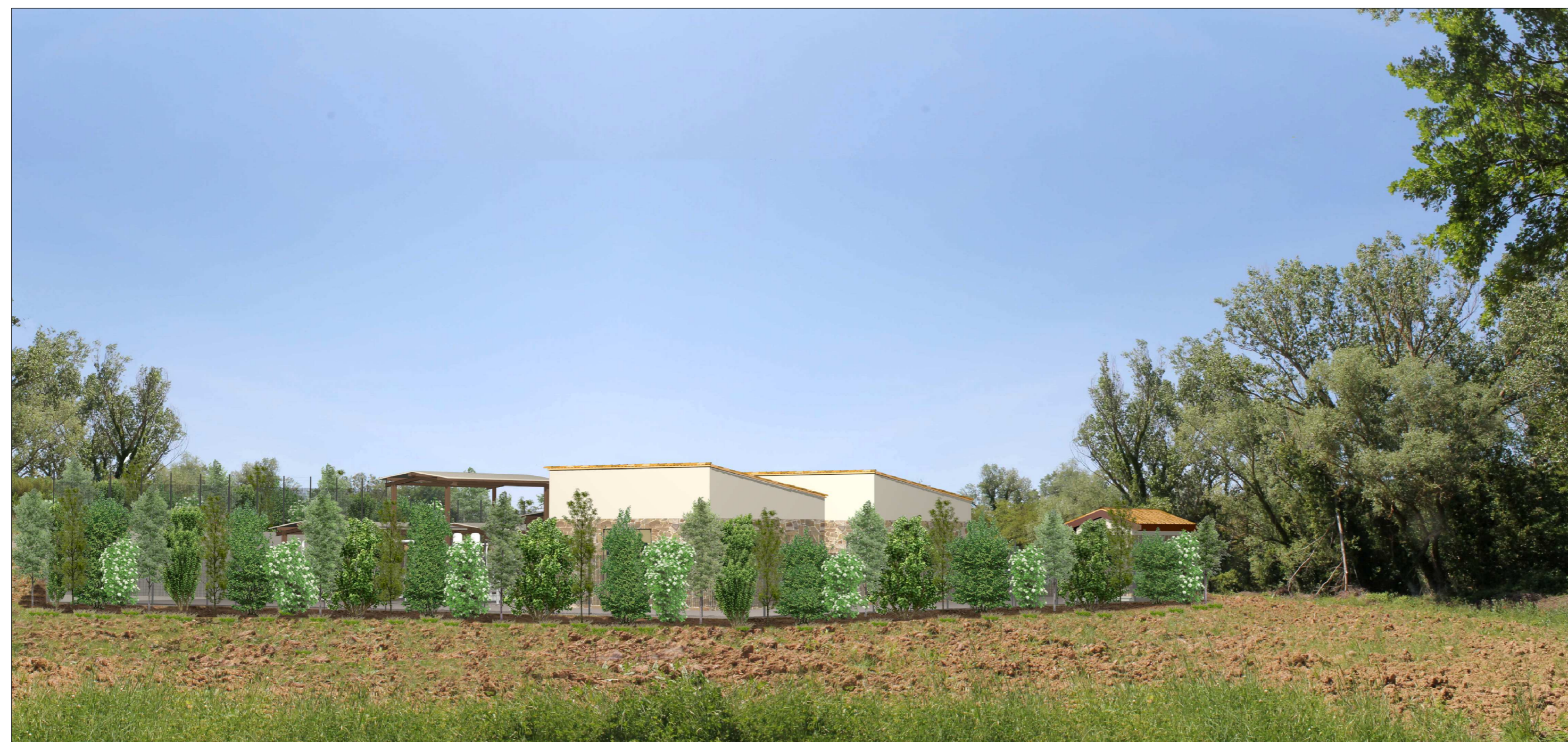
VISTA 3: Fotosimulazione nodo 6495, opera ultimata con mascheramento vegetazionale