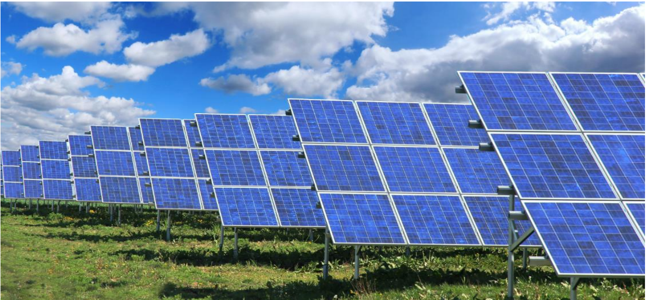
Inerbimento del suolo con essenze erbacee autoctone

Questa superficie può essere gestita mediante la pratica dell'inerbimento e il relativo controllo delle erbe infestanti con uno sfalcio all'anno per limitare l'impatto visivo dell'impianto e consentire l'accesso agli operatori addetti alla manutenzione in qualsiasi momento.