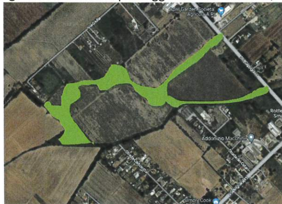
Fig. 3 ipotesi di corridoio paesaggistico ambientale di riconnessione della sistema fossi-vegetazione esistente