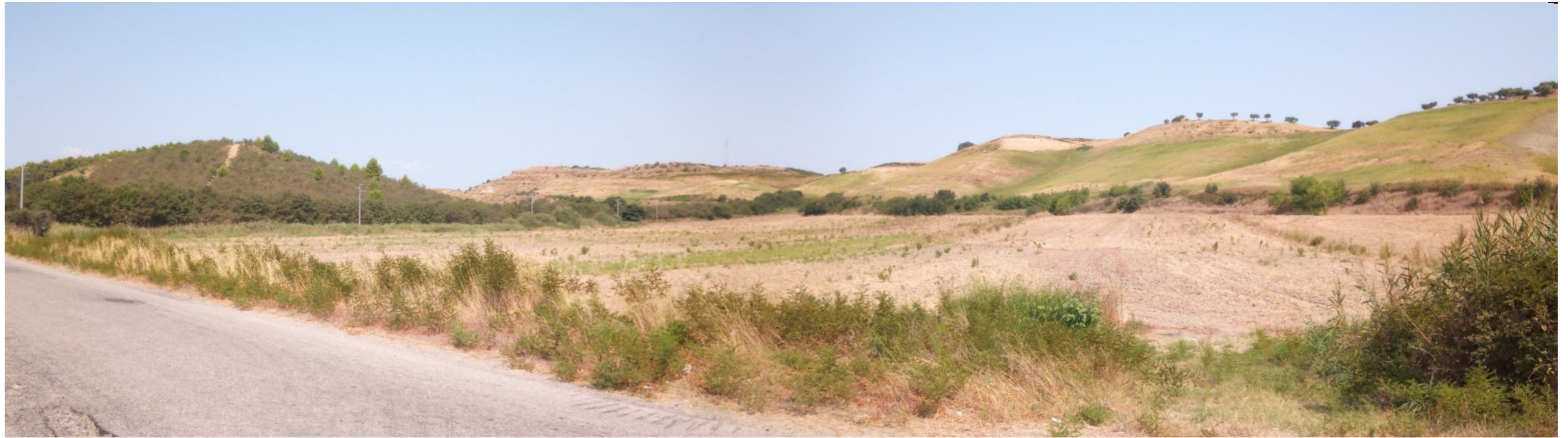
Punto di scatto A – Stato di Fatto