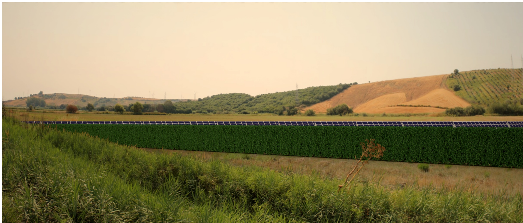
Punto di scatto B – Fotosimulazione