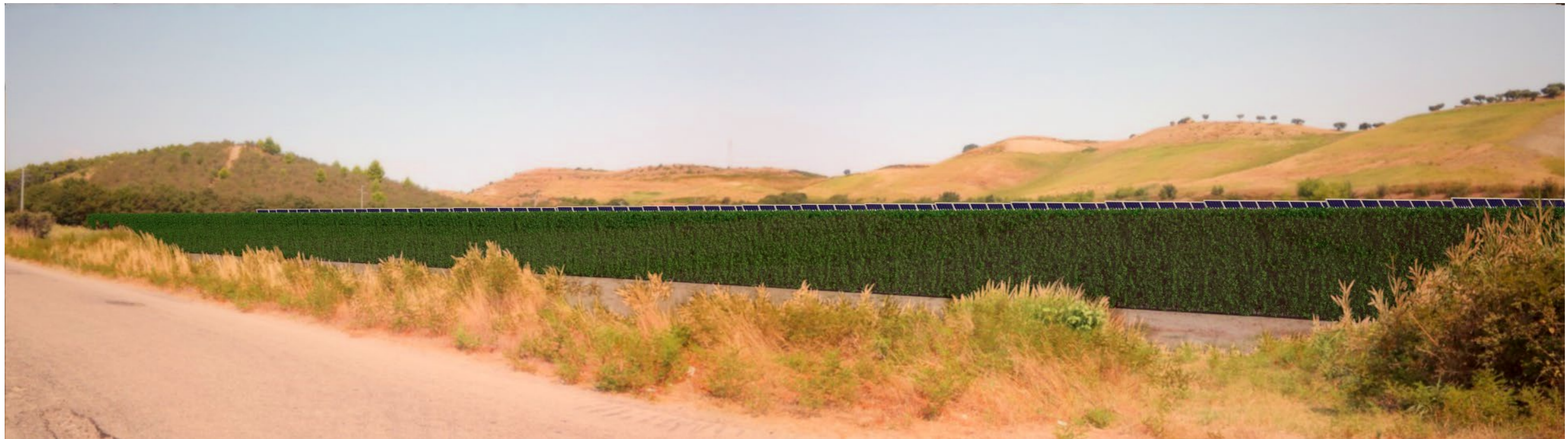
Punto di scatto A – Fotosimulazione