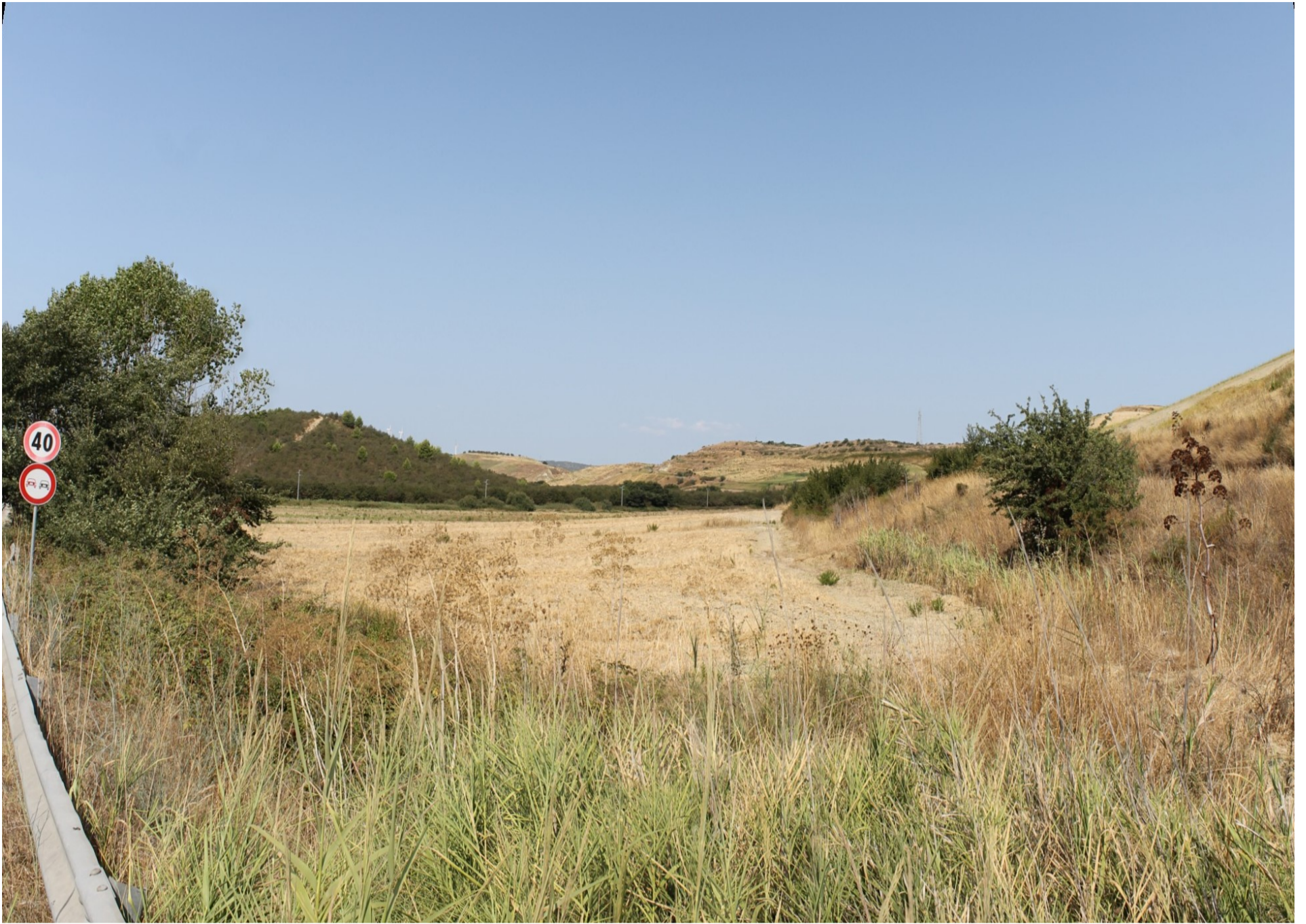
Punto di scatto Abis – Stato di Fatto