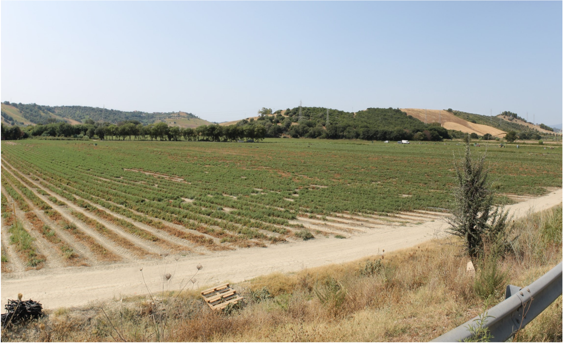
Punto di scatto D – Stato di fatto