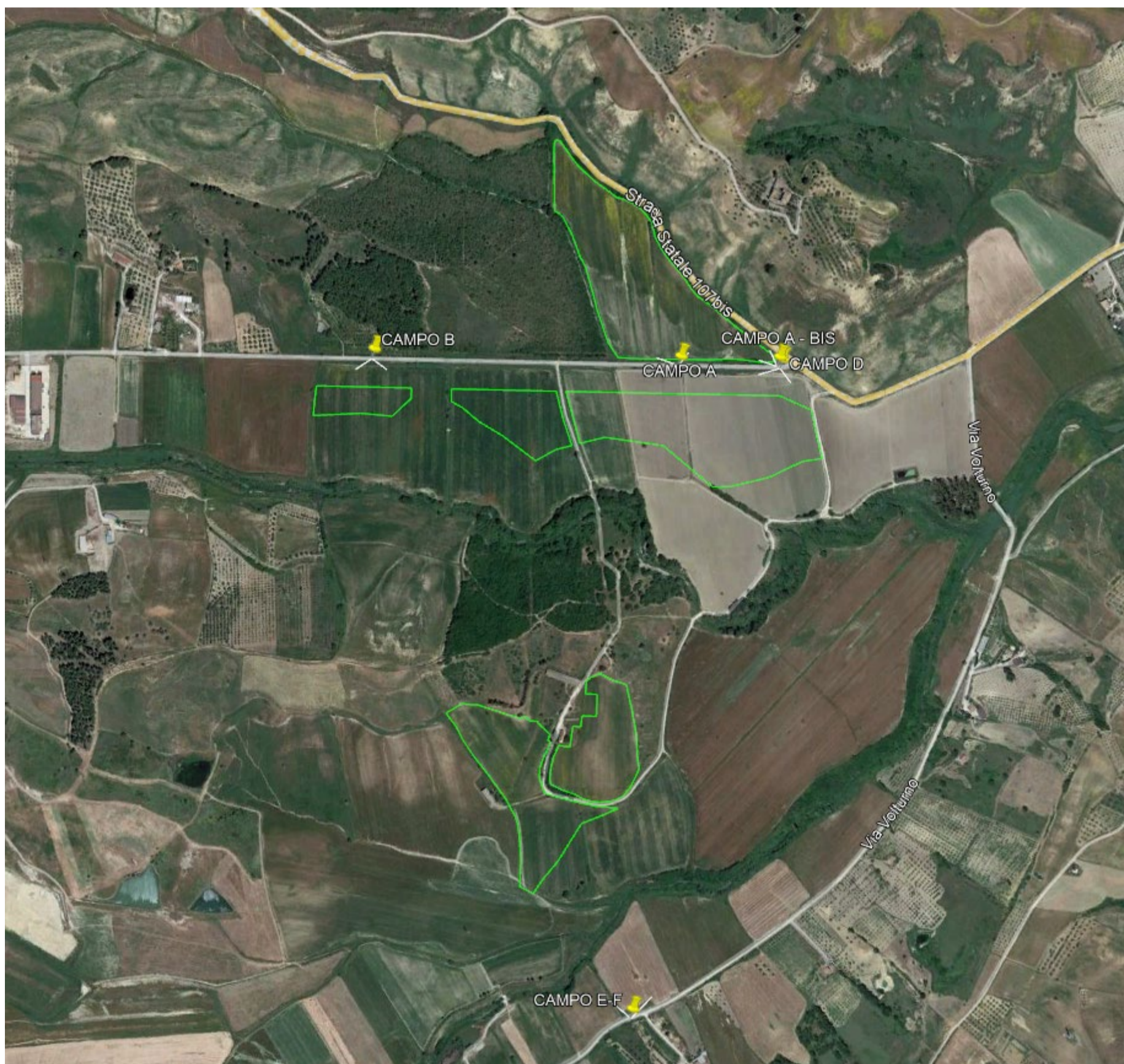
Punti di scatto