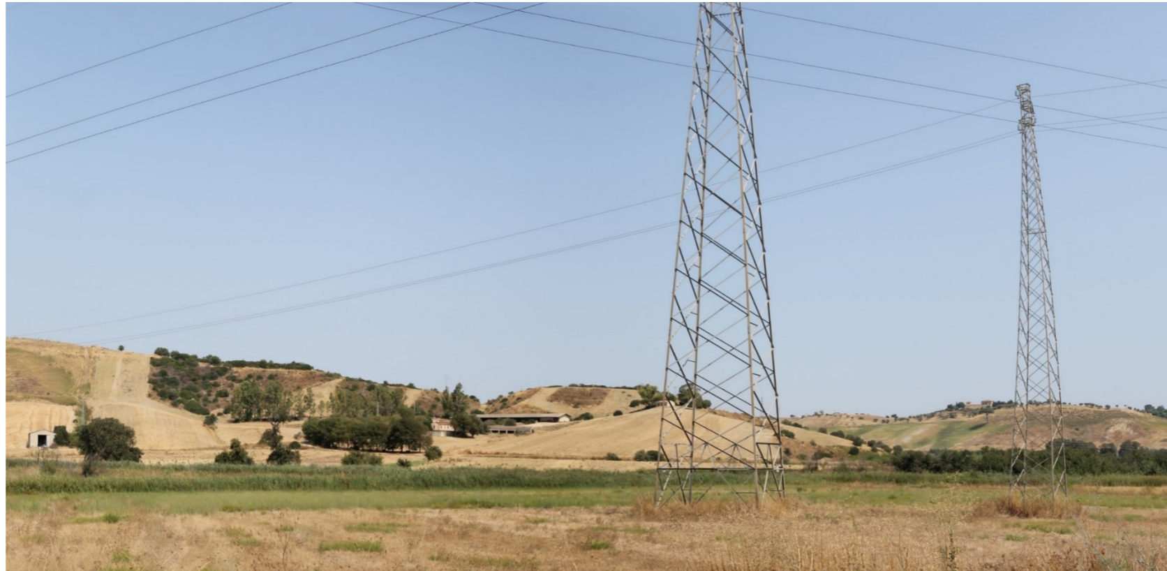
Punto di scatto E-F – Stato di fatto