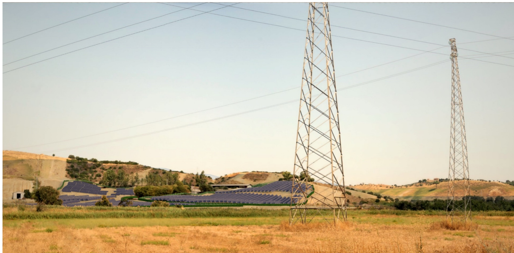
Punto di scatto E-F – Fotosimulazione.