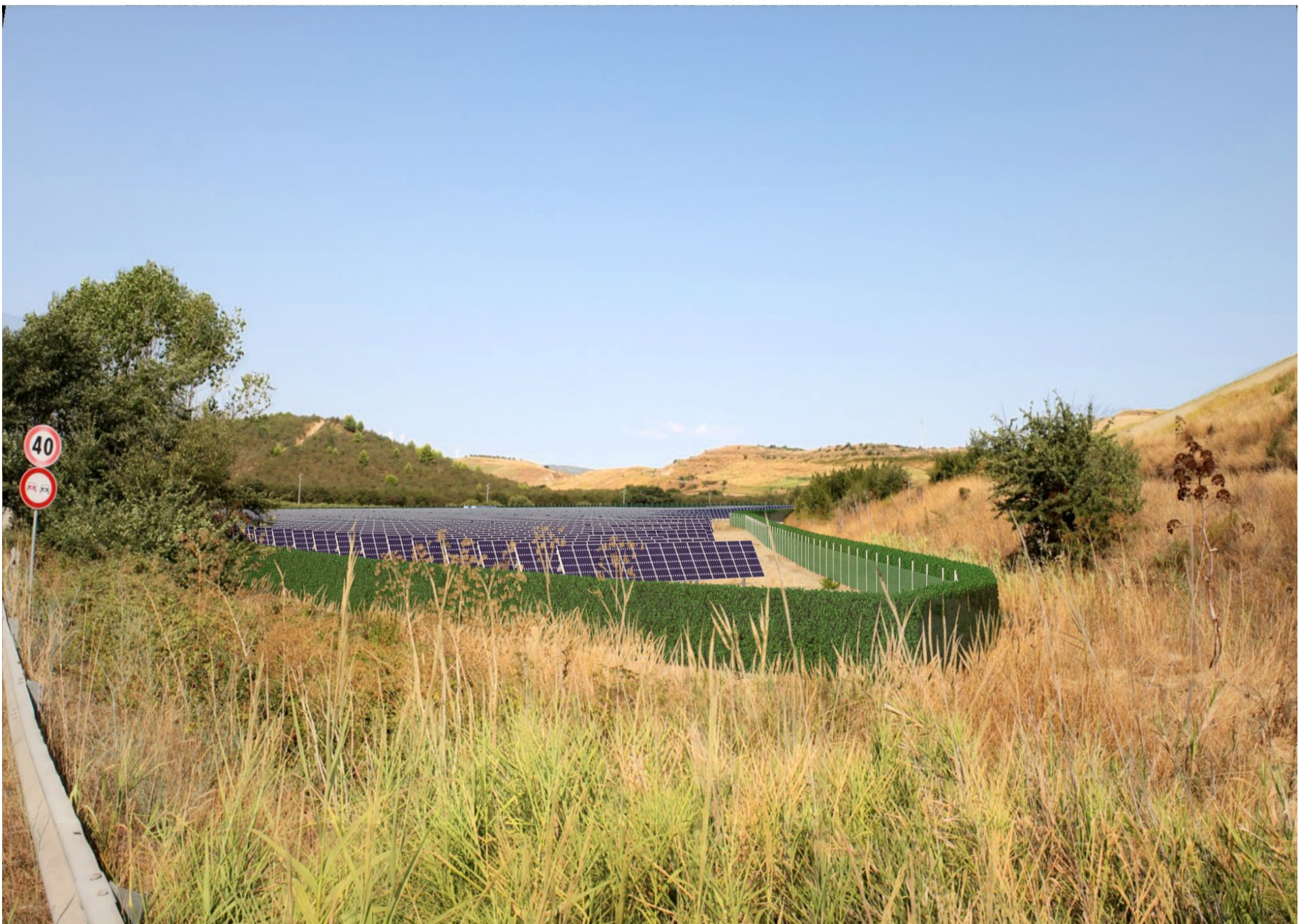
Punto di scatto Abis – Fotosimulazione