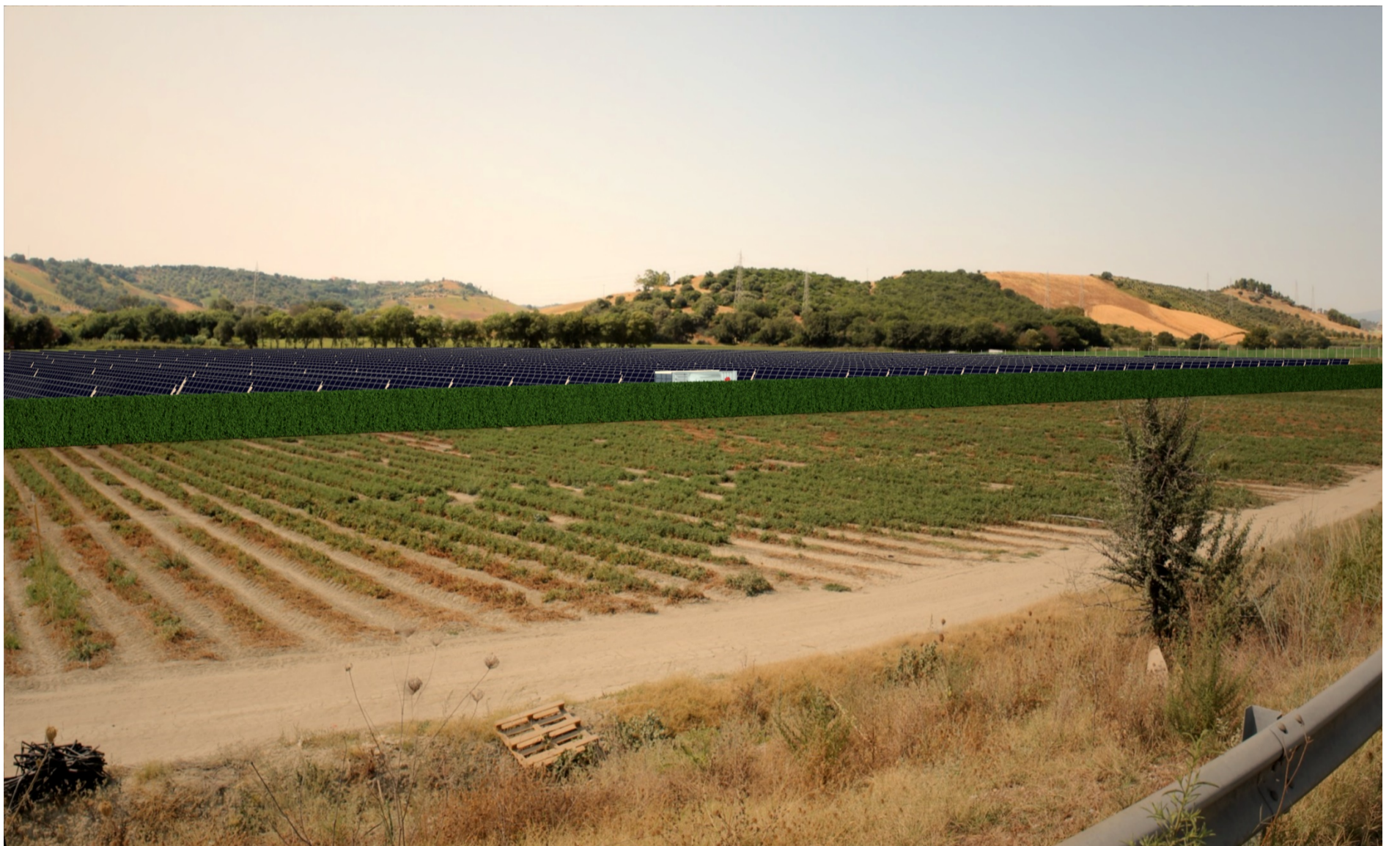
Punto di scatto D – Fotosimulazione