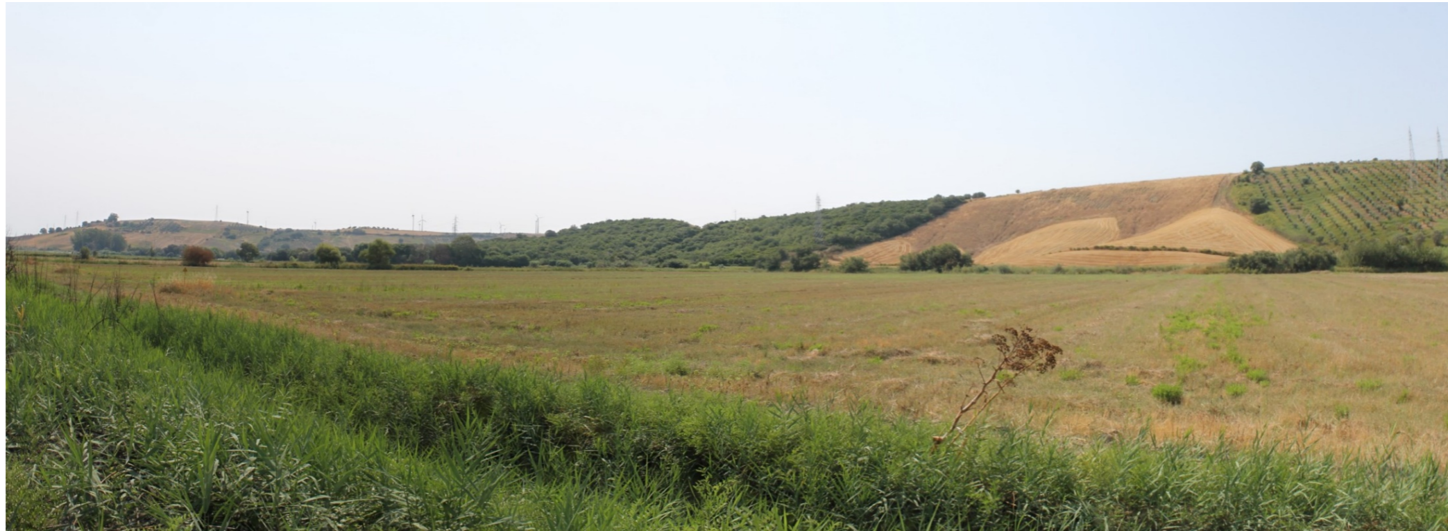
Punto di scatto B – Stato di fatto