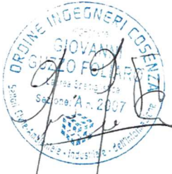
Timbro e Firma Ing. Giovanni Guzzo Foliaro