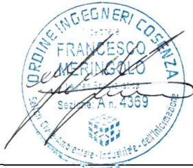
Timbro e Firma Ing. Francesco Meringolo