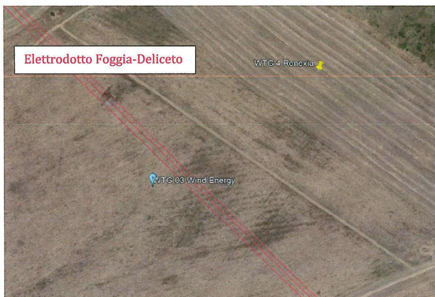
Figura 1: Interazione tra WTG 3 di Wind Energy Albanito e l'Elettrodotto 380 kV Foggia-Deliceto (in rosso)