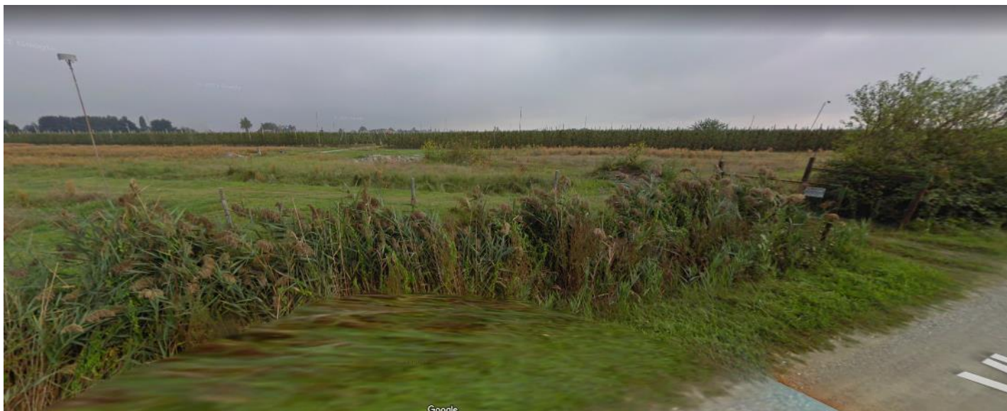
Foto 5. Aspetto tipico e rappresentativo dei contesti di confine delle aree agricole nei pressi della rete viaria con una copertura erbosa.