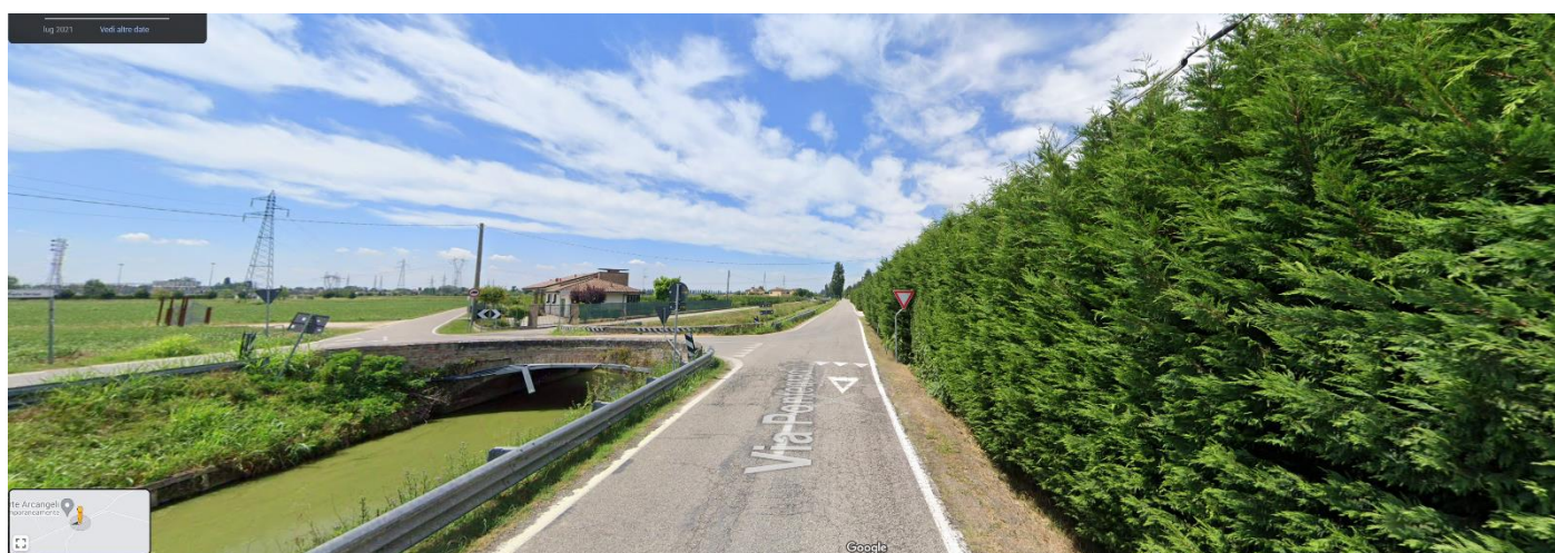
Foto 6. Tracciato del Canale Naviglio in primo piano: il particolare del ponte di attraversamento del canale Loc. Pontegradella collocato poco a valle dell'attraversamento in "subalveo" del tracciato del cavidotto elettrico interrato di connessione alla rete (realizzazione mediante "trivellazione orizzontale controllata" – TOC).