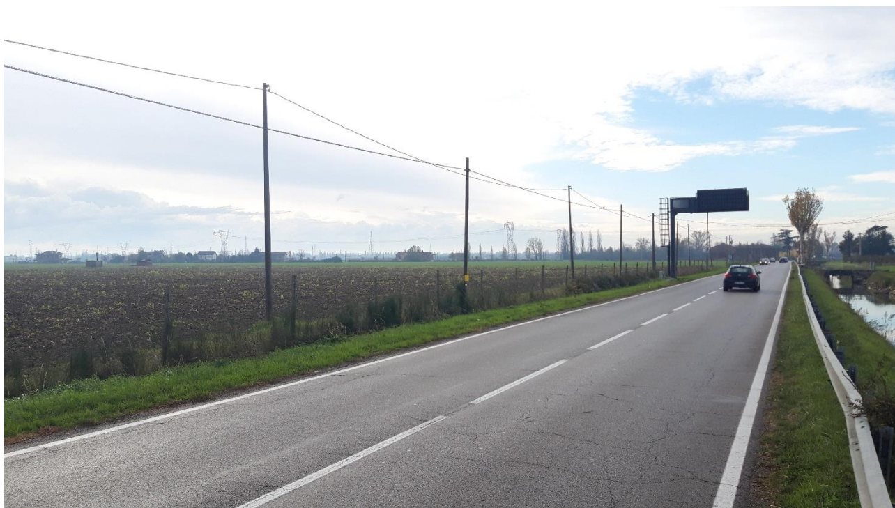
Strada Provinciale n. 2 ripresa da punto "A"