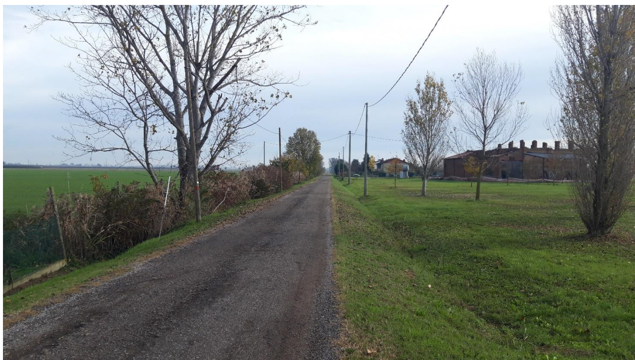
Via Ca' Tonda – punto di ripera "B"