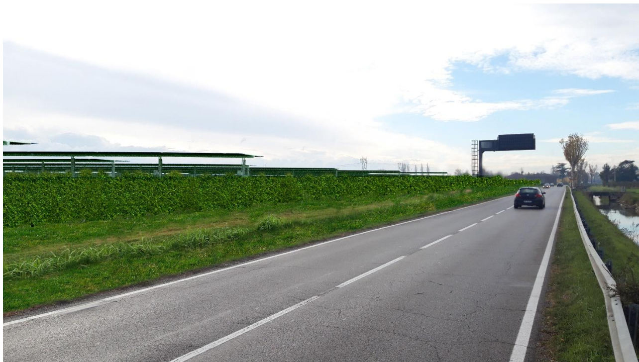
Fotoinserimento impianto agrivoltaico da Strada Provinciale n. 2 , punto di ripresa "A"