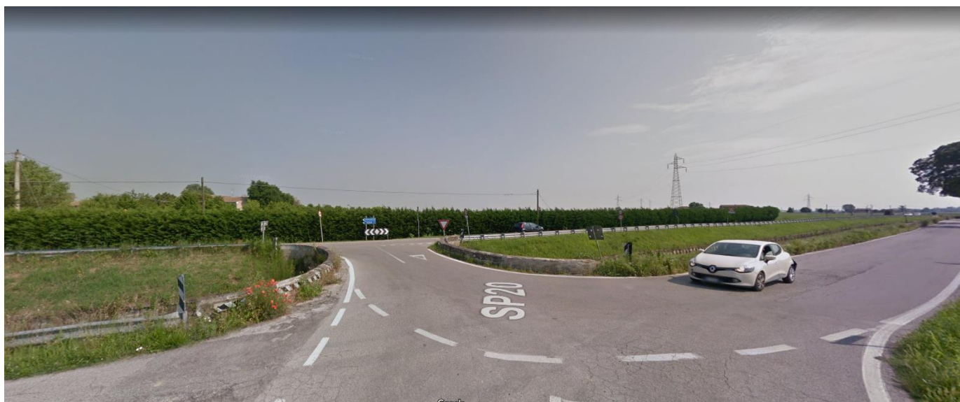
Foto 7. Asse del "Canale Naviglio" in primo piano; punto di ripresa a sud di esso in corrispondenza della prosecuzione del tracciato del cavidotto elettrico interrato in strada dopo l'attraversamento della sezione fluviale citata