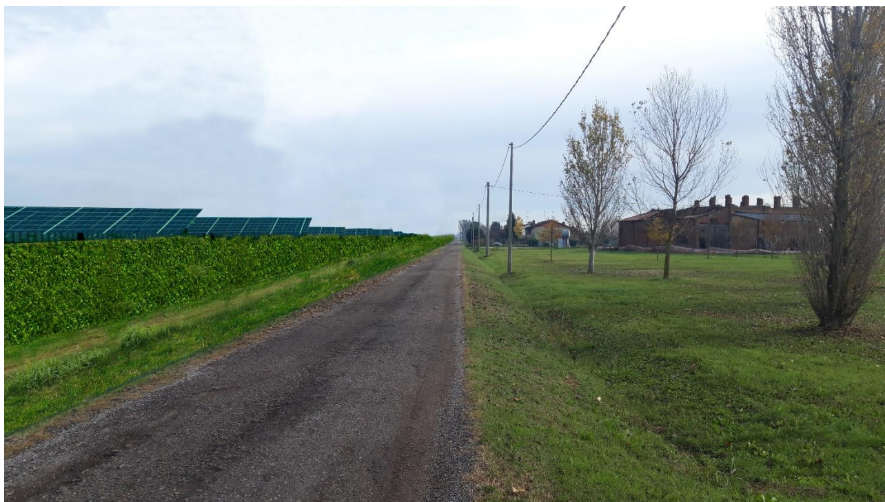
Fotoinserimento impianto agrivoltaico da via Ca' Tonda , punto di ripresa "B"