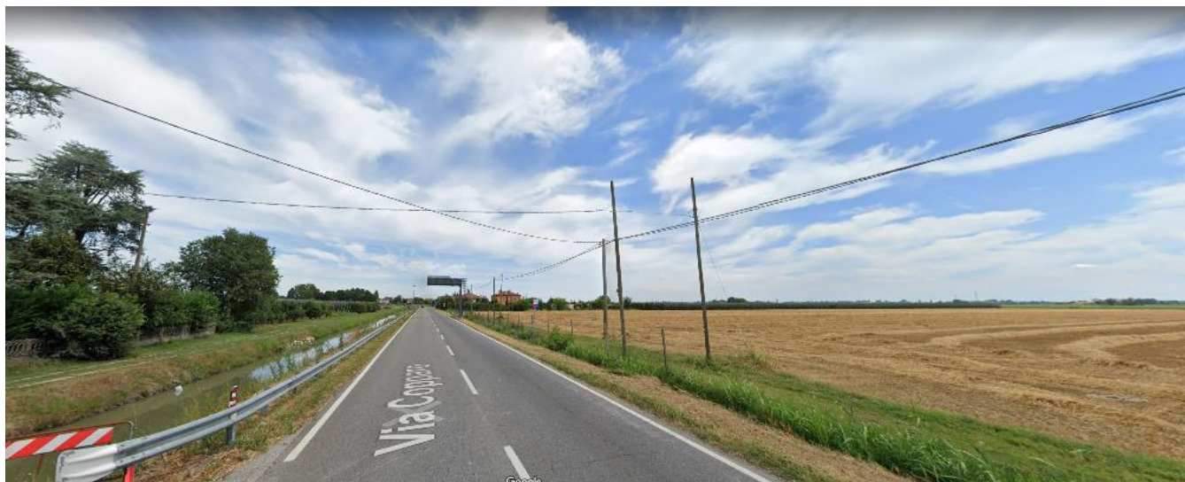
Foto 3. Tracciato del "Fosso Val D'albero" sulla sinistra nell'immagine.