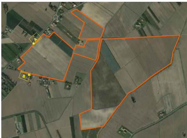
Area installazione campo fotovoltaico (in arancio) con individuazione punti di ripresa A e B

Di seguito si riportano i fotoinserti dell'impianto agrivoltaico ripresi uno da Strada Provinciale n. 2, soggetta a traffico veicolare, uno da via Ca' Tonda su cui si affacciano alcuni edifici