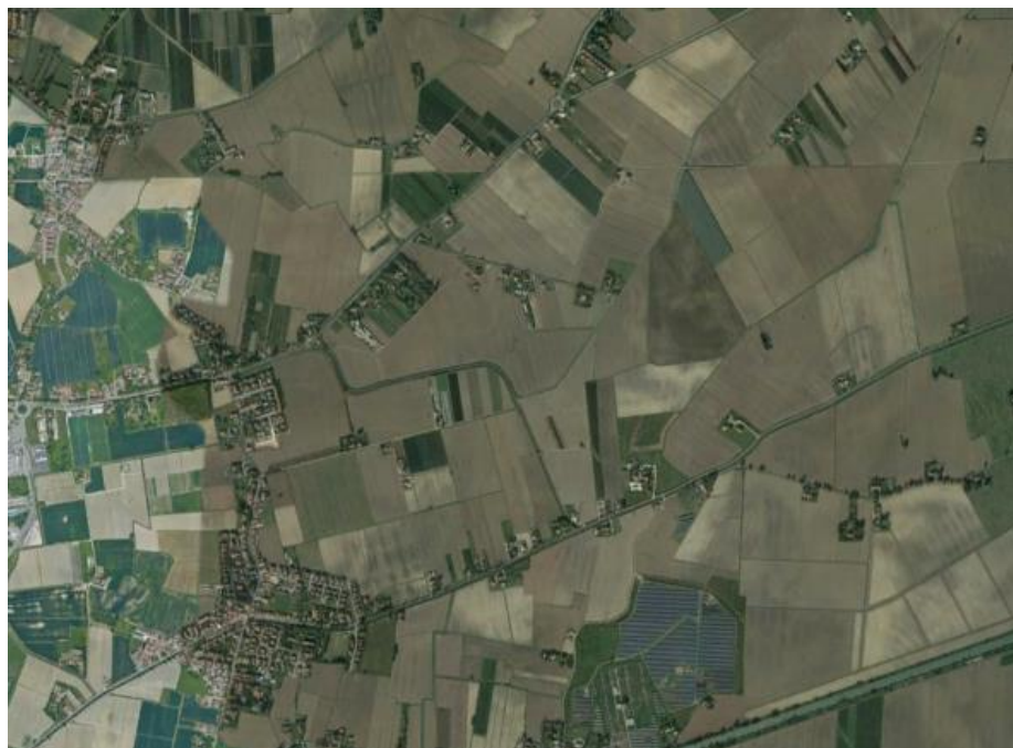
Vista a volo d'uccello dell'area pianeggiante

L'area su cui si inserisce il progetto agrivoltaico ha vocazione agricola