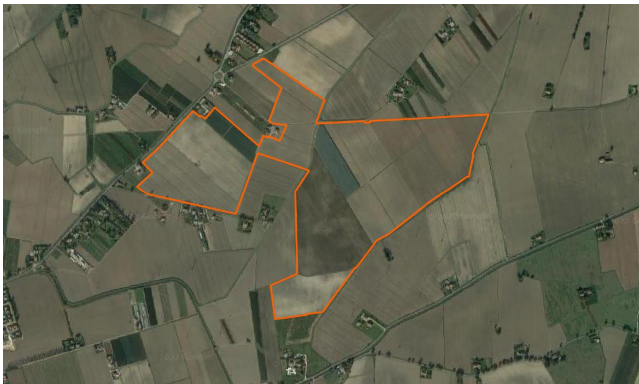
Vista a volo d'uccello dell'area pianeggiante con individuazione area interessata da installazione impianto fotovoltaico