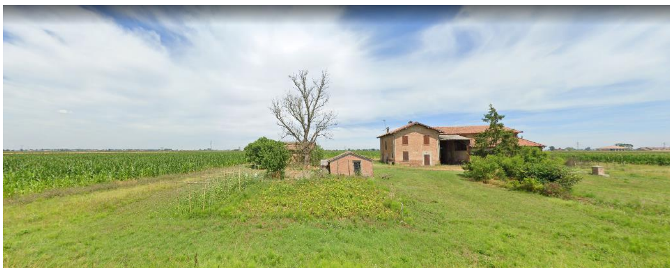
Foto 8. Elementi del contesto antropico: cascine ed aree di recente impostazione di colture permanenti.