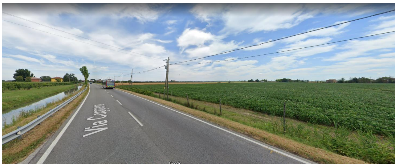
Foto 4. Tracciato del "Fosso Val D'albero" sulla sinistra nell'immagine.