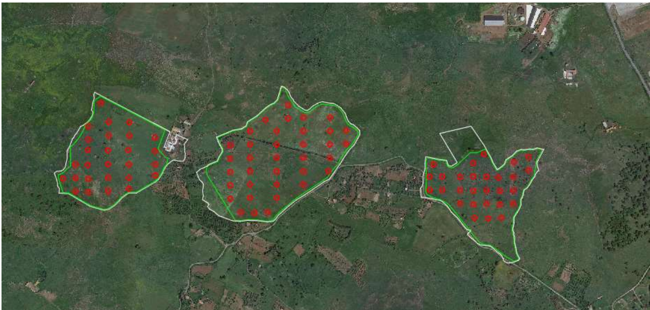
Figura 2. Stralcio Ortofoto – Punti di monitoraggio

Per una superficie dell'area d'impianto (area in verde) di circa 36,7 ettari, ne deriva che i punti da sottoporre ad indagine saranno 91.