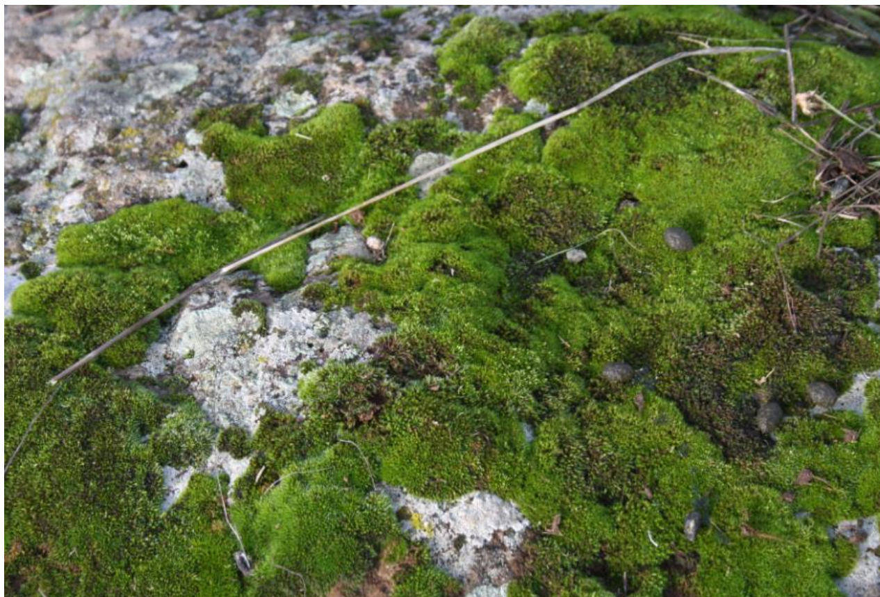
FIGURA 3: MUSCHI, ORGANISMI APPARTENENTI AL PHYLUM BRYOPHYTA.