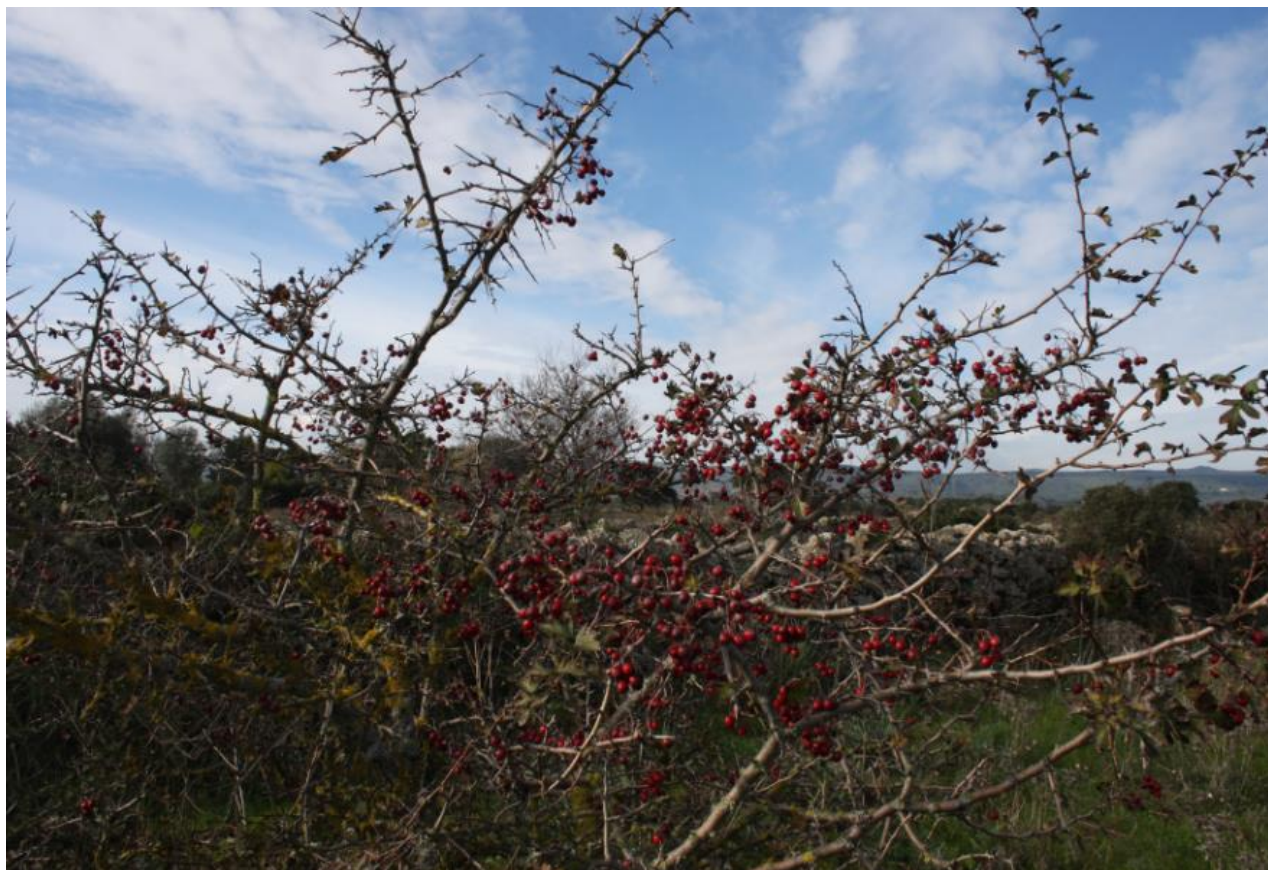
FIGURA 5: IL BIANCOSPINO, CRATAEGUS MONOGYNA .