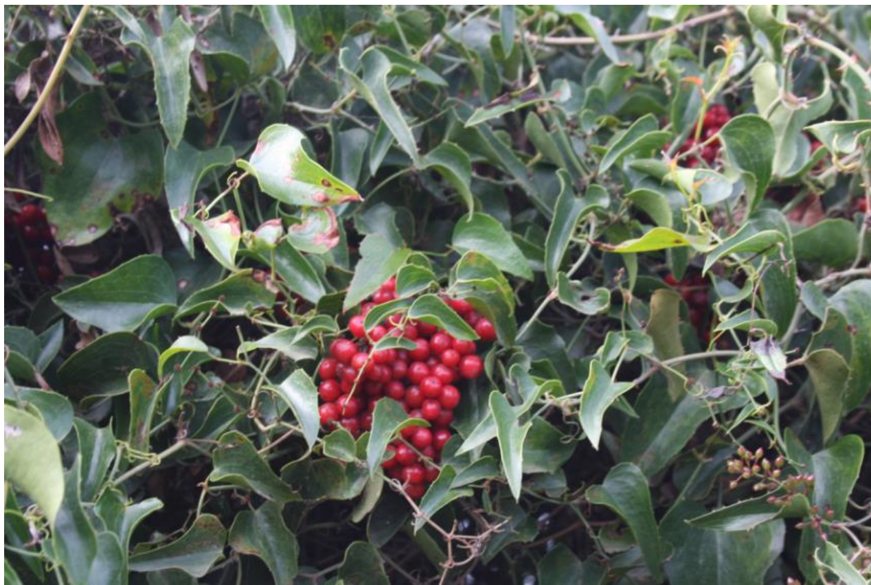
FIGURA 7: SMLAX ASPERA .