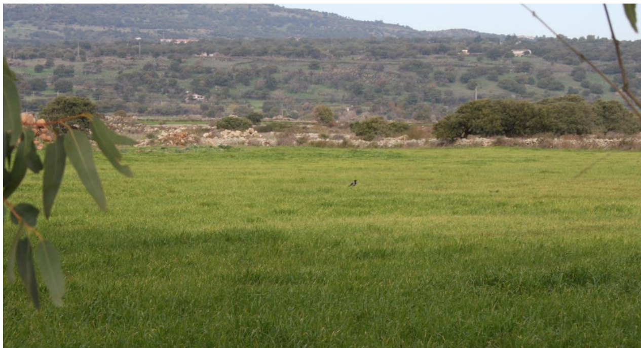
FIGURA 12: CORNACCHIA GRIGIA, CORVUS CORNIX .