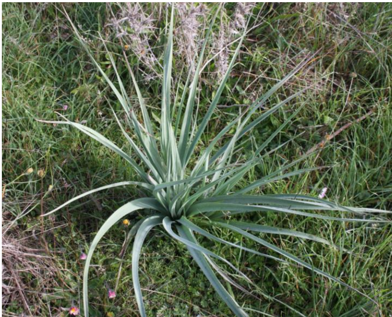
FIGURA 2: PIANTA DI ASFODELO.