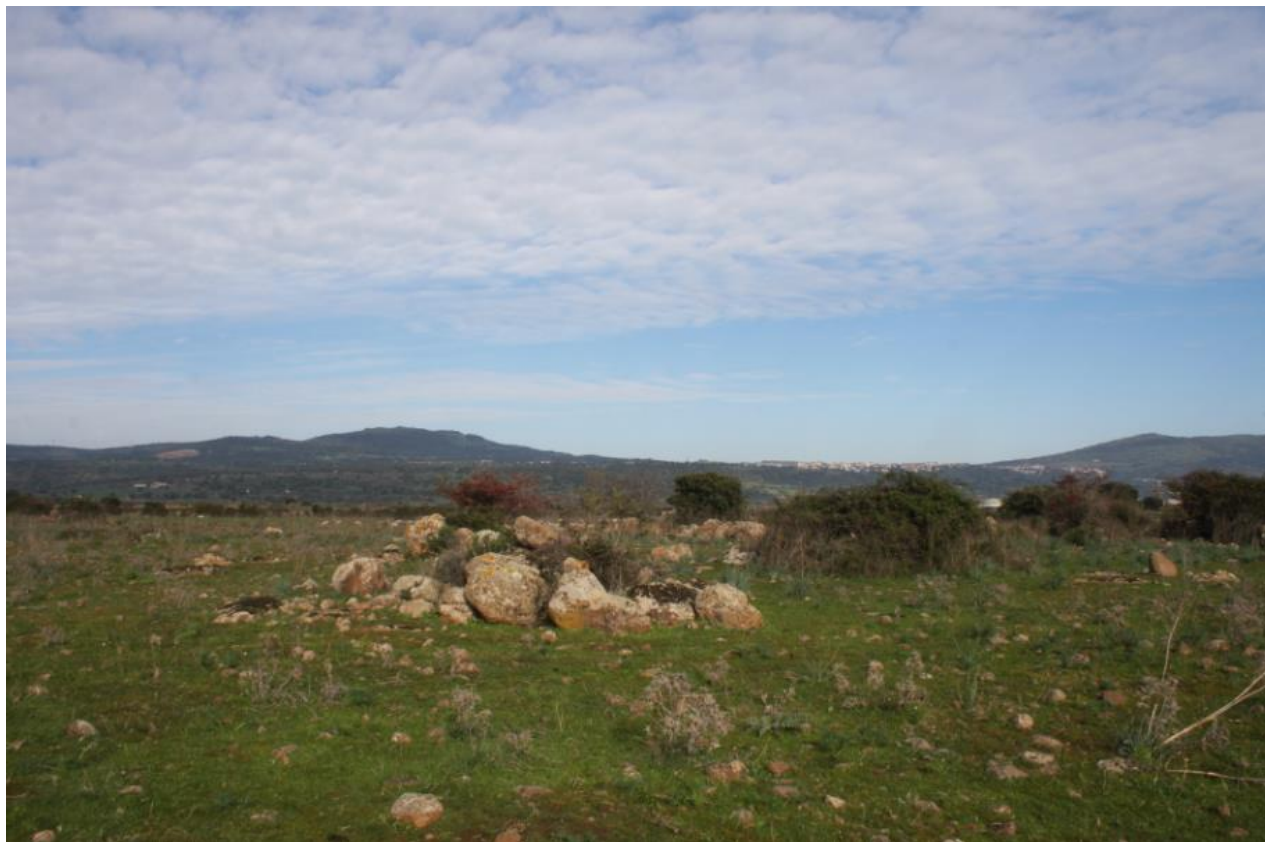
FIGURA 1: VISTA DEL LOTTO DI PROGETTO EST.