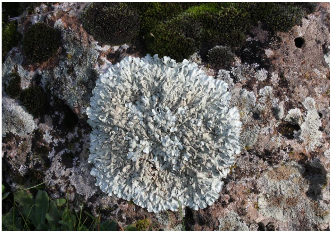
FIGURA 6: UN LICHENE PRESENTE SU SUBSTRATO ROCCIOSO.