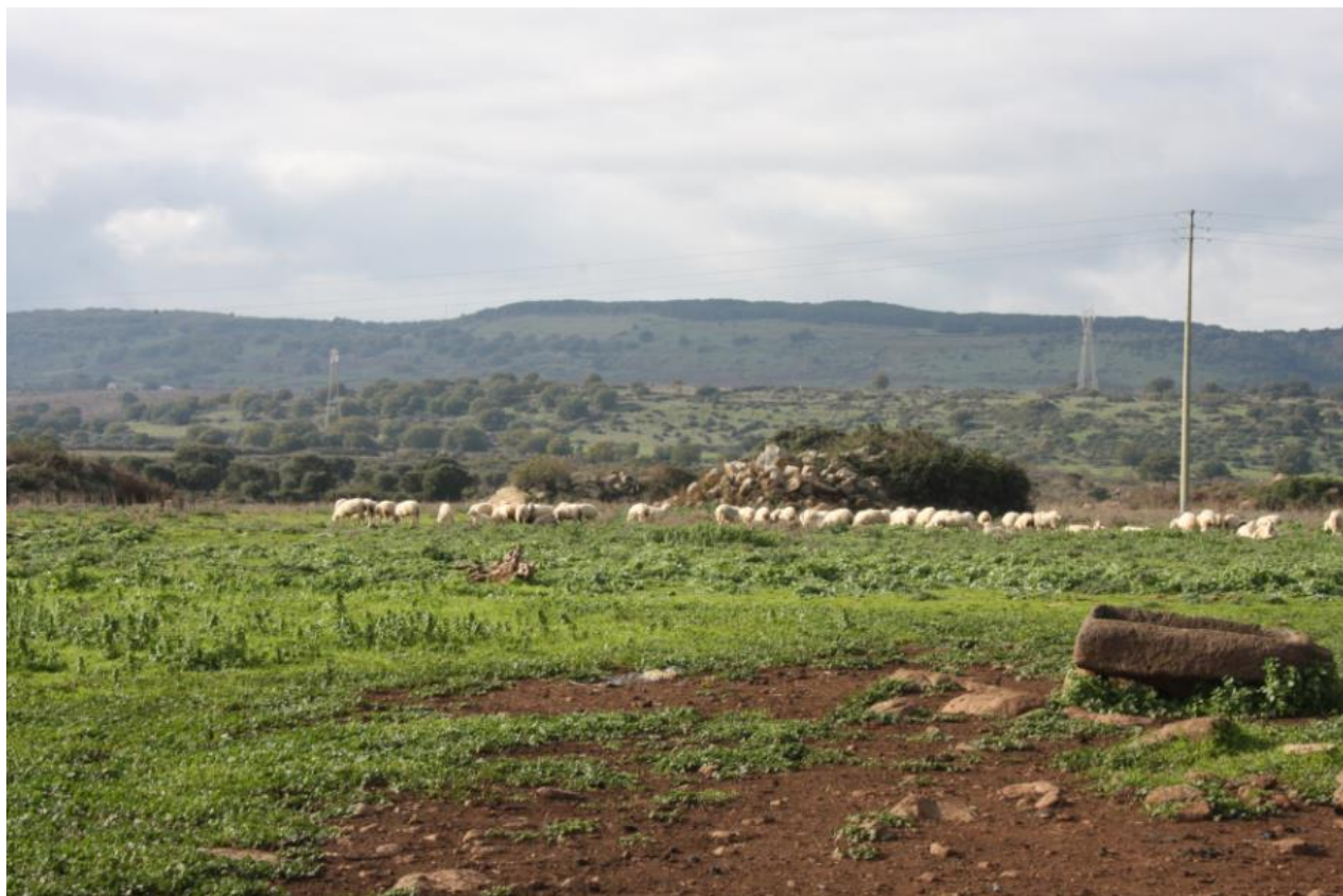
FIGURA 14: VISTA DEL LOTTO OVEST.