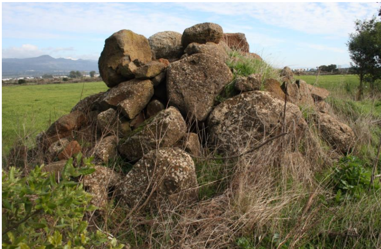
FIGURA 11: CUMULO DI PIETRA PRESENTE NEL LOTTO CENTRALE.