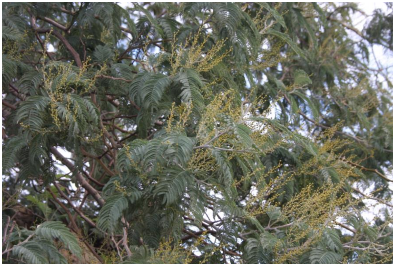
FIGURA 9: ACACIA DEALBATA .