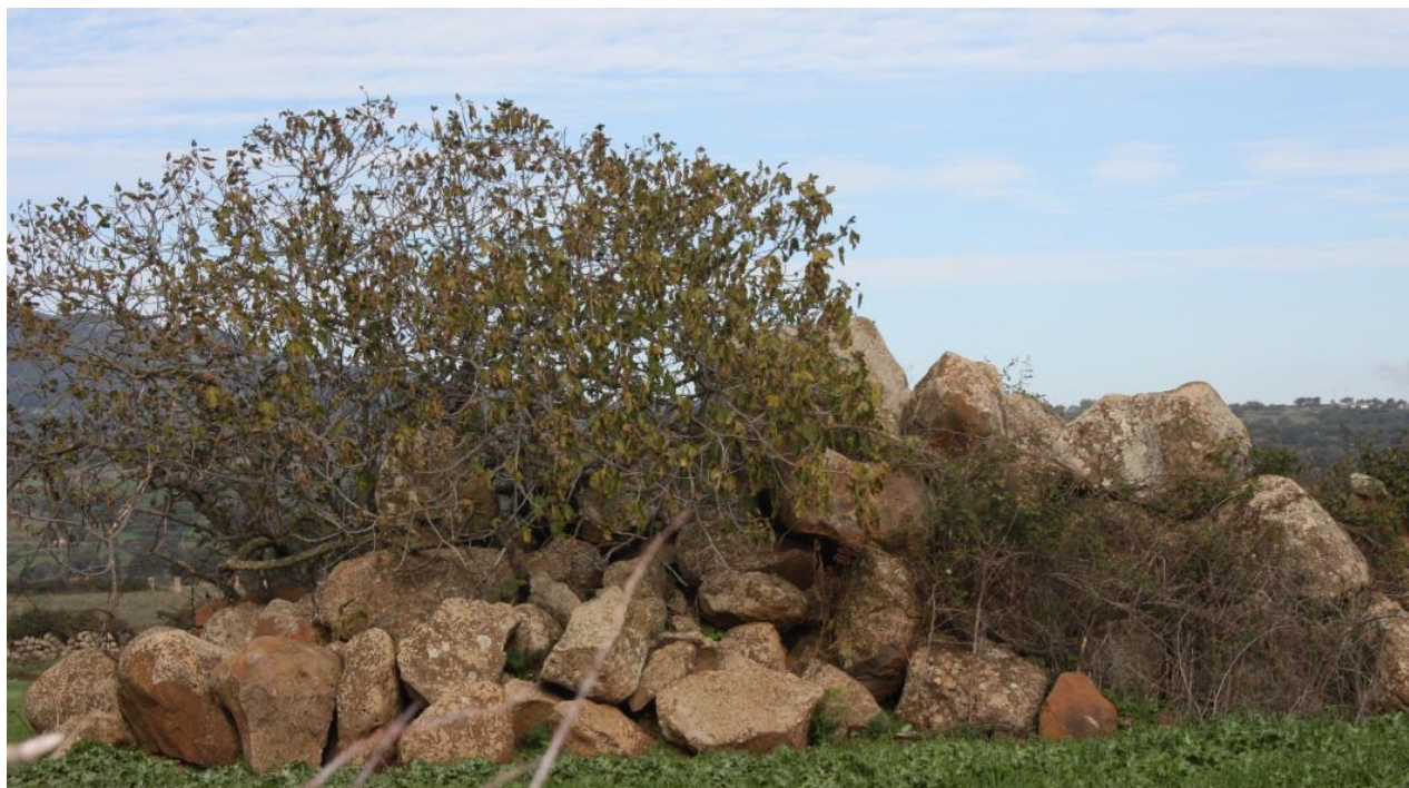
FIGURA 13: ALBERO DI FICUS CARICA .