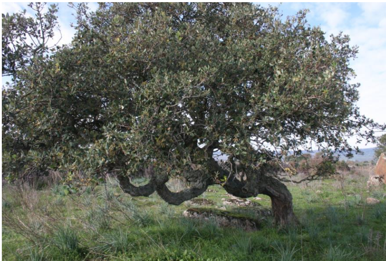
FIGURA 4: QUERCUS SUBER .