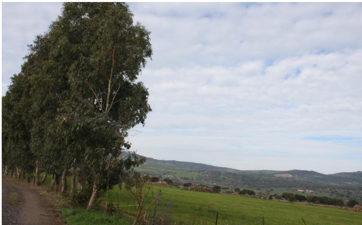
FIGURA 10: FILARE DI EUCALYPTUS ALL'INTERNO DEL LOTTO CENTRALE.