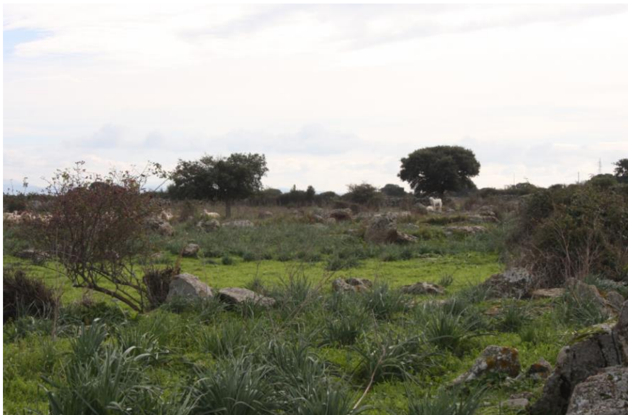
FIGURA 8: PASCOLO IN ATTO DURANTE IL SOPRALLUOGO IN CAMPO.