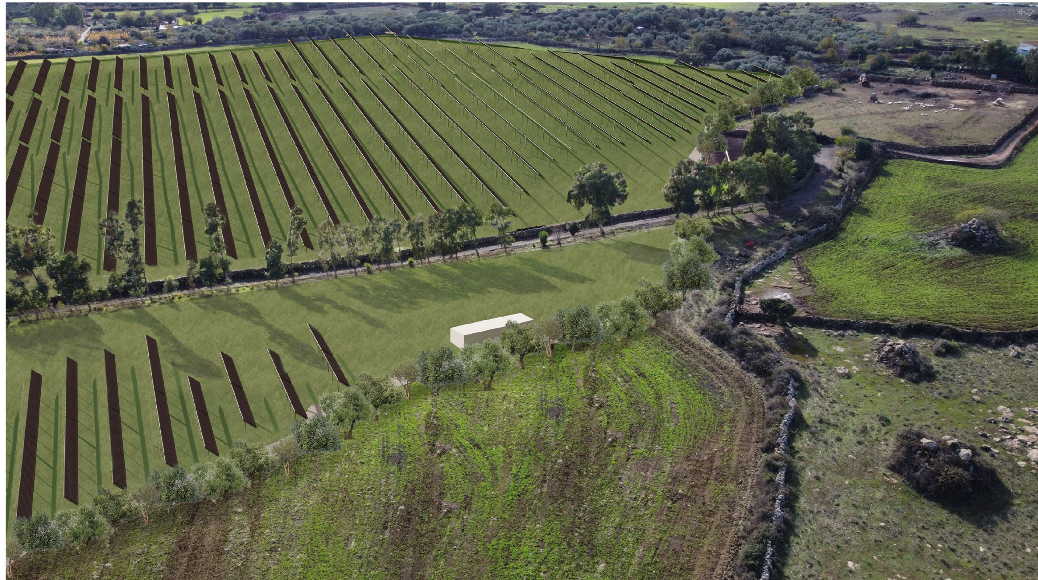
FOTOSIMULAZIONE PROSPETTICA DELL'IMPIANTO VISTA C