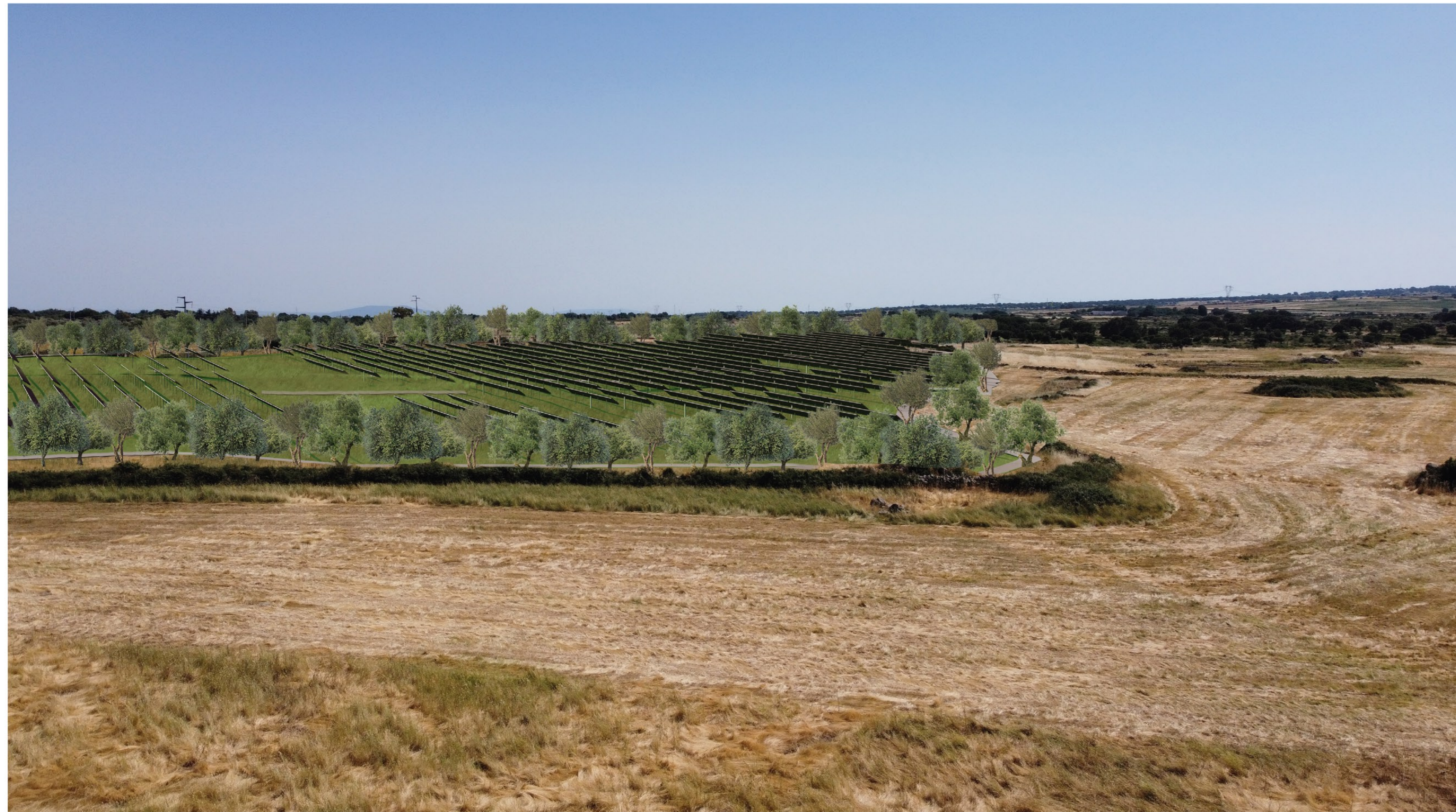
FOTOSIMULAZIONE PROSPETTICA DELL'IMPIANTO VISTA A