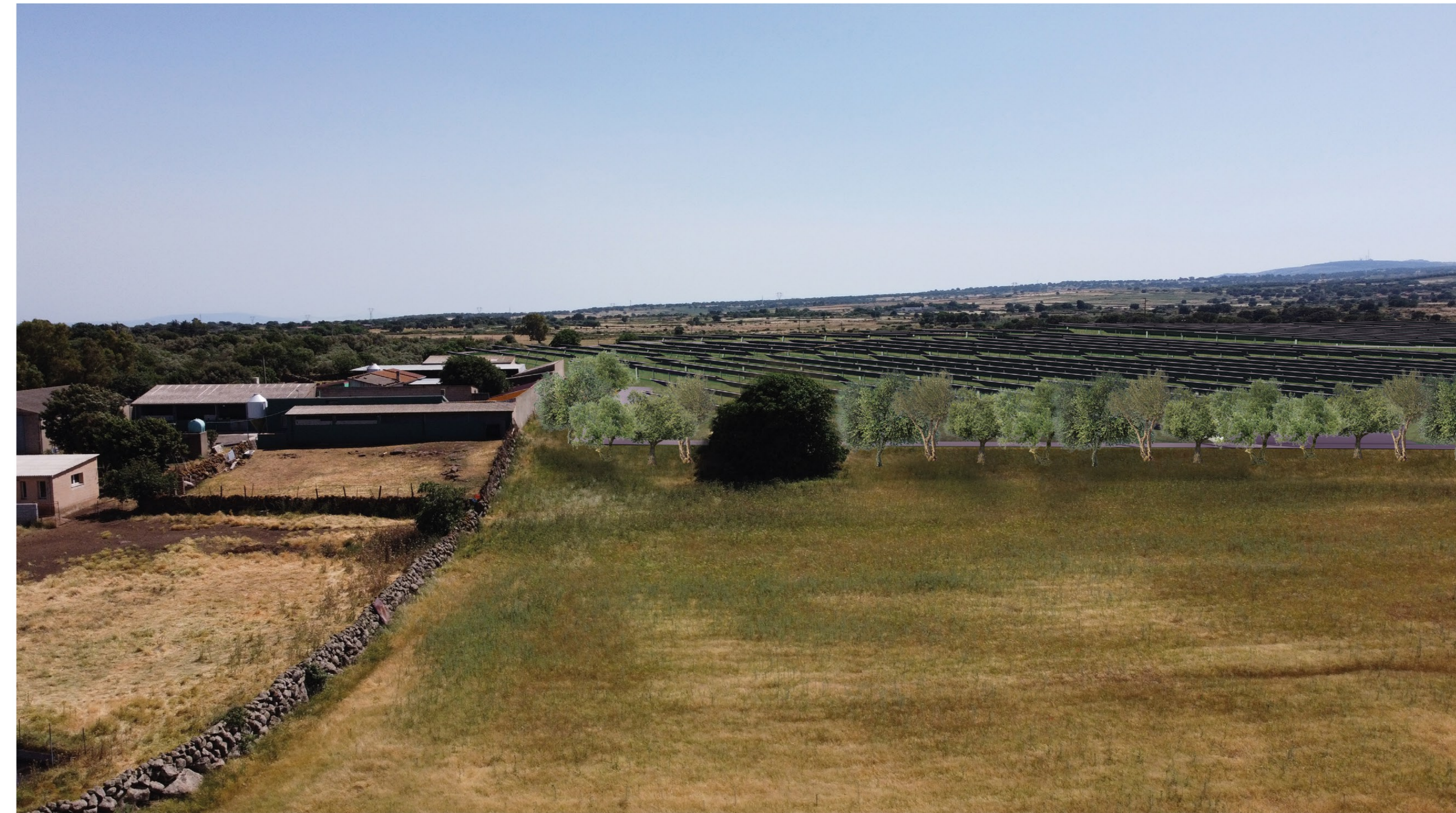
FOTOSIMULAZIONE DA STRADA DELL'IMPIANTO VISTA B