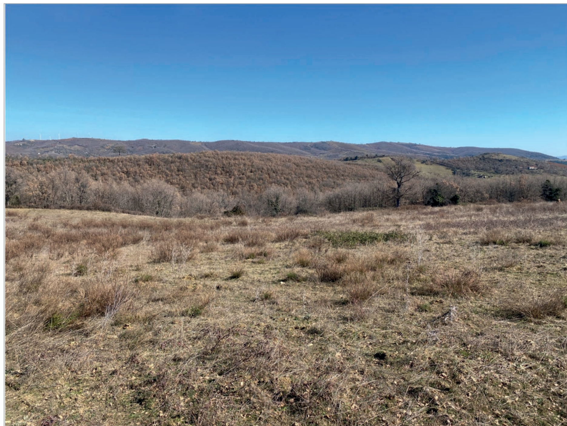
STATO DI FATTO - ANTE OPERAM