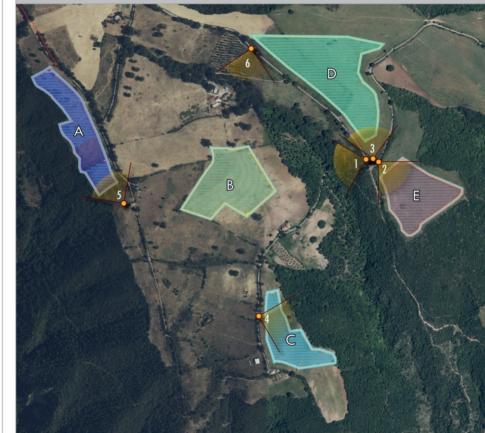
KEY-PLAN IMPIANTO e con ottici su ortofoto - Scala 1:7.000