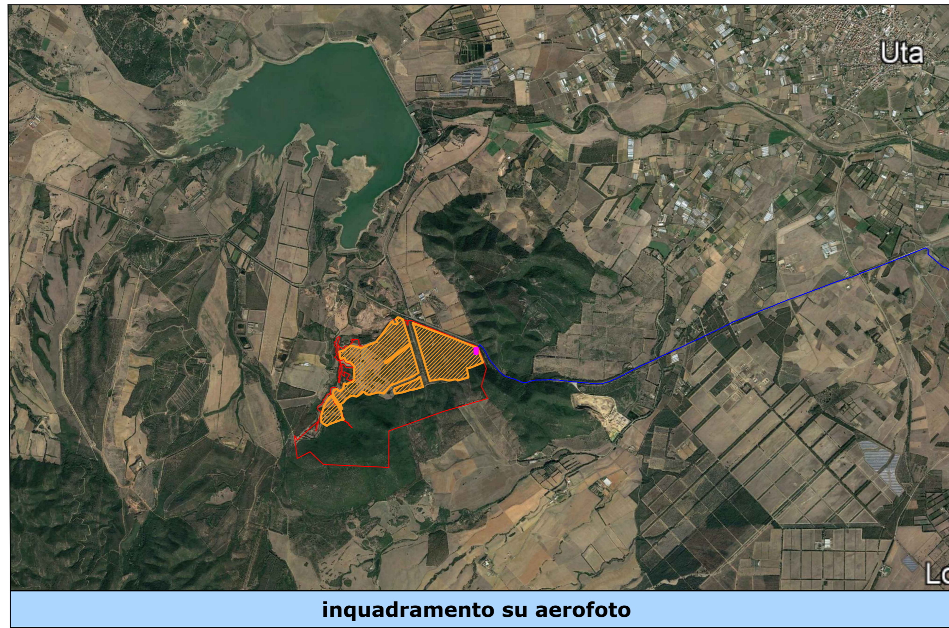
inquadramento su aerofoto