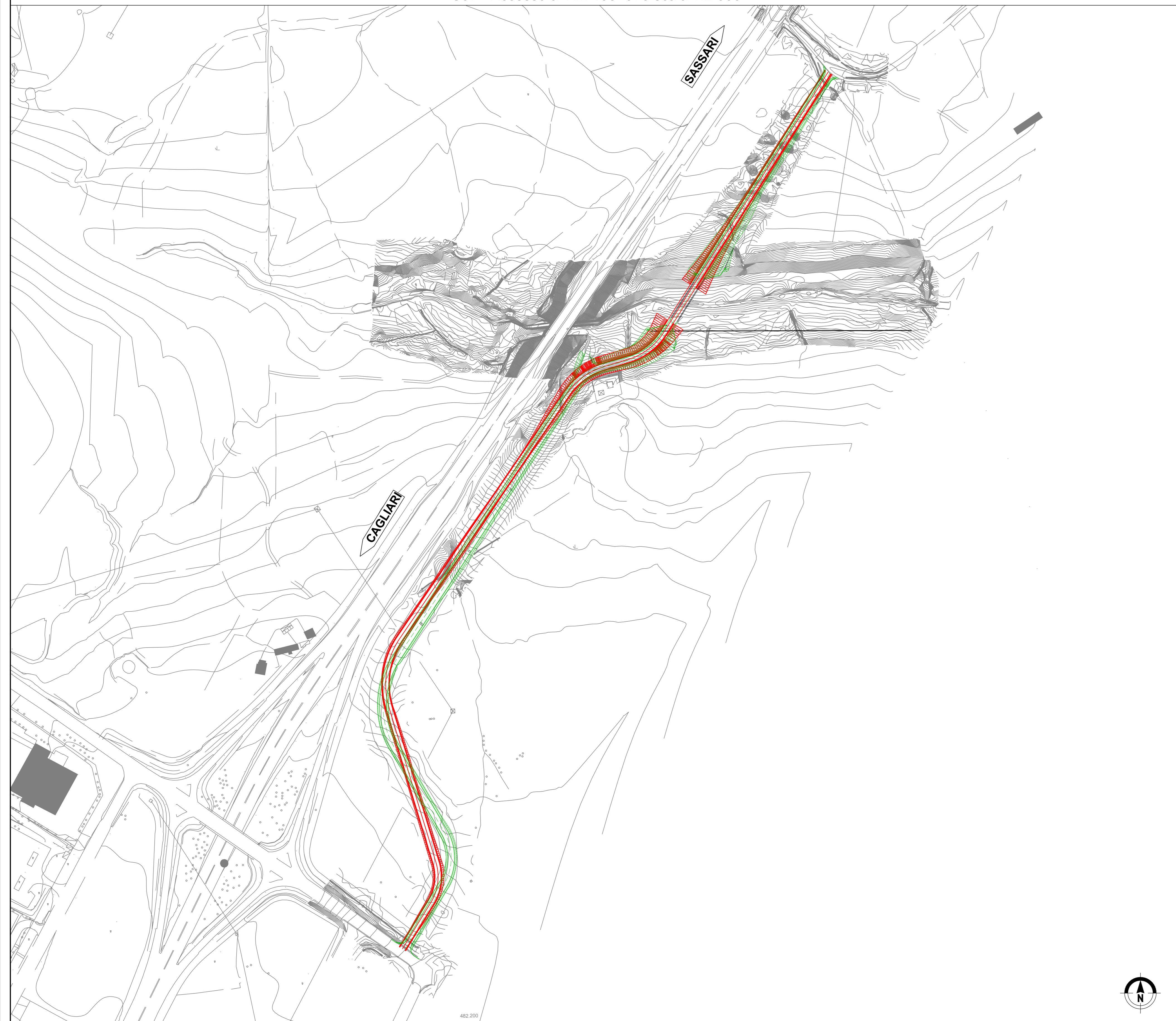
S07 - Accesso al Km 138+970 scala 1:2.000