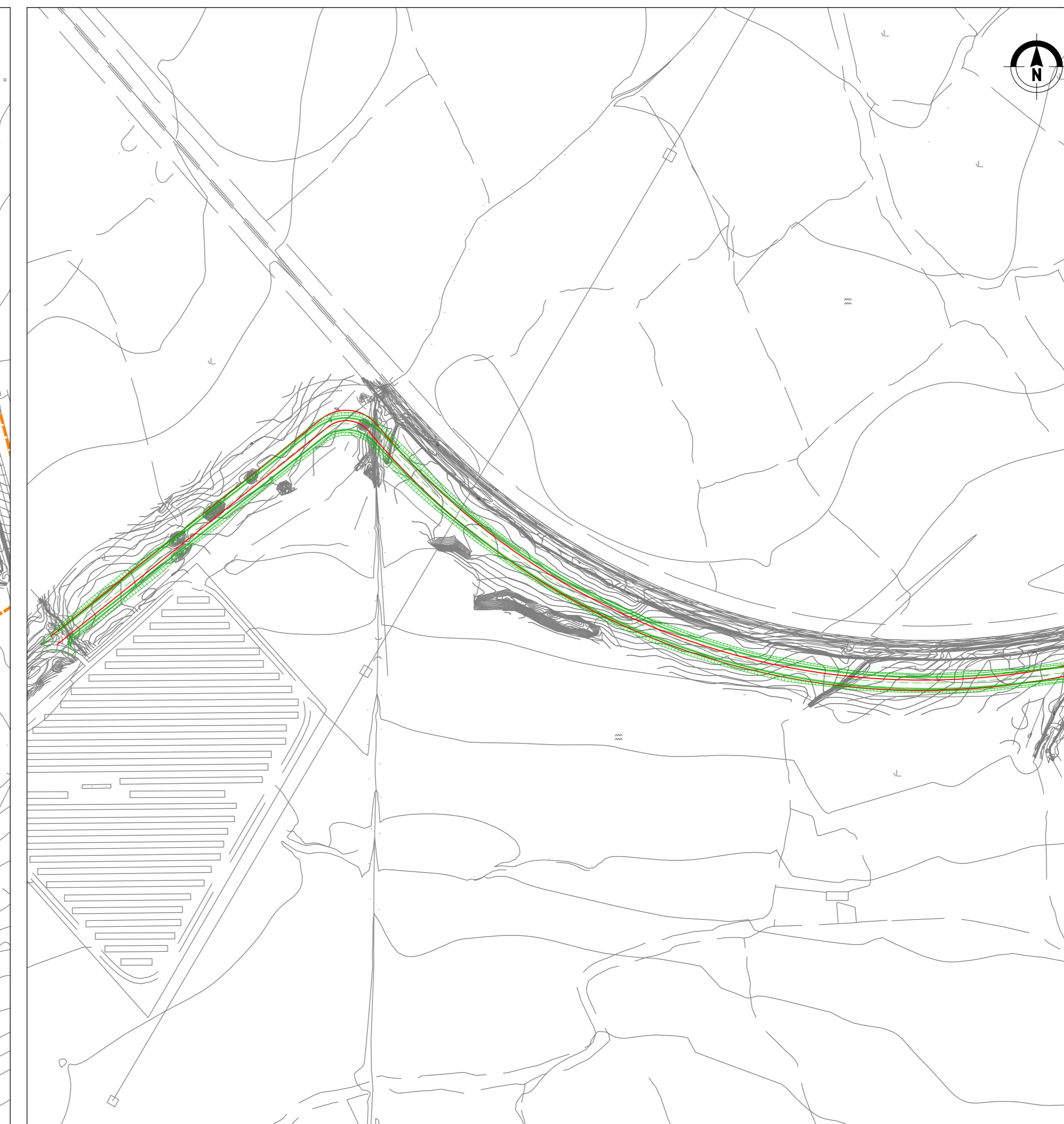
S08 - Accesso al Km 138+950 scala 1:2.000