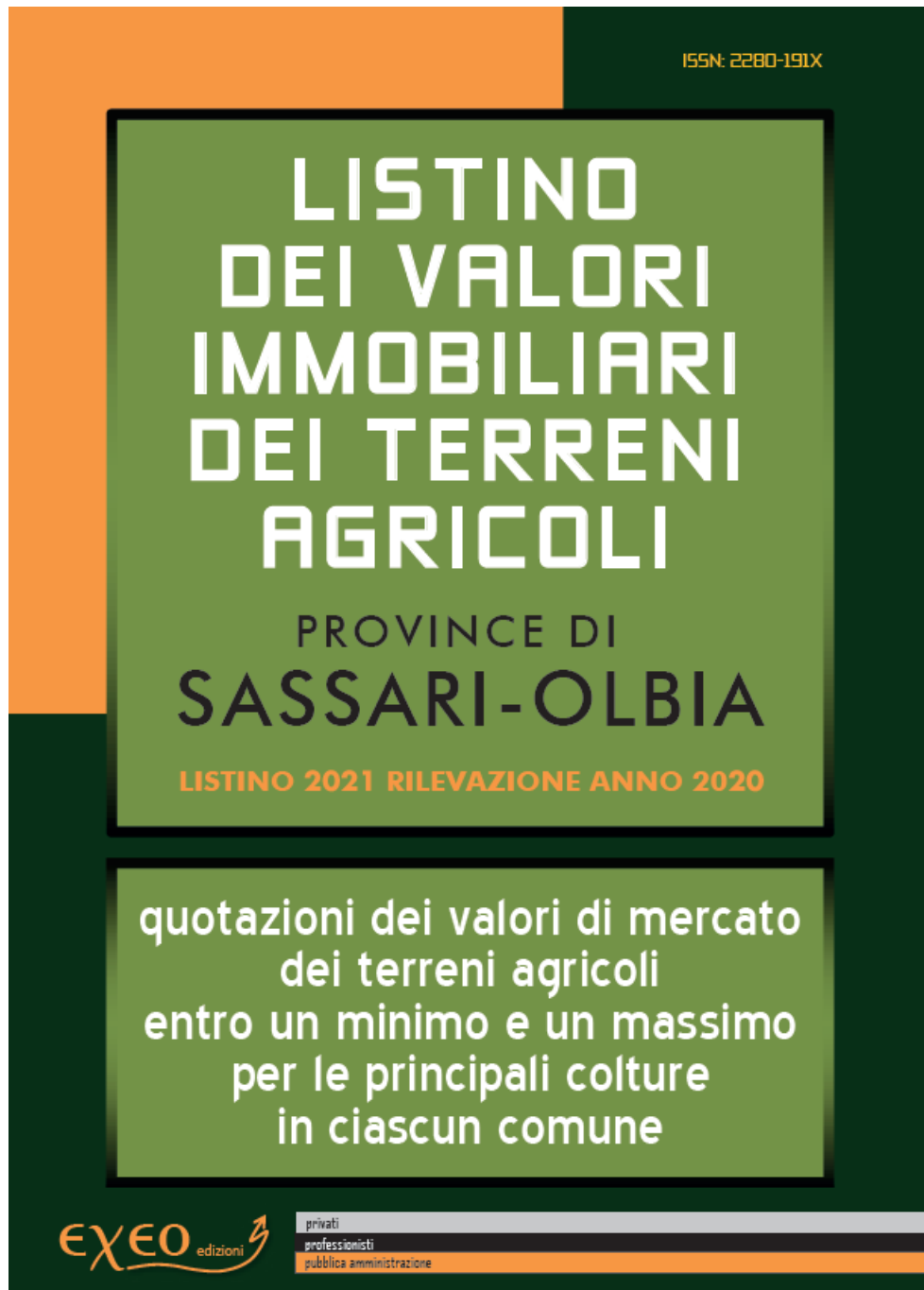
Figura 2: Listino terreni Provincia Sassari-Olbia

Vista la composizione fondiaria esistente e considerato che la nuova opera non determinerà la formazione di aree reliquate non si prevedono costi per le loro acquisizioni.