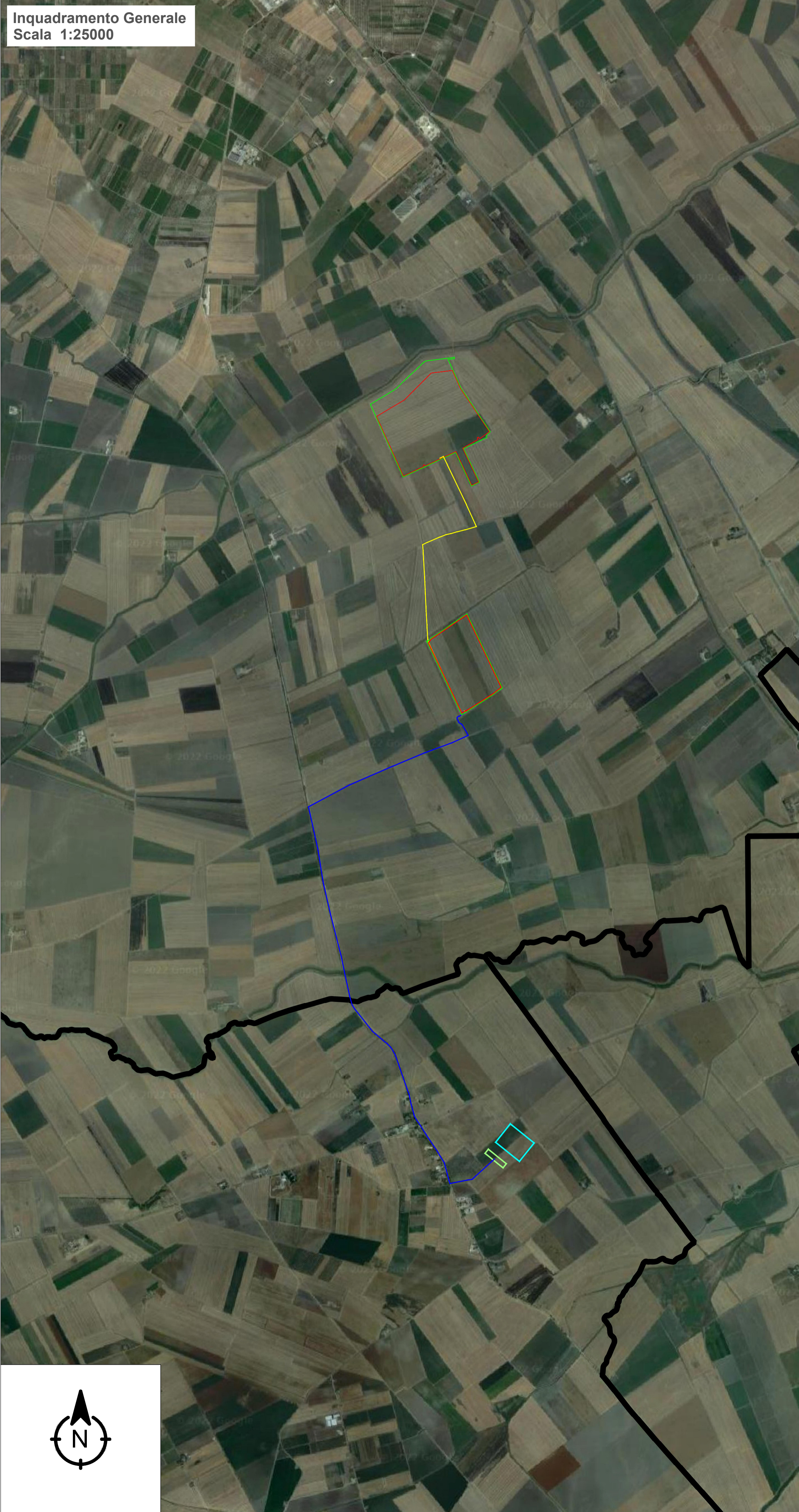
Inquadramento Generale Scala 1:25000