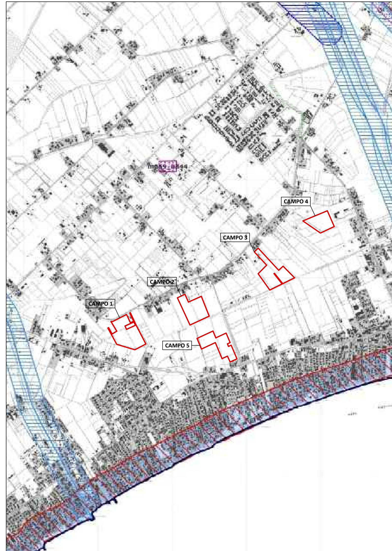
LEGENDA PTPR TAVOLA B