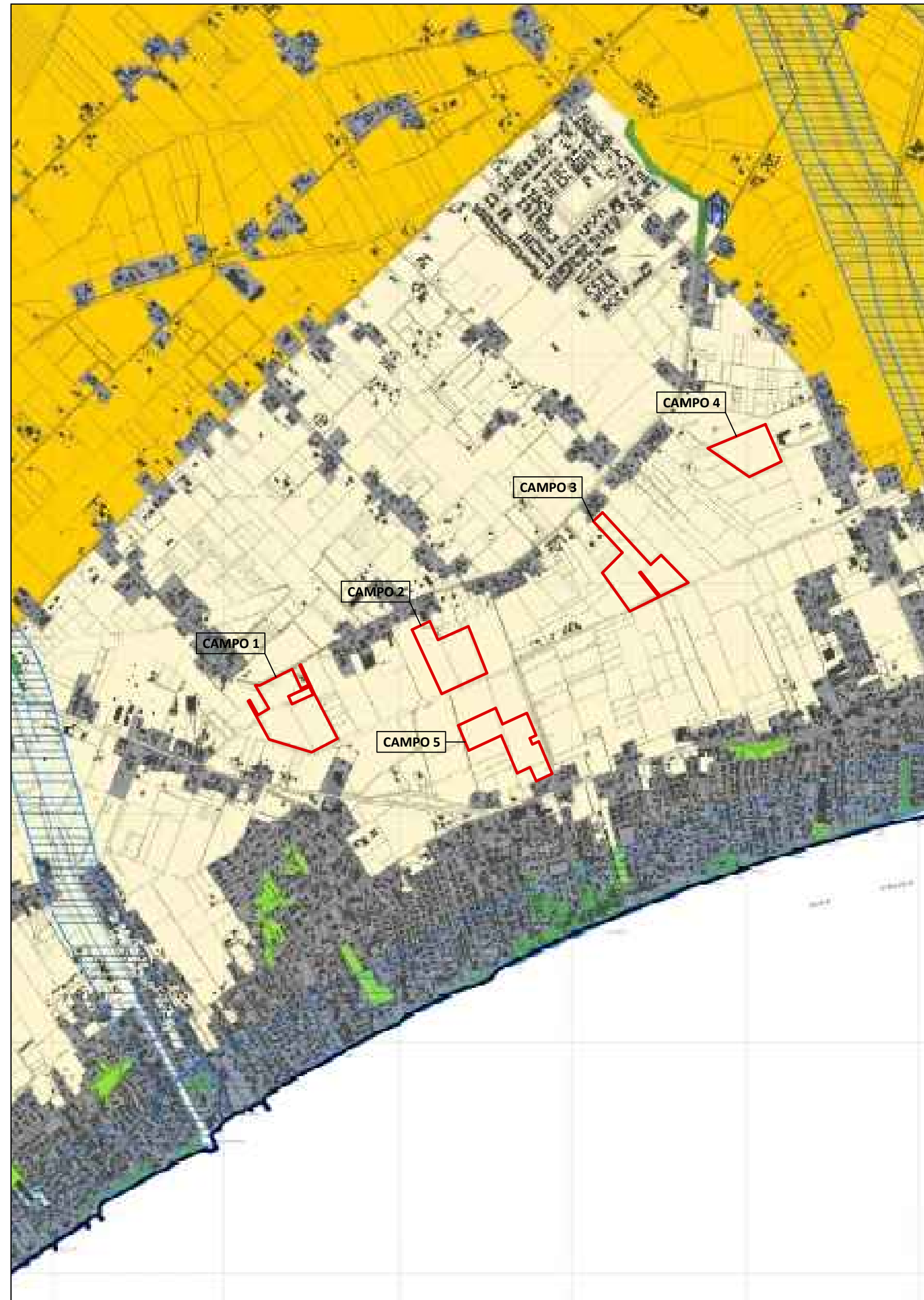
LEGENDA PTPR TAVOLA A