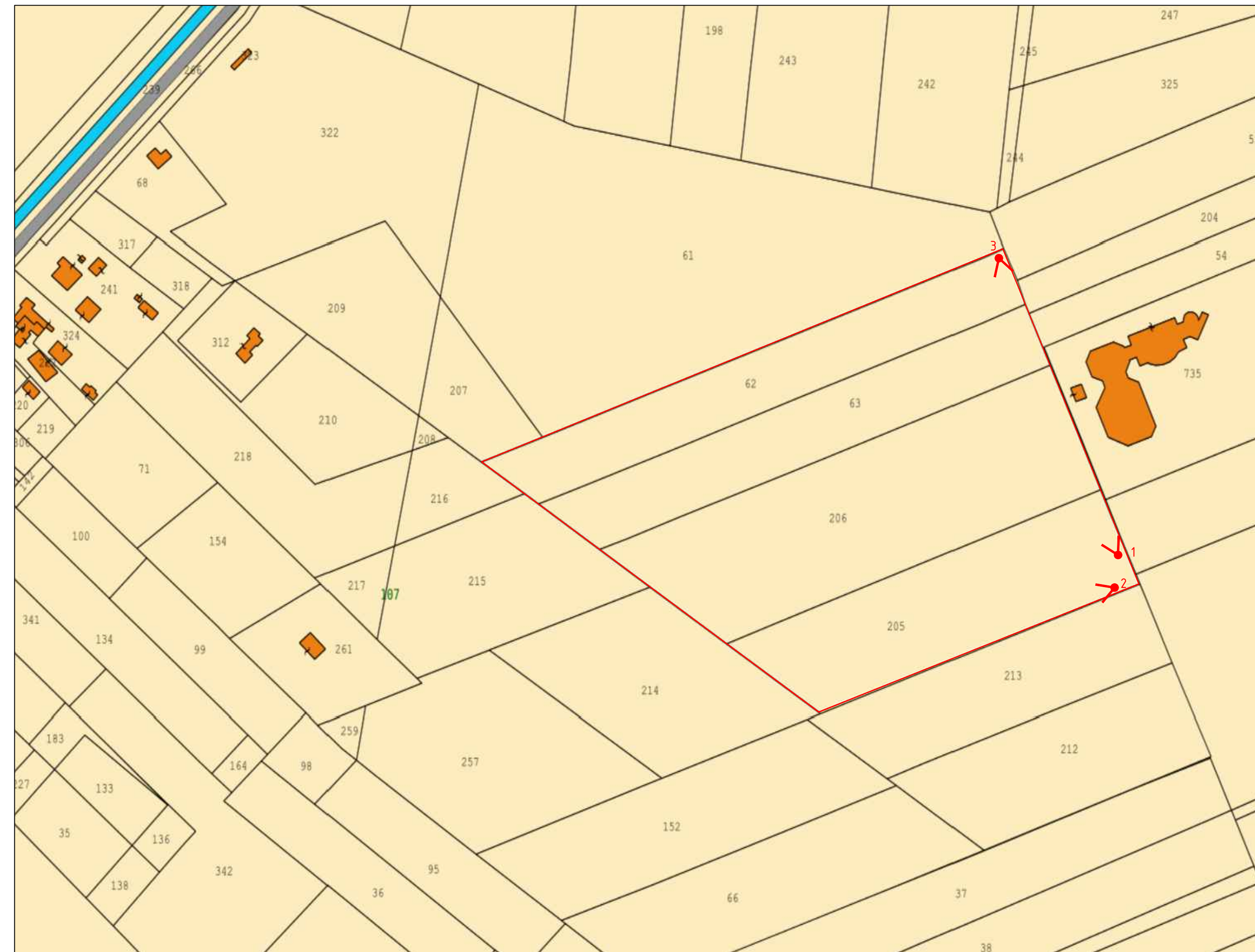
PLANIMETRIA GENERALE COMPARTO 4

Sono vietati l'uso e la riproduzione non autorizzati del presente elaborato