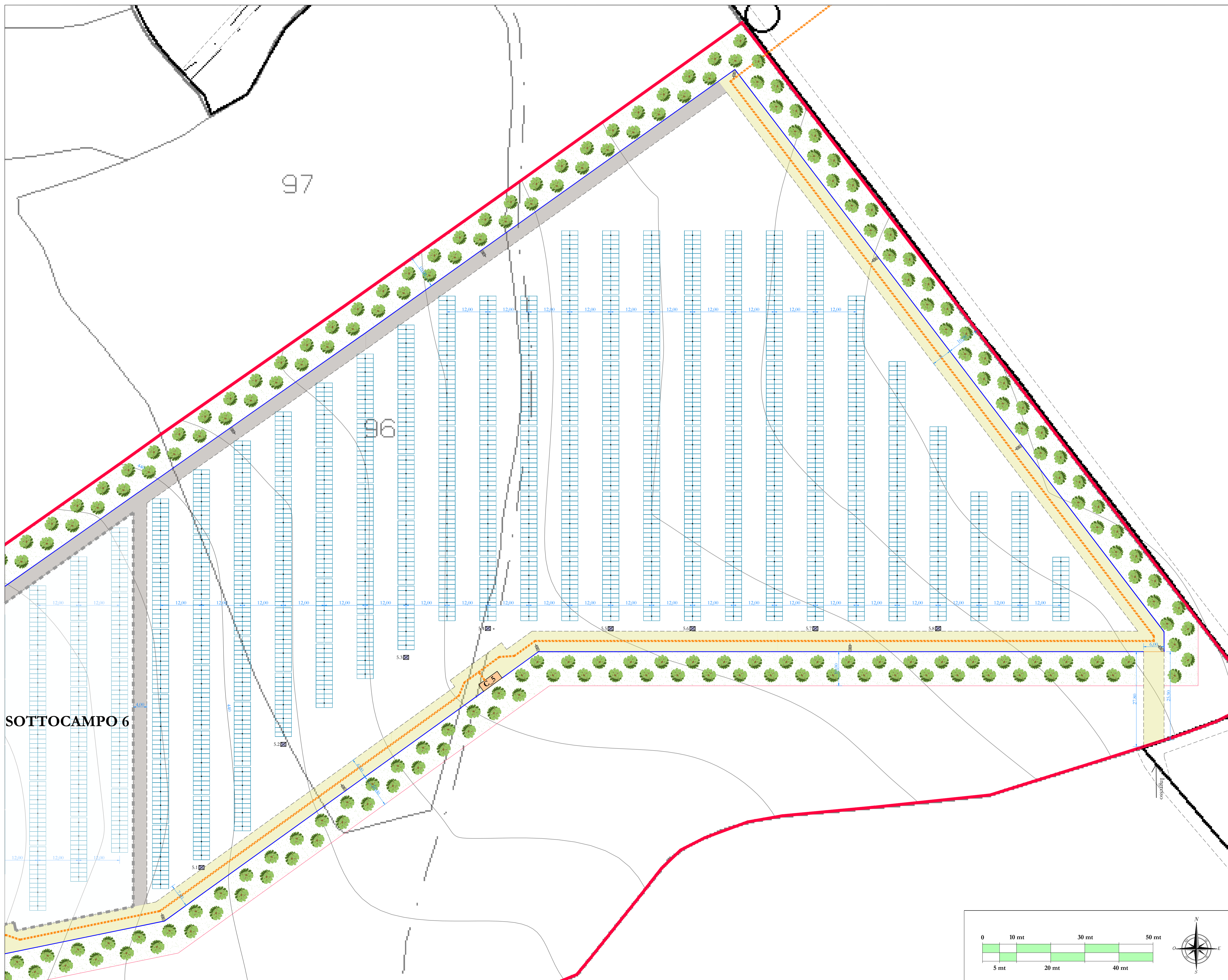
Planimetria sottocampo 5 "AREA 2" POST OPERAM - scala 1:500