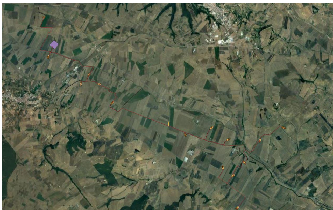
Figura 2 - Inquadramento Territoriale - Ortofoto

L' opera oggetto di studio, ricade in territorio di Banzi (PZ), Palazzo San Gervasio (PZ) e Spinazzola (BT). L'area fa parte di un territorio precollinare appartenente all'alto bacino del torrente Basentello, affluente del fiume Bradano, a un'altitudine compresa fra circa 350 e 450 m s.l.m. La superficie topografica si