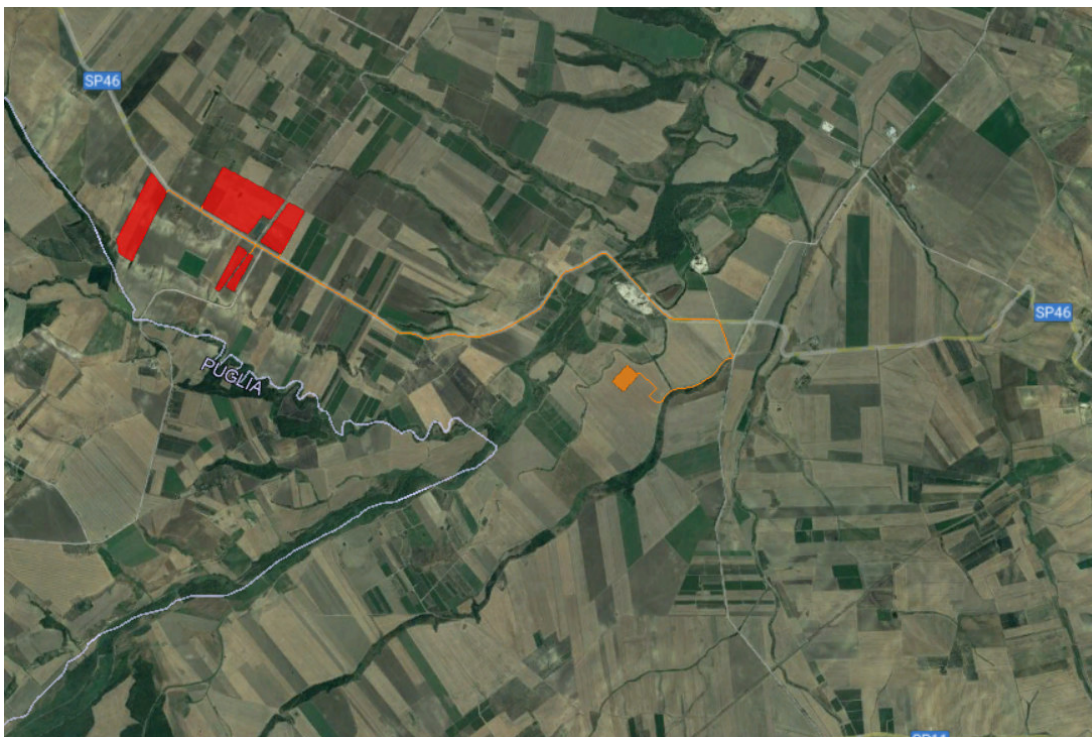
Figura 2.1: Localizzazione dell'Area di Intervento, in rosso l'area recintata, in arancio la linea di connessione e la SST

Il sito ubicato al confine tra Puglia e Molise è tipico del Paesaggio dei Monti Dauni caratterizzato da terrazzamenti che degradano nel fondovalle, con un andamento da pianeggiante a debolmente ondulato, con quote che oscillano da alcune decine di metri fino a 200 metri sul livello del mare.