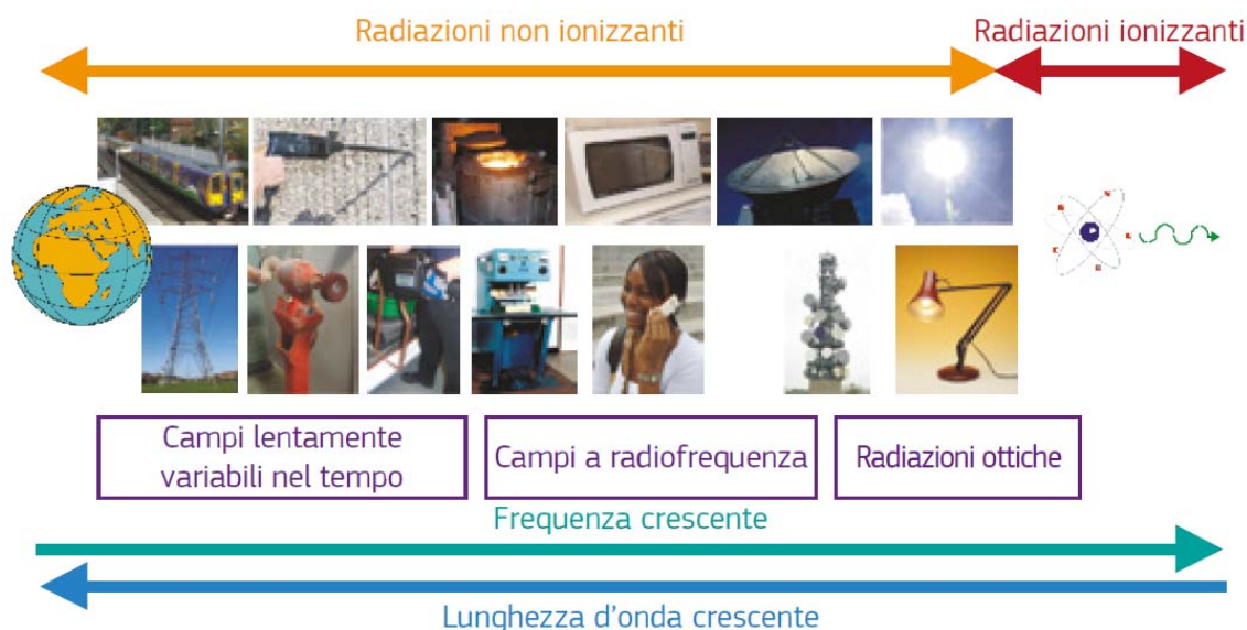
Grafico esplicativo della suddivisione delle radiazioni in non ionizzanti e ionizzanti

Si consulti in proposito l'immagine appresso indicata: