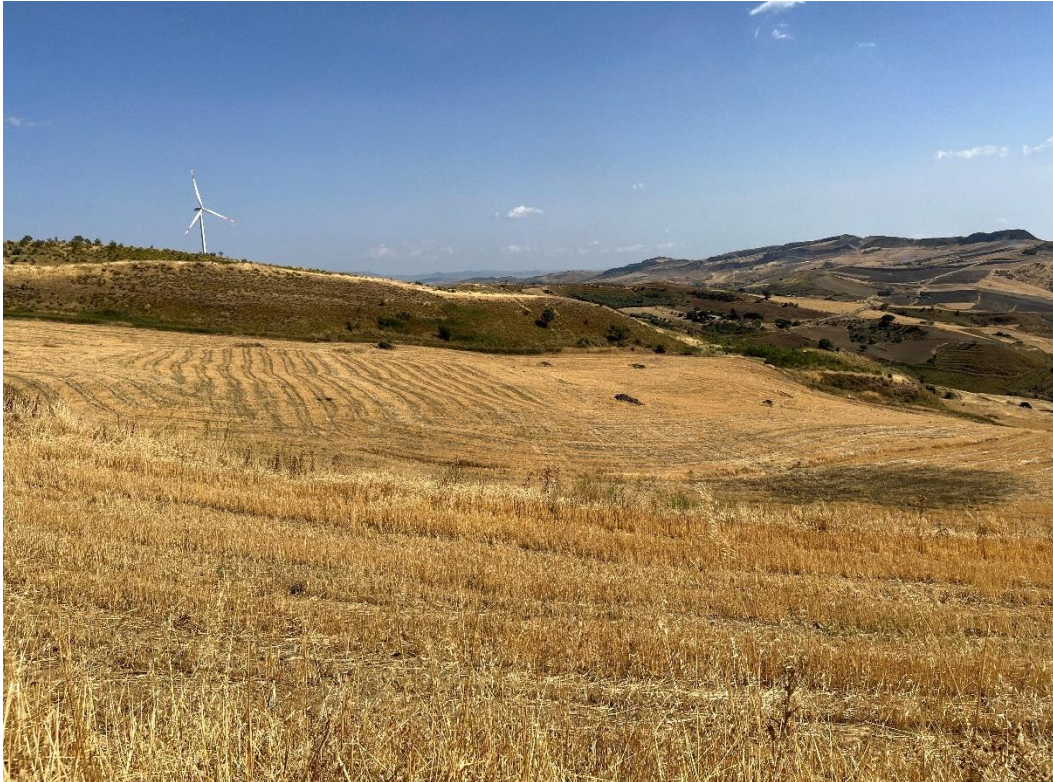
Figure 10- IMG_1475.JPG