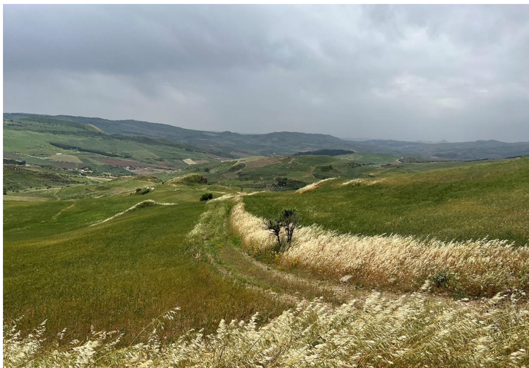
Figure 25- IMG_4926.JPG