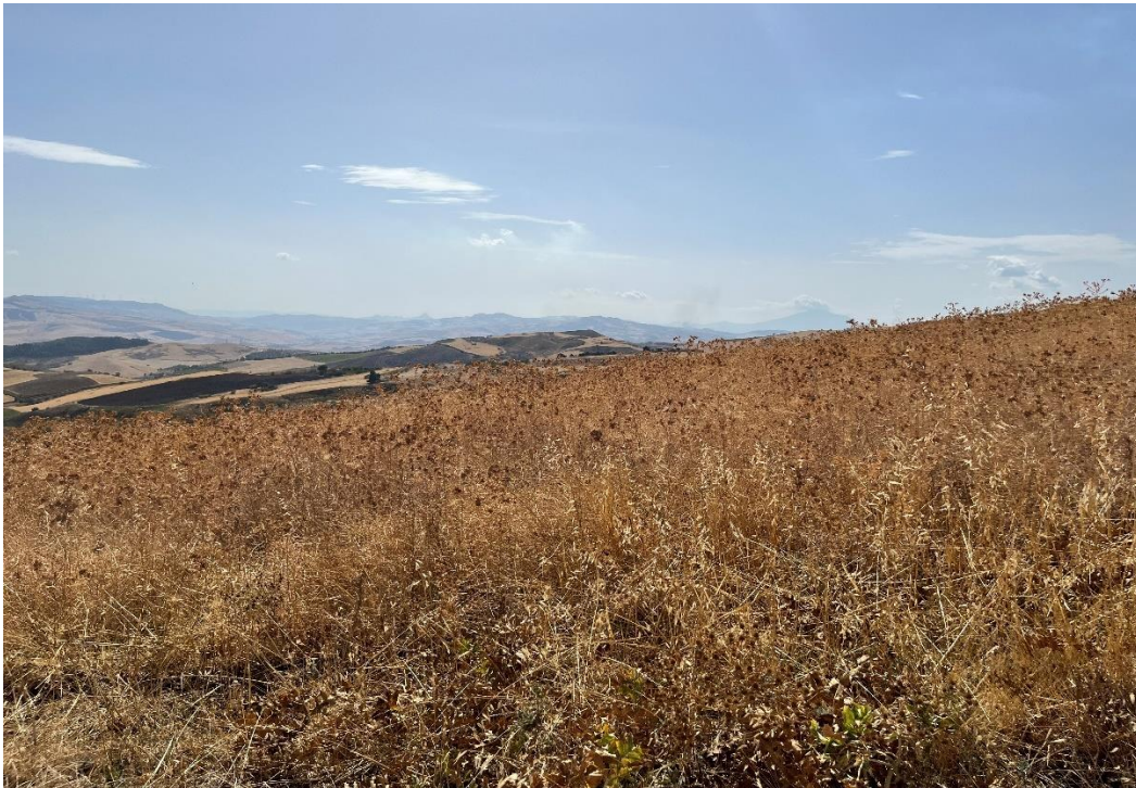
Figure 16- IMG_1512.JPG