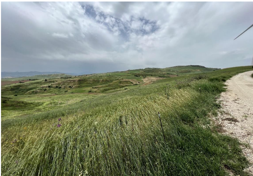
Figure 21- IMG_4921.JPG