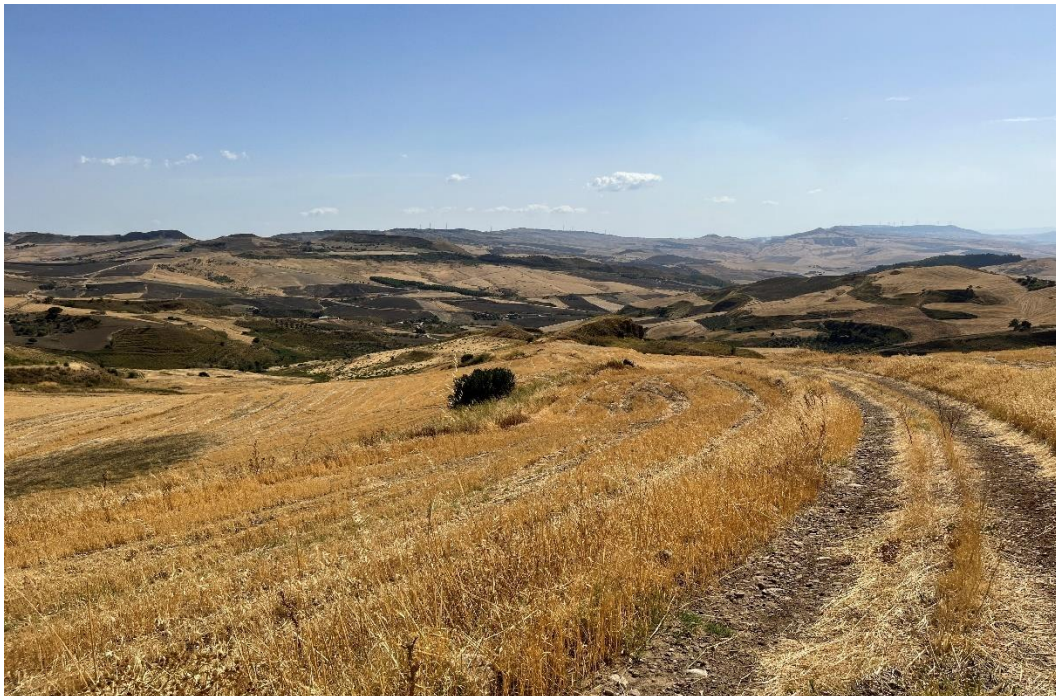
Figure 11- IMG_1480.JPG