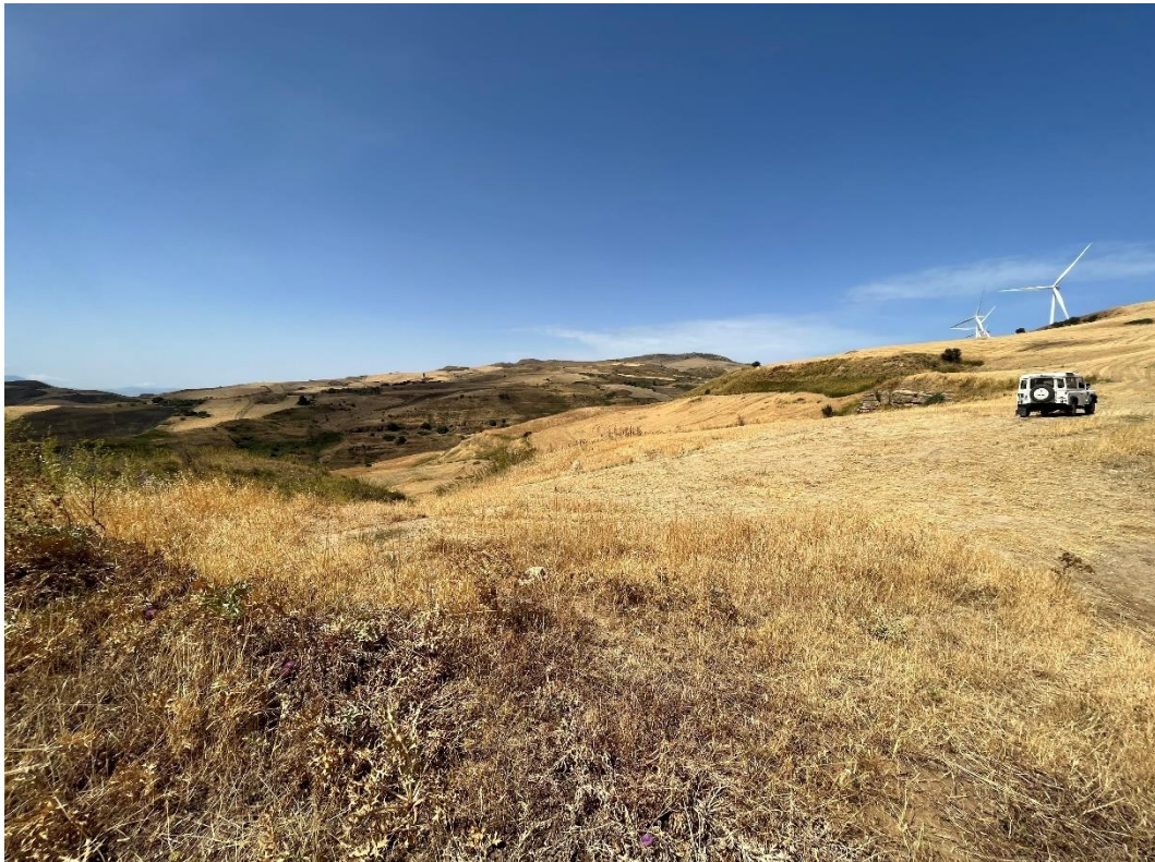
Figure 4- IMG_1419.JPG