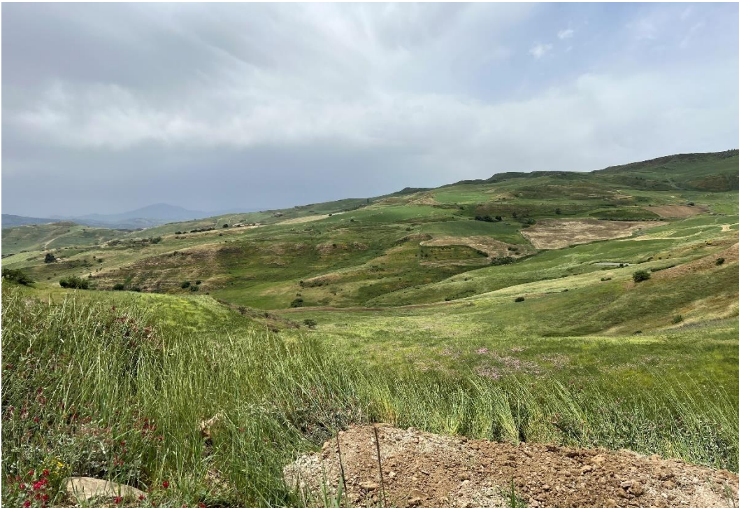
Figure 23- IMG_4923.JPG