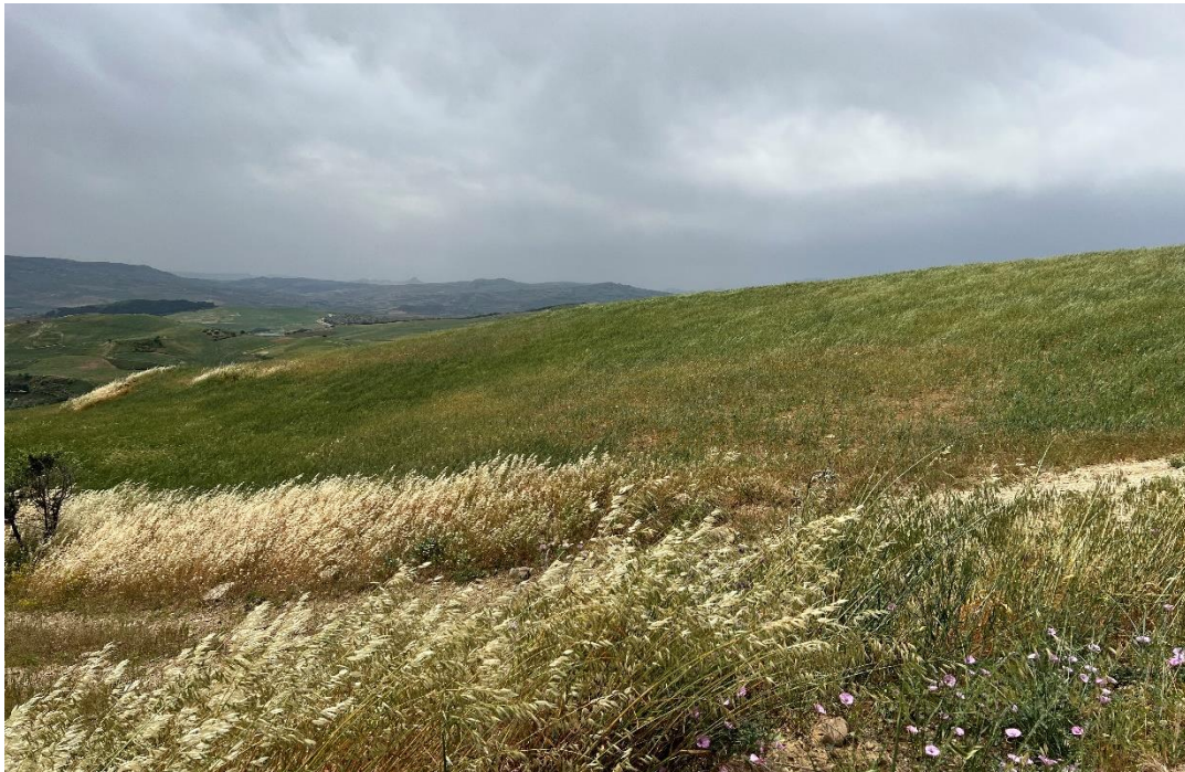
Figure 24- IMG_4925.JPG