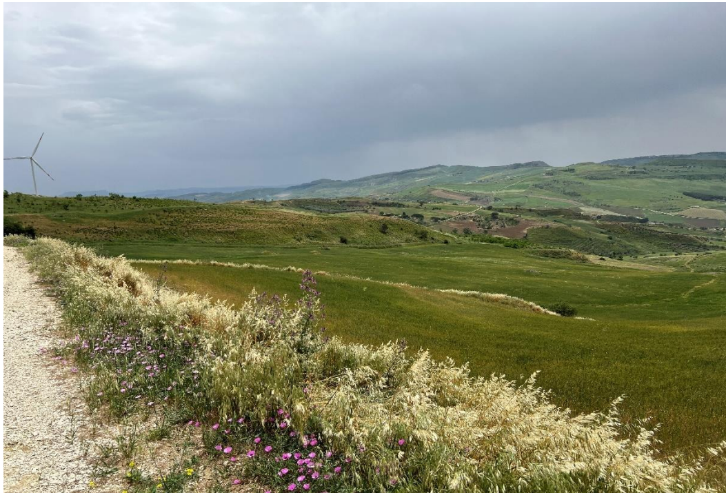
Figure 26- IMG_4928.JPG