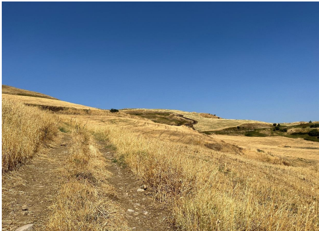
Figure 9- IMG_1473.JPG