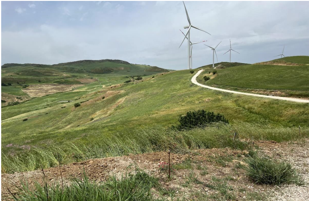
Figure 22- IMG_4922.JPG