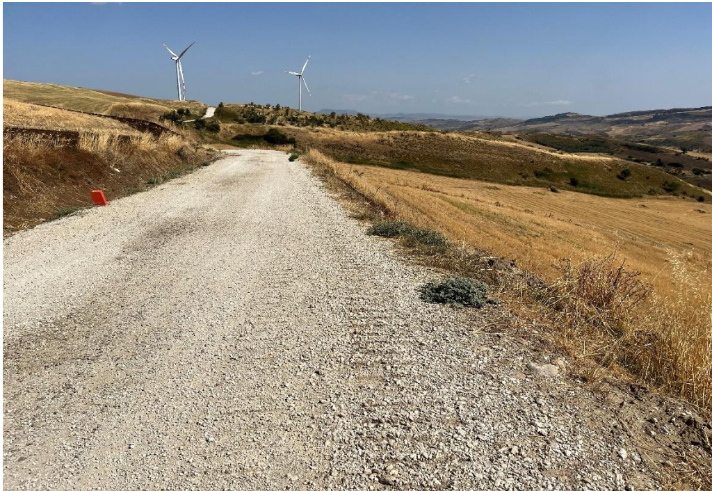
Figure 14- IMG_1496.JPG