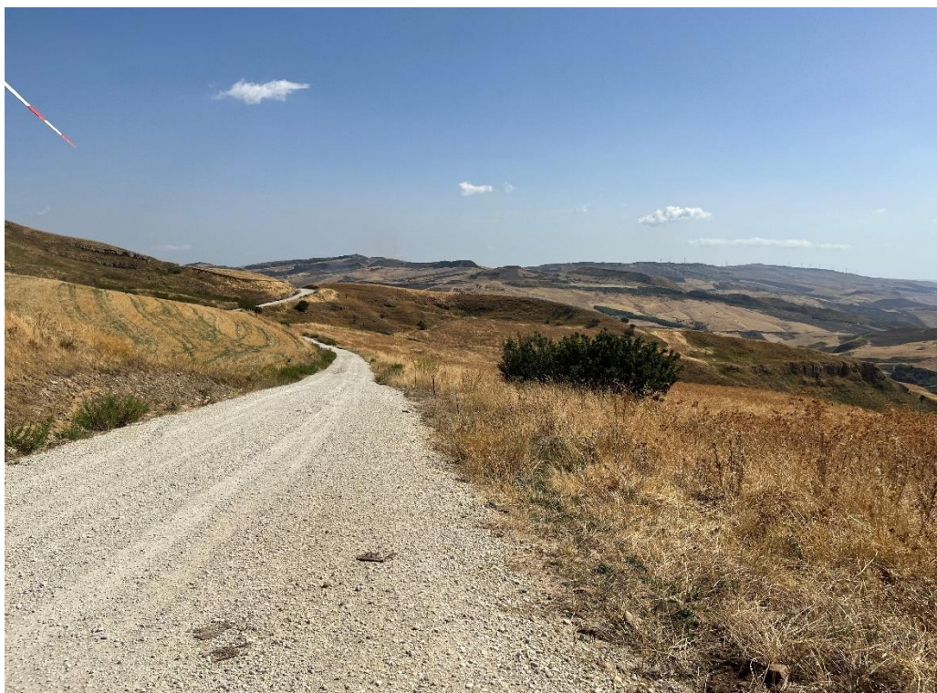
Figure 15- IMG_1506.JPG