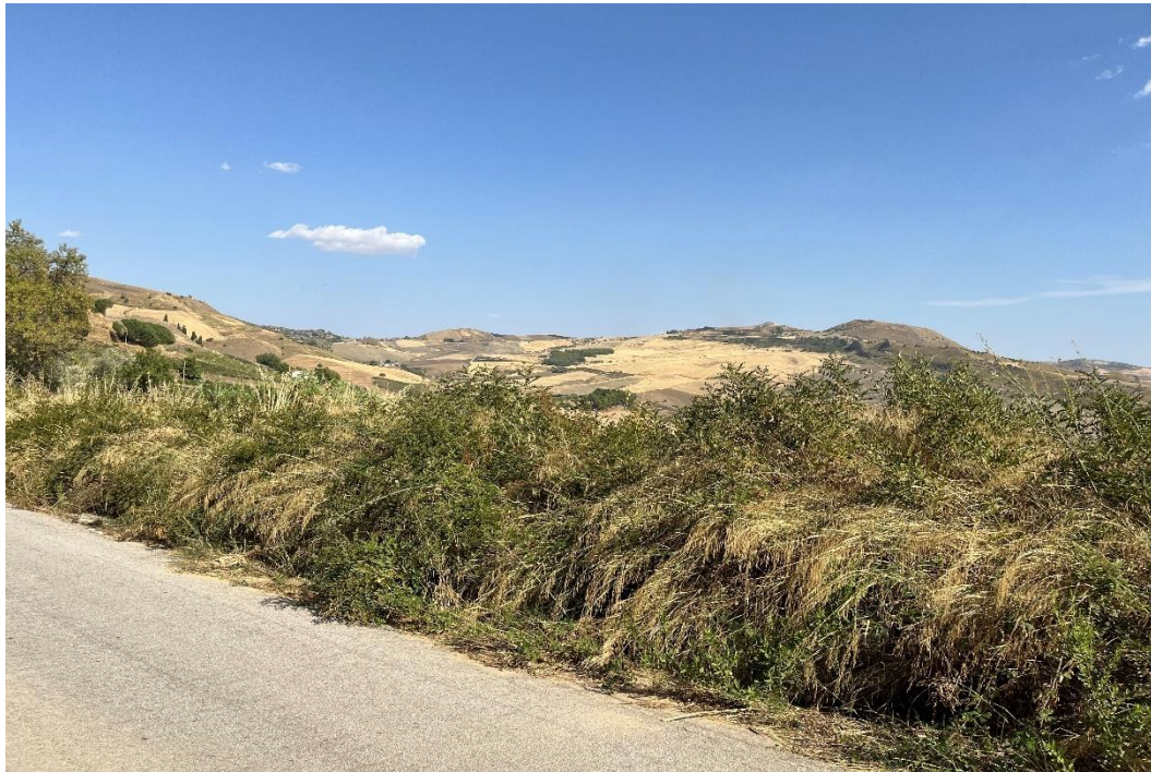
Figure 18- IMG_1538.JPG