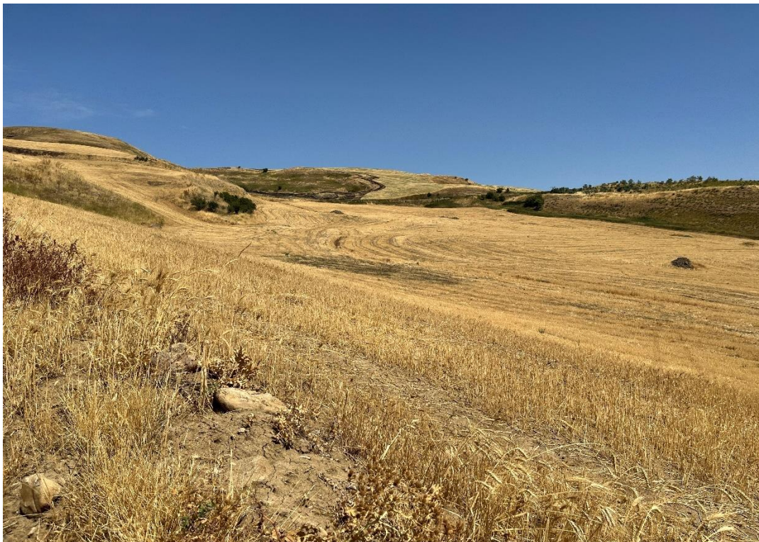
Figure 5- IMG_1423.JPG