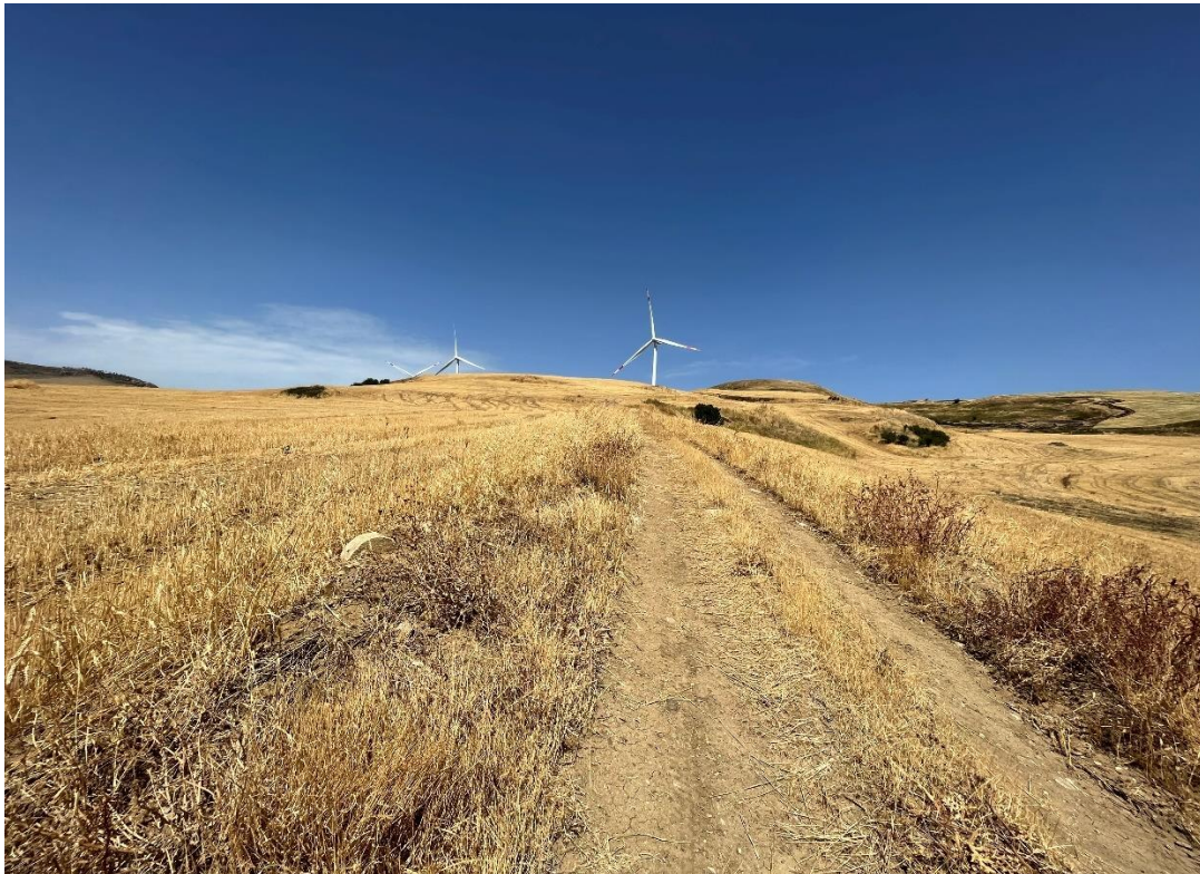
Figure 8- IMG_1445.JPG