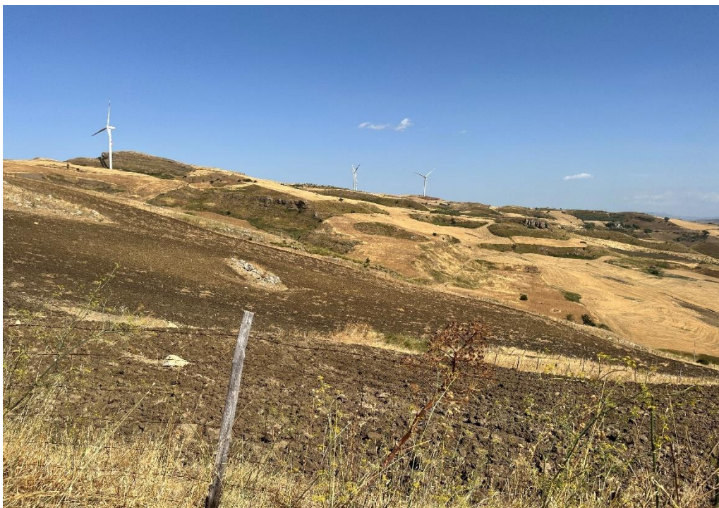
Figure 17- IMG_1521.JPG