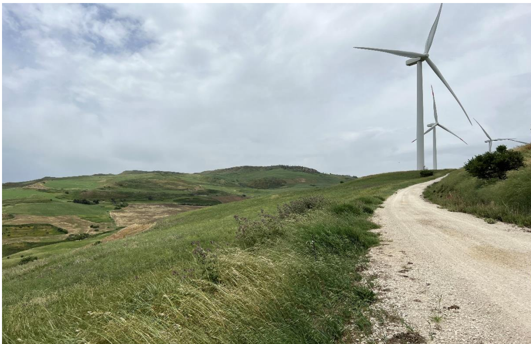
Figure 19- IMG_4917.JPG