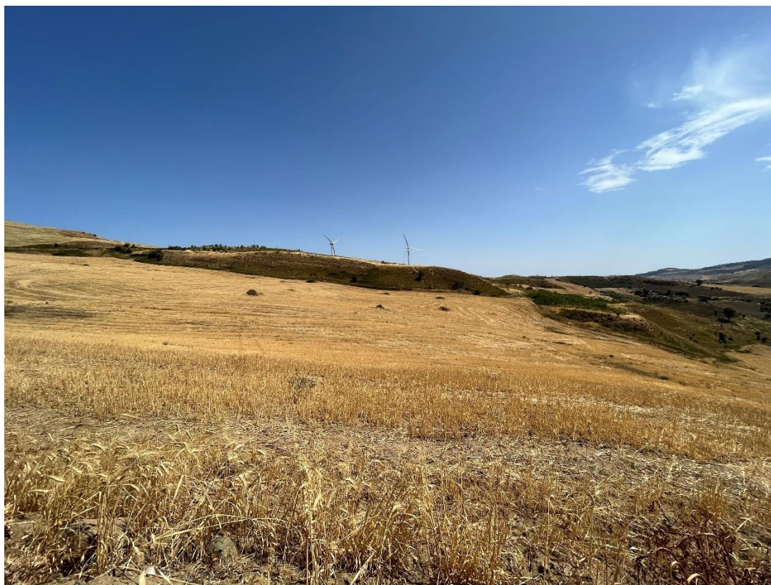
Figure 6- IMG_1429.JPG