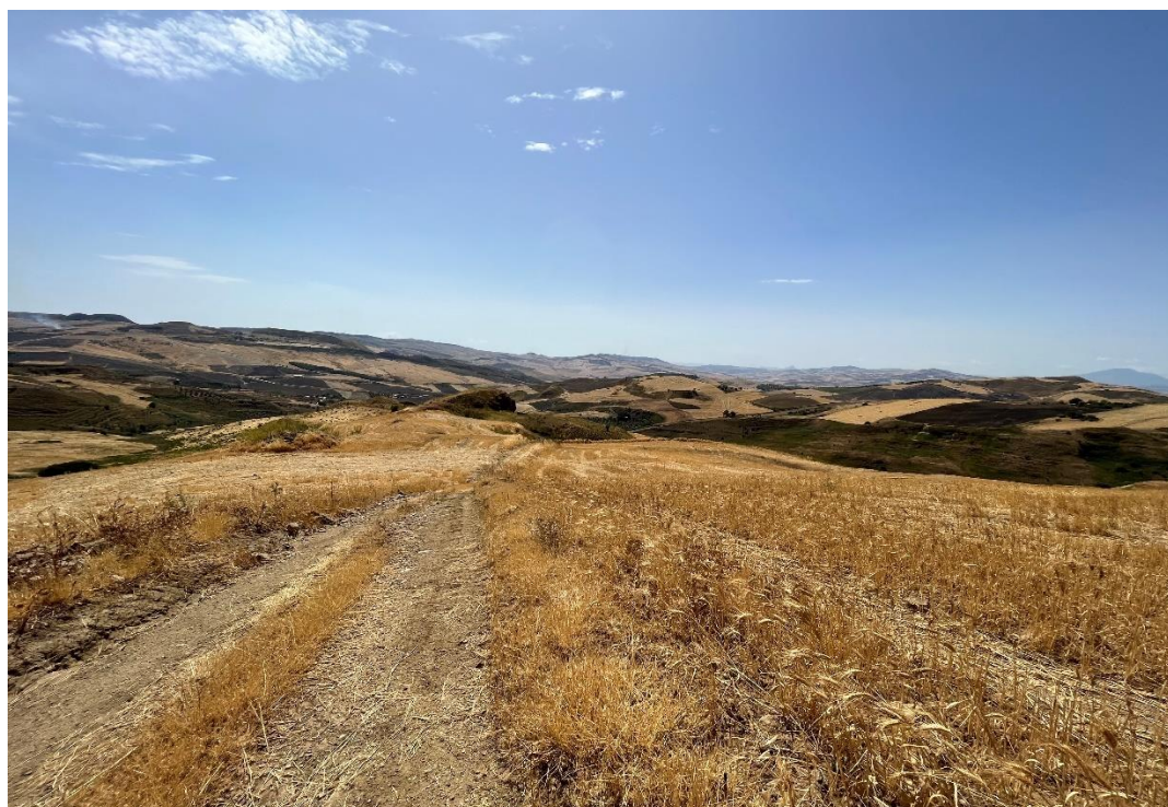
Figure 7- IMG_1434.JPG