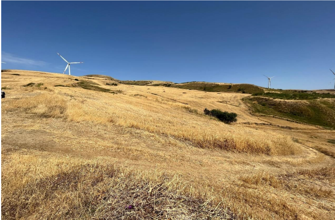
Figure 2- IMG_1408.JPG