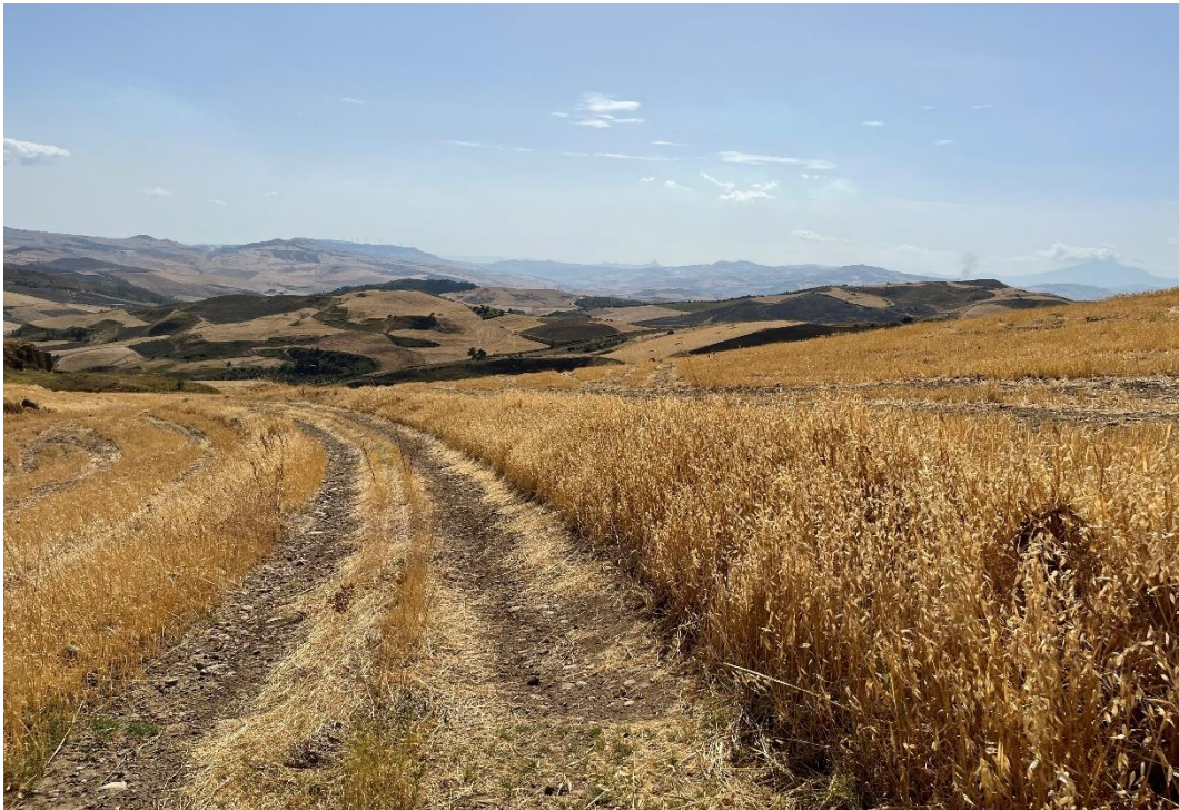
Figure 12- IMG_1484.JPG