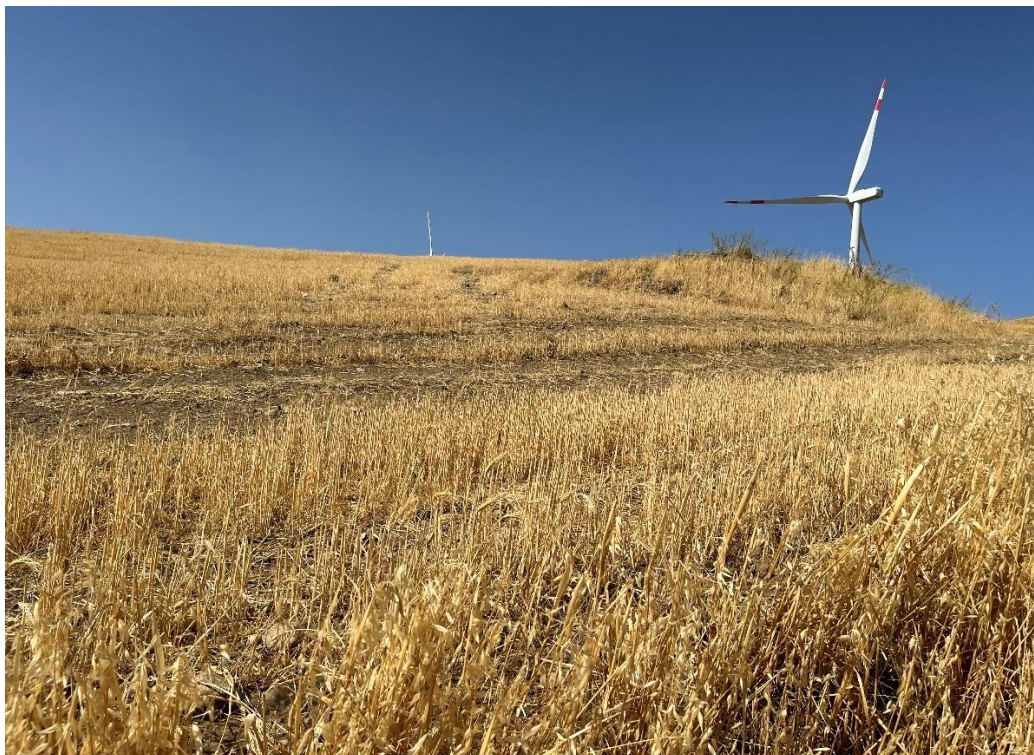
Figure 13- IMG_1495.JPG