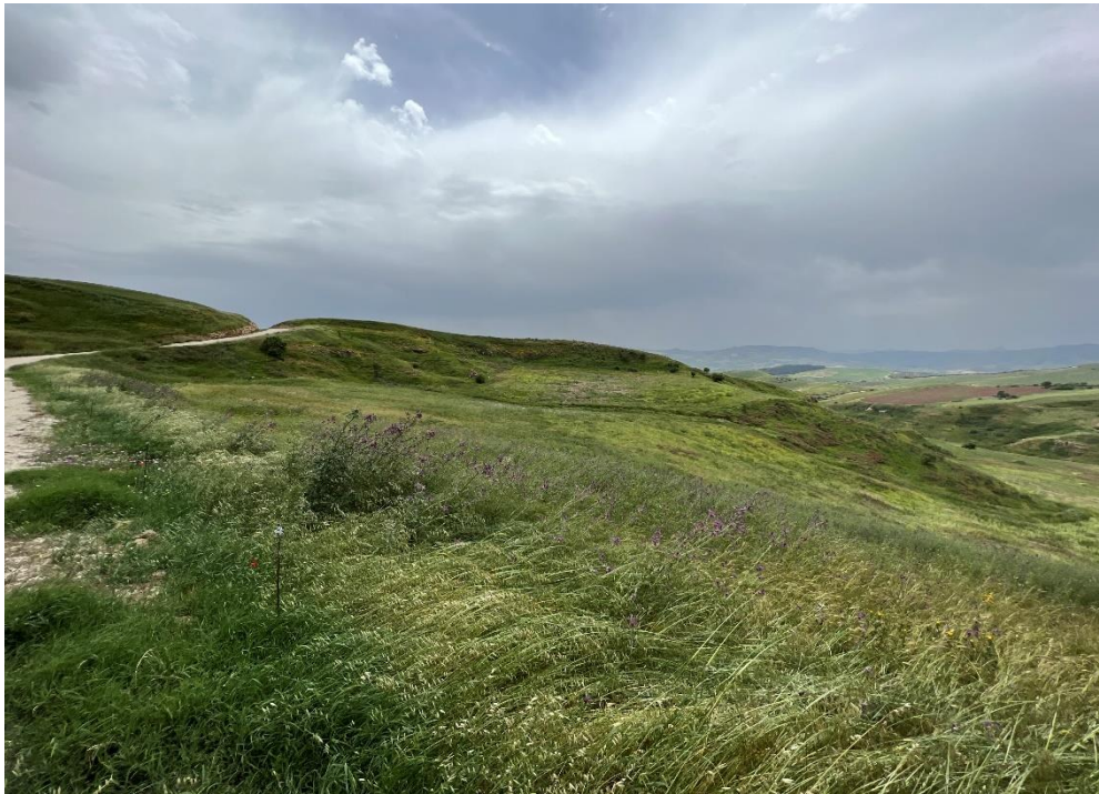
Figure 20- IMG_4919.JPG