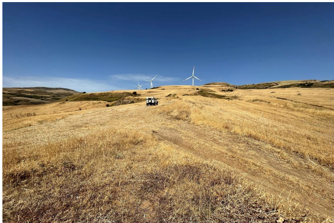
Figure 3- IMG_1413.JPG