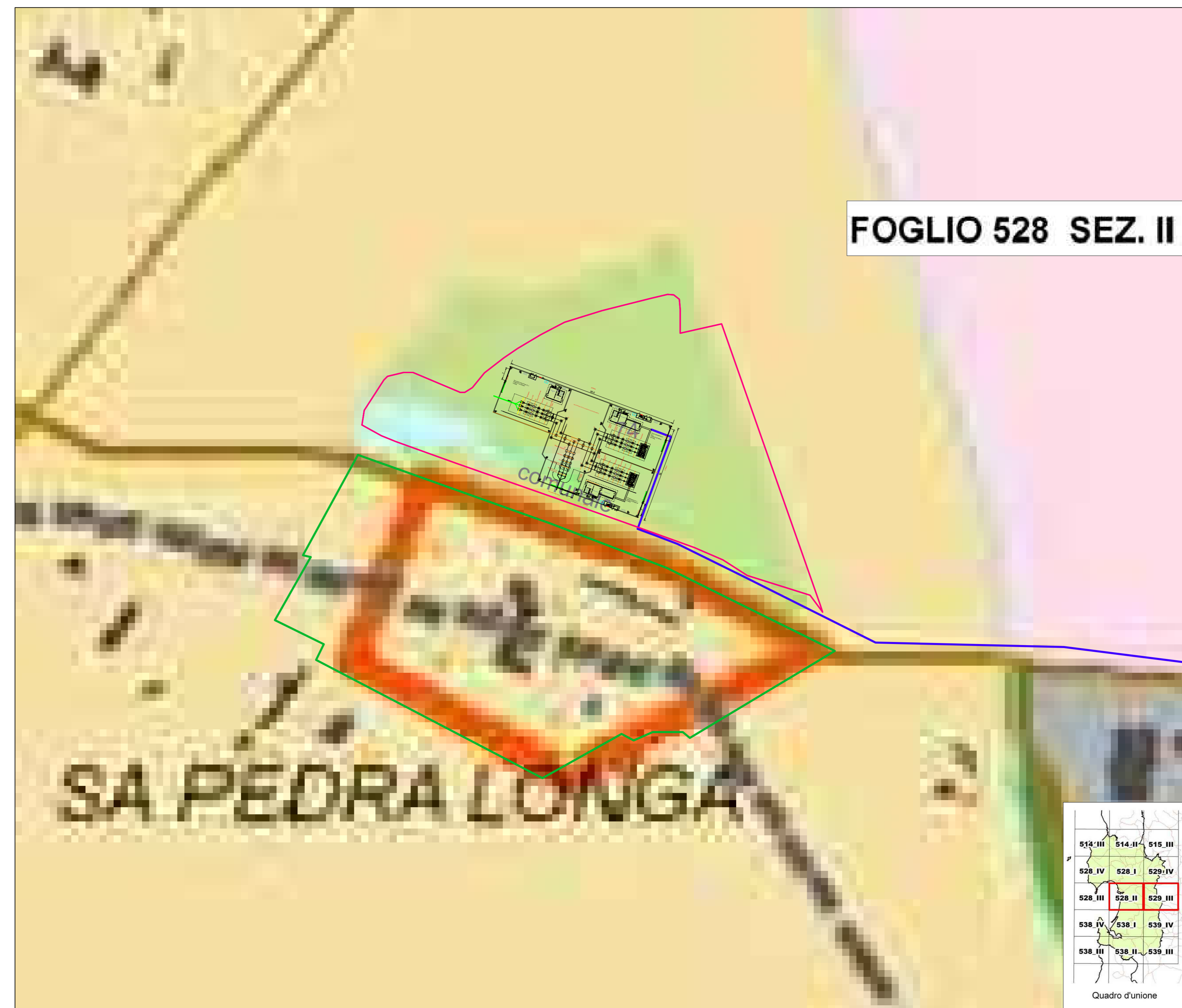
INQUADRAMENTO PPR FOGLIO 528 SEZ.II