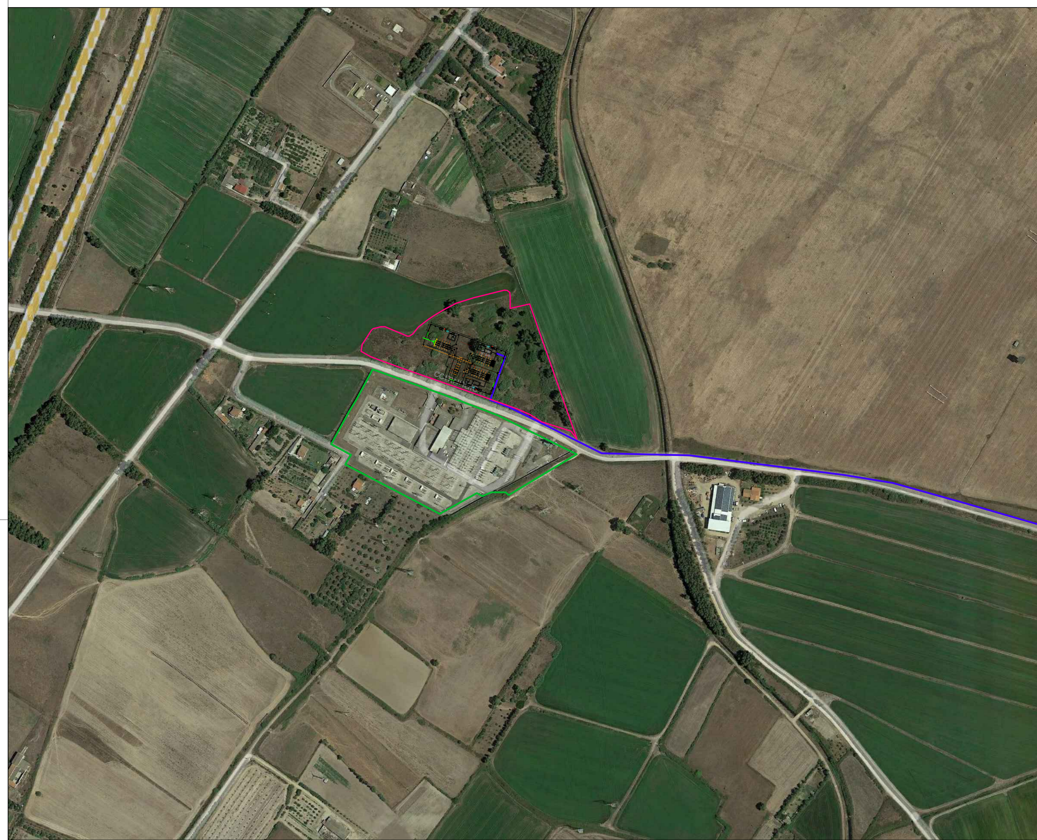
ORTOFOTO CON SOVRAPPOSIZIONE CATASTALE