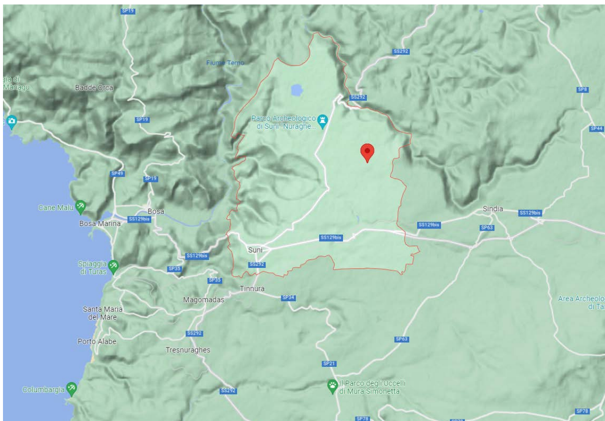
Figura 1 localizzazione dell’area di intervento

La presente documentazione riguarda tutte le opere previste per la produzione energetica tramite pannelli fotovoltaici e le relative opere di connessione alla rete MT necessarie per la realizzazione del progetto.