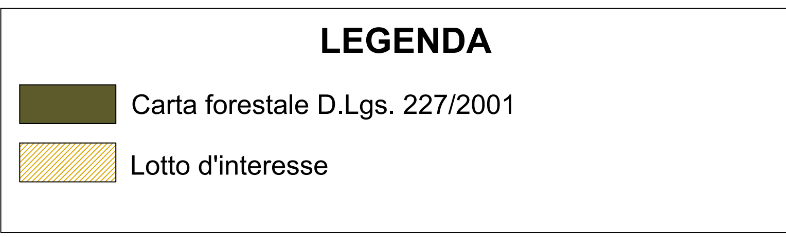
Localizzazione del lotto interessato all'impianto in area vasta