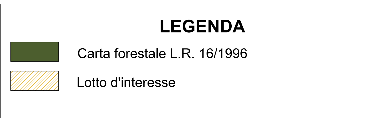
Localizzazione del lotto interessato all'impianto in area vasta