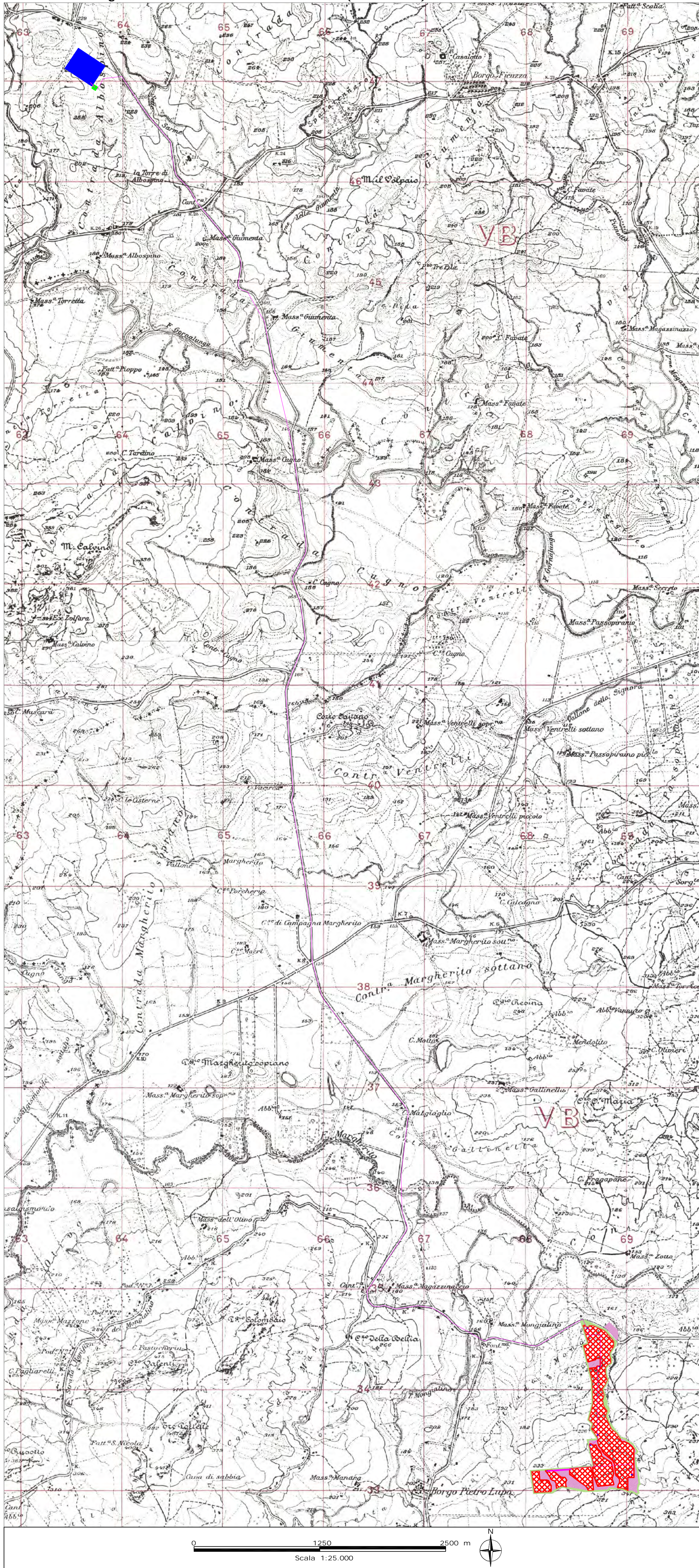
Tav.1: Corografia – Quadro d'unione (1:25000)