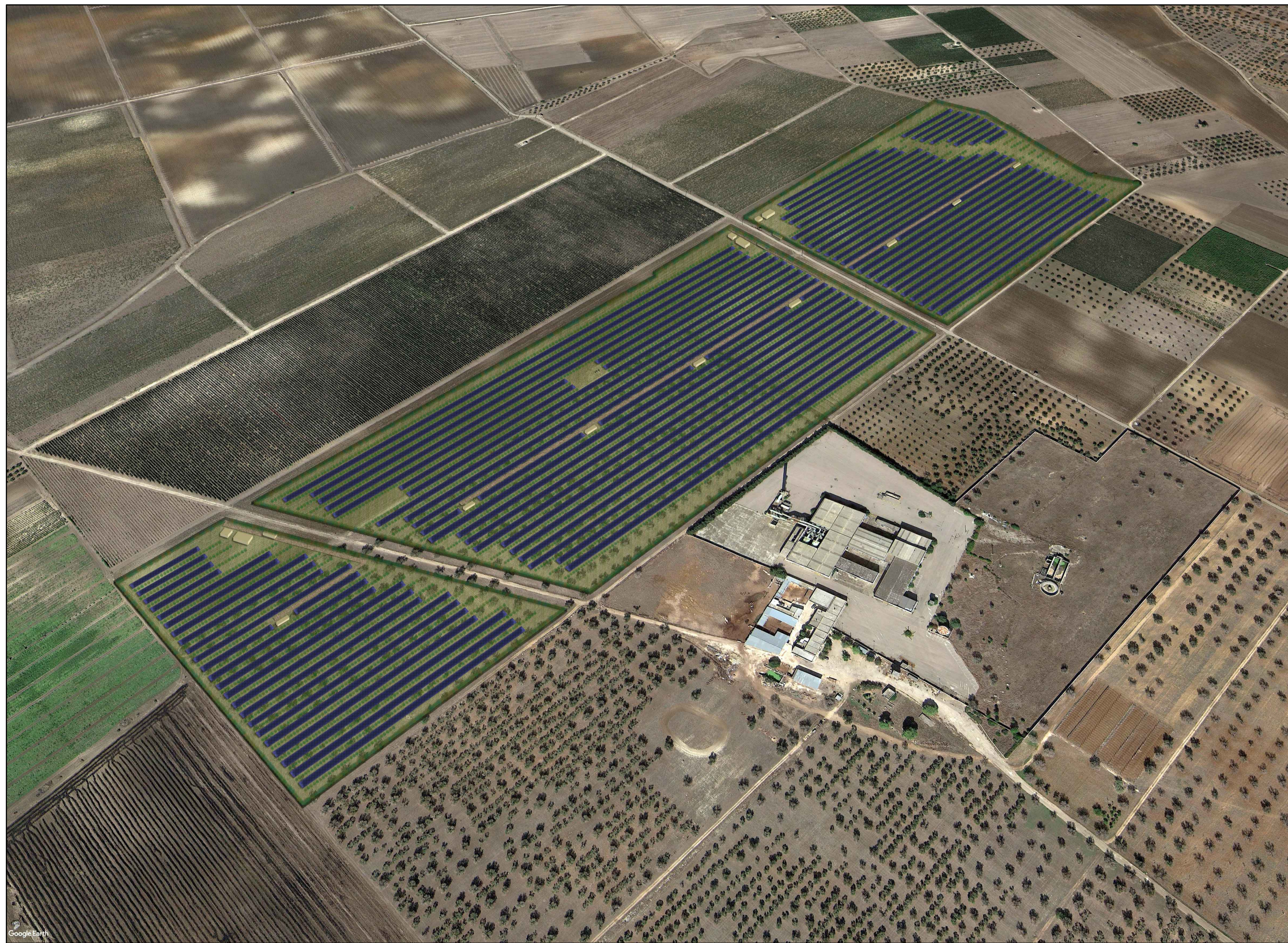
BROUVIEW - STATO DI PROGETTO