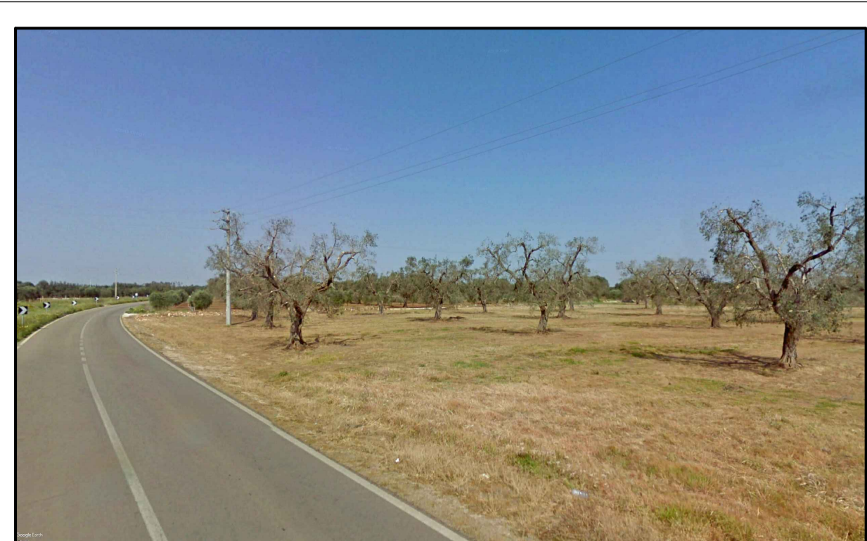
PUNTO DI PRESA FOTOGRAFICA 1