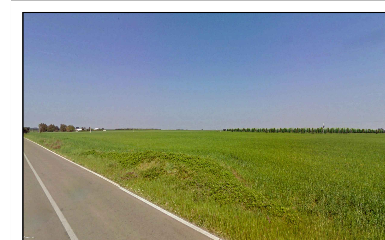
FOTONISERIMENTO 2 - STATO DI PROGETTO