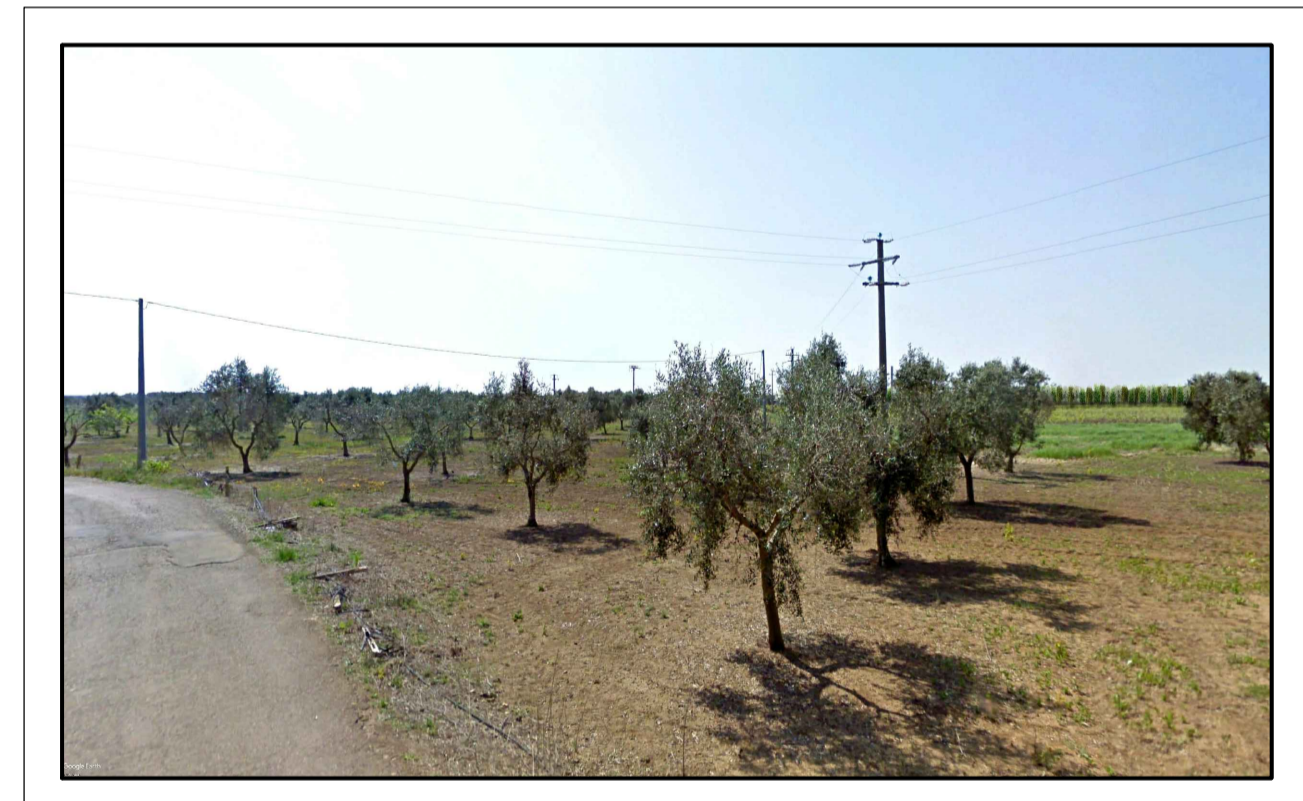
FOTONISERIMENTO 3 - STATO DI PROGETTO