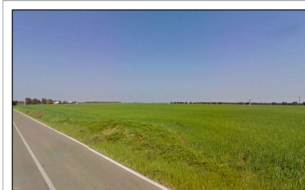
FOTONISERIMENTO 2 - STATO DI FATTO