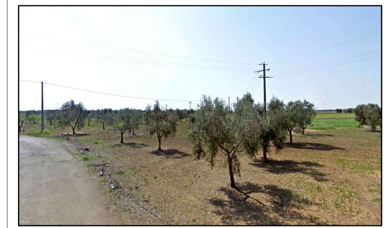
FOTONISERIMENTO 3 - STATO DI FATTO