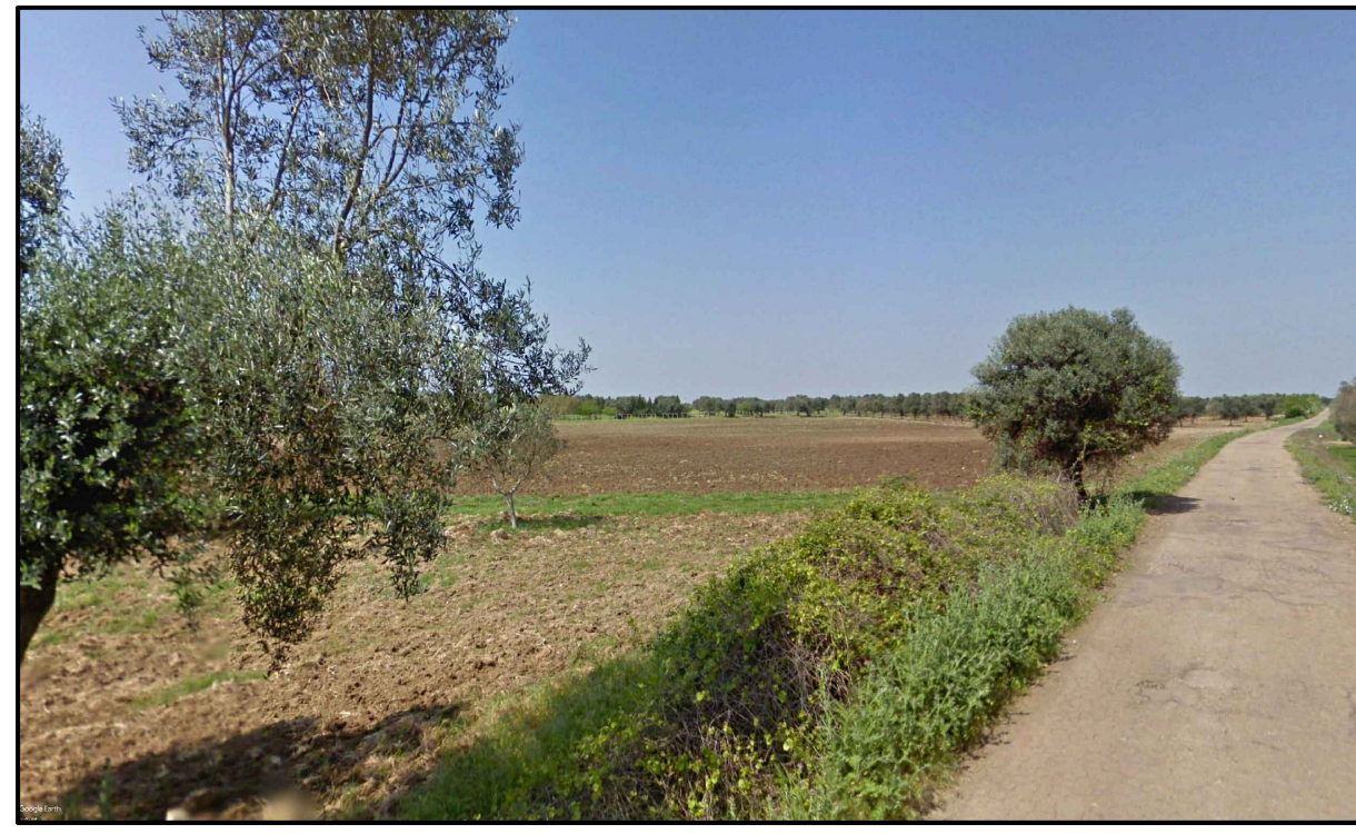
PUNTO DI PRESA FOTOGRAFICA 4