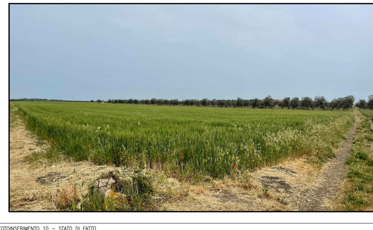
FOTOINSERIMENTO 10 - STATO DI FATTO