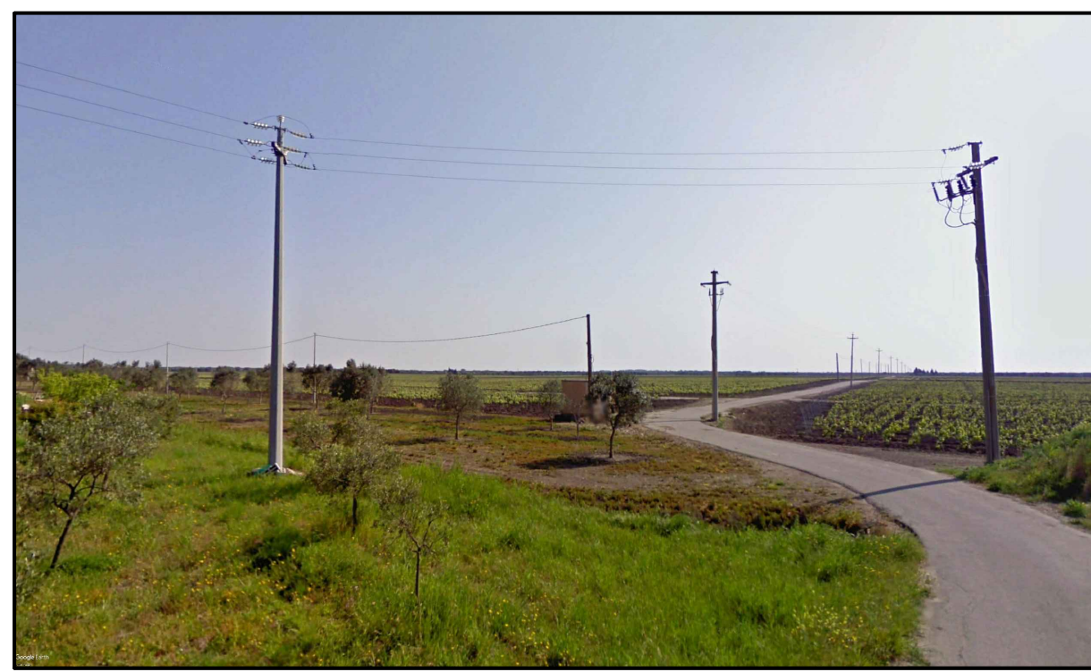
FOTOINSERIMENTO 8 - STATO DI FATTO