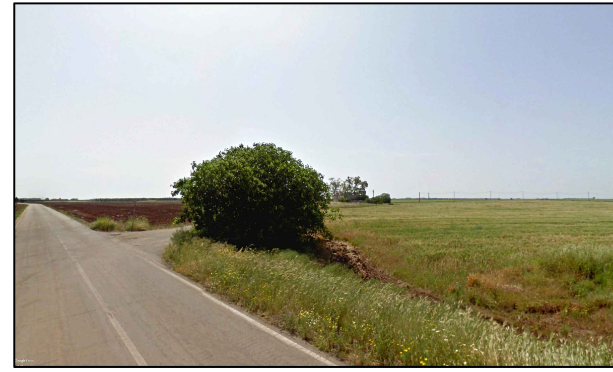
FOTOINSERIMENTO 5 - STATO DI FATTO