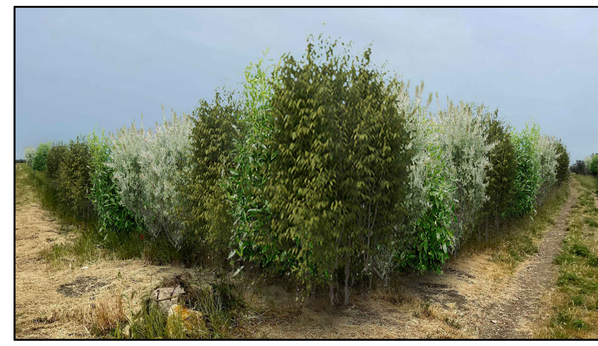
FOTOINSERIMENTO 10 - STATO DI PROGETTO