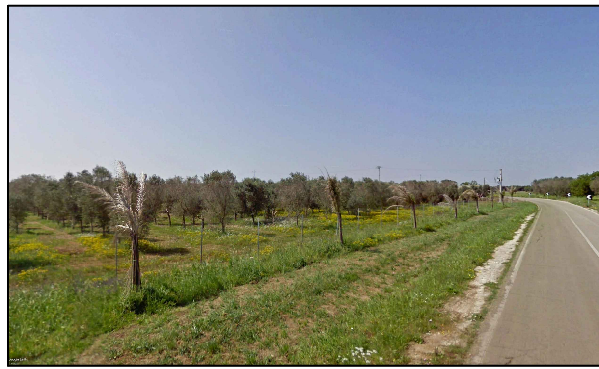
PUNTO DI PRESA FOTOGRAFICA 6