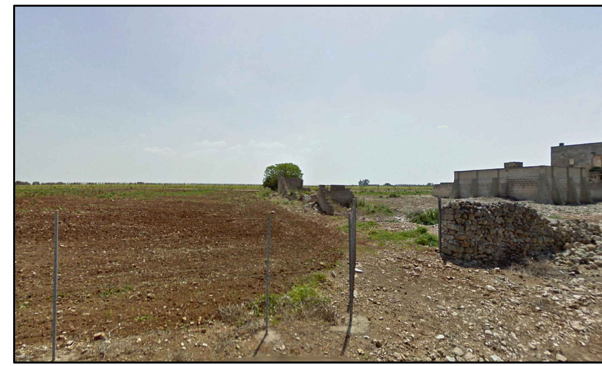
PUNTO DI PRESA FOTOGRAFICA 7