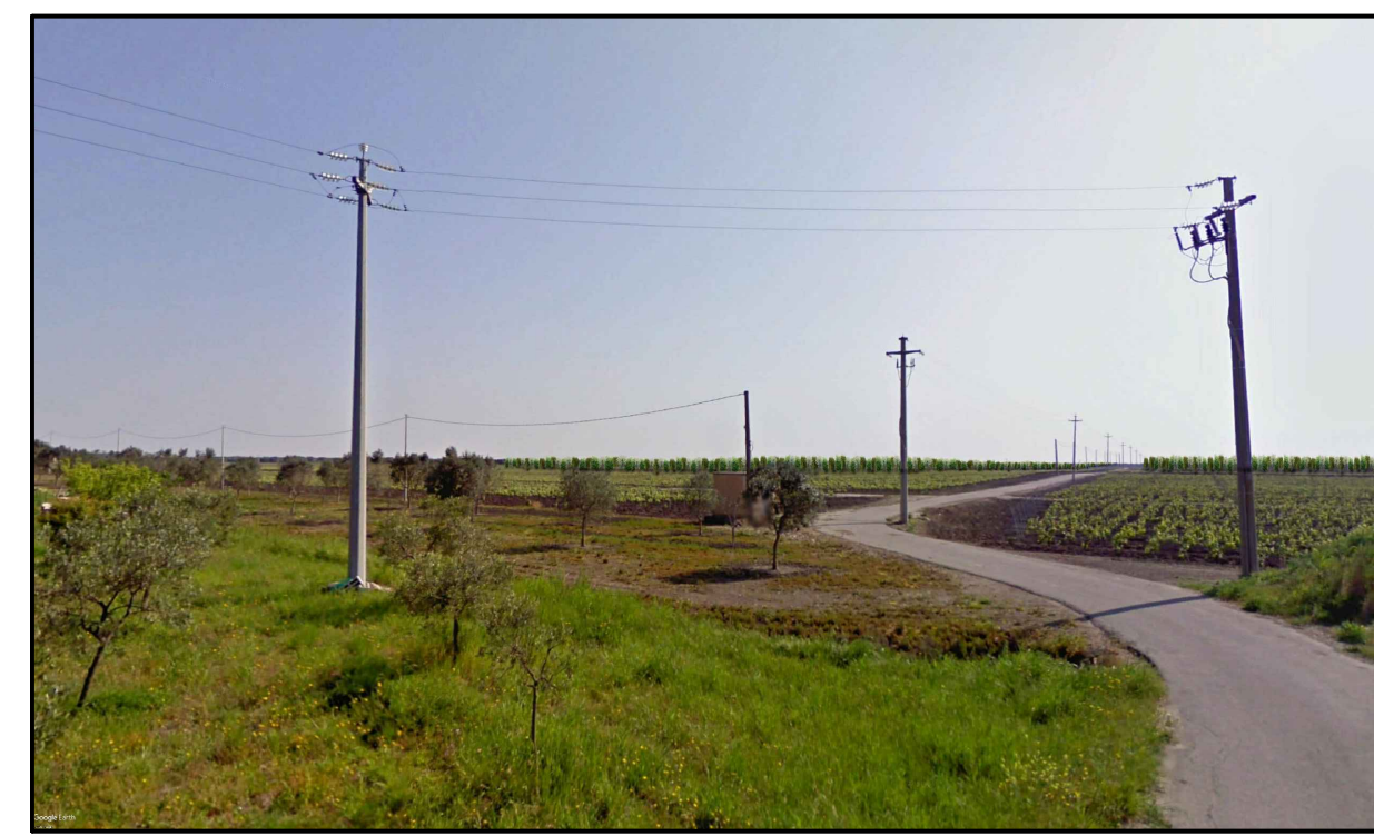
FOTOINSERIMENTO 8 - STATO DI PROGETTO