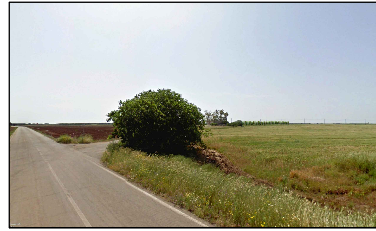
FOTOINSERIMENTO 5 - STATO DI PROGETTO