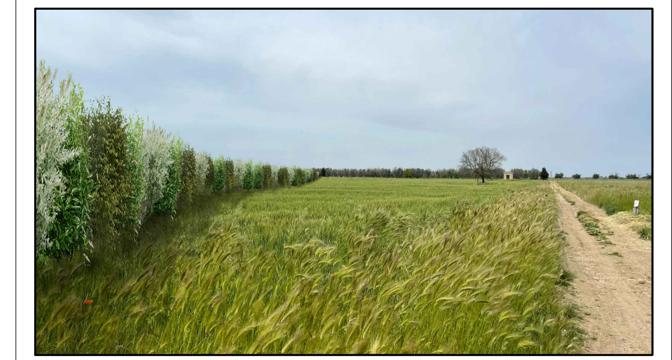
FOTOINSERIMENTO 12 - STATO DI PROGETTO