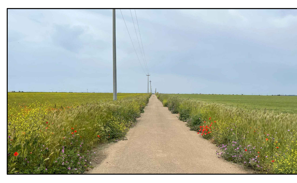
FOTOINSERIMENTO 11 - STATO DI FATTO