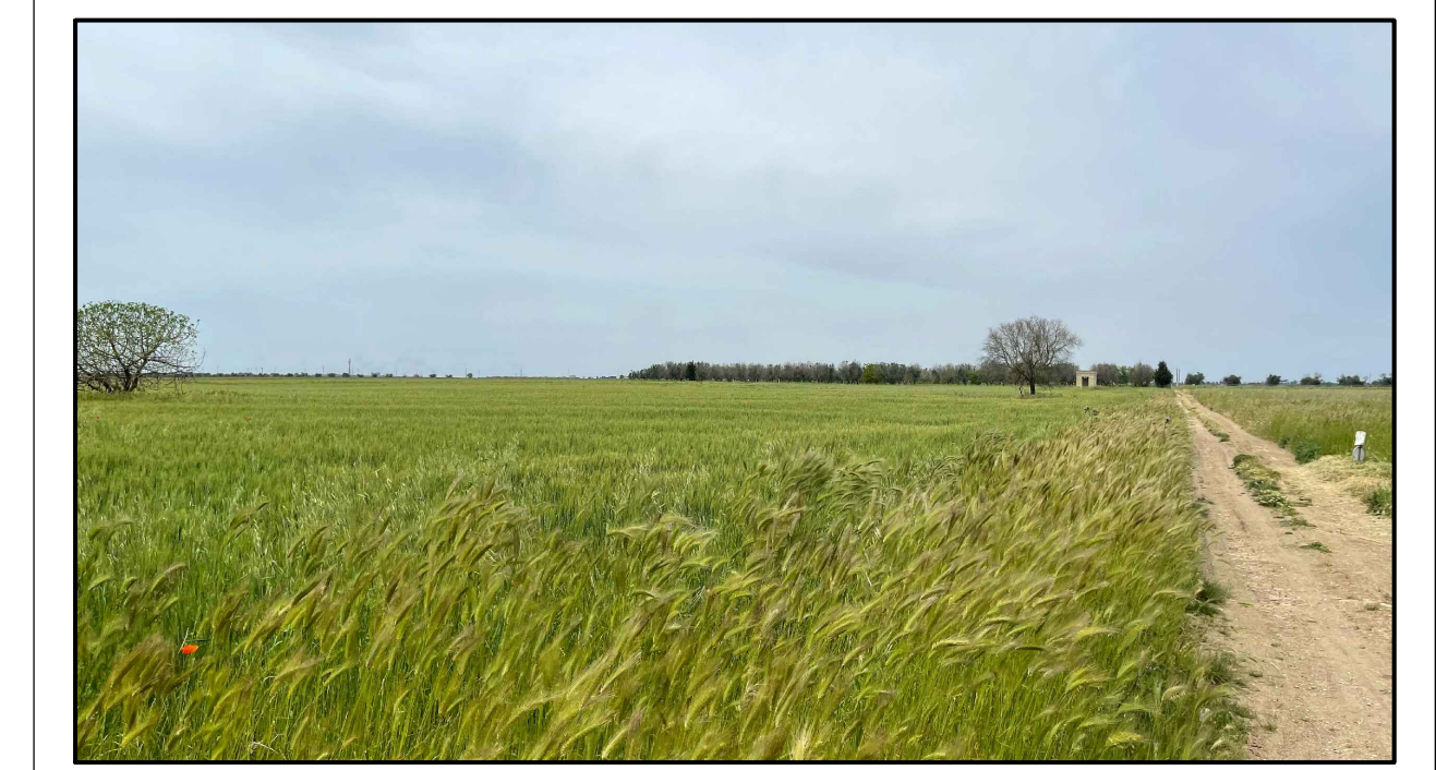
FOTOINSERIMENTO 12 - STATO DI FATTO