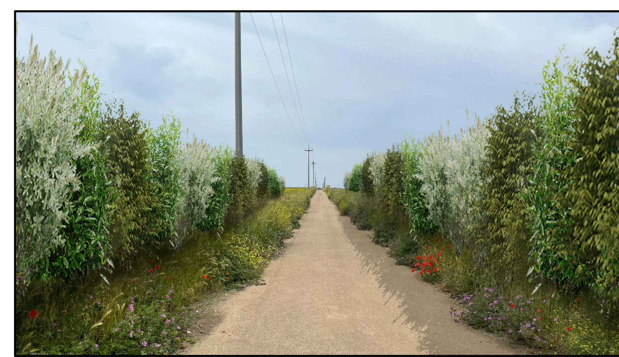
FOTOINSERIMENTO 11 - STATO DI PROGETTO