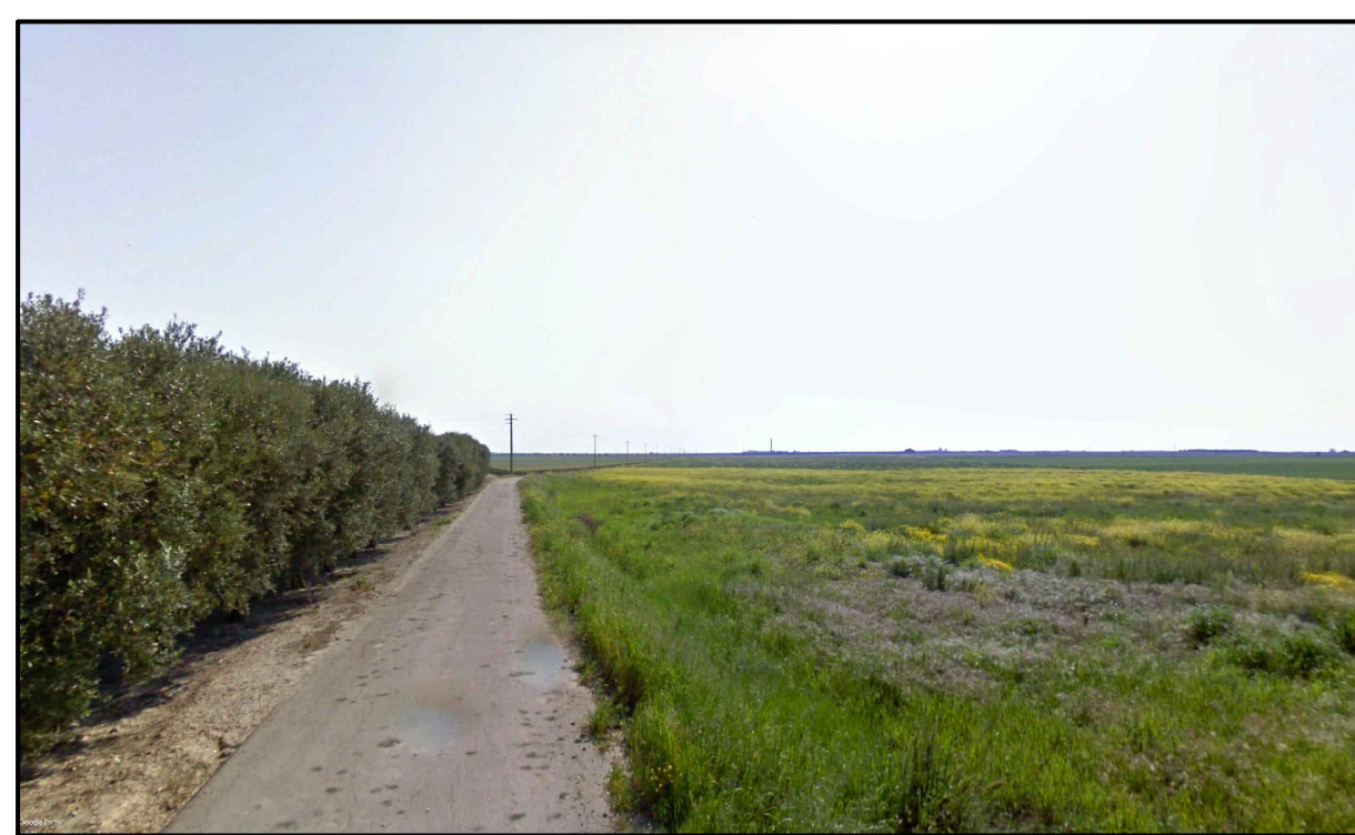
FOTOINSERIMENTO 9 - STATO DI FATTO