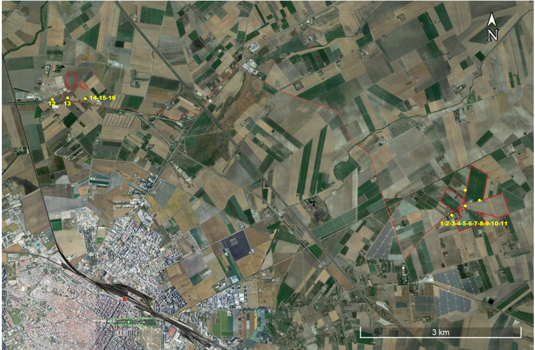
Figura 8. Punti di presa rilievi fotografici su ortofoto – area impianto FV e Sottostazione Elettrica