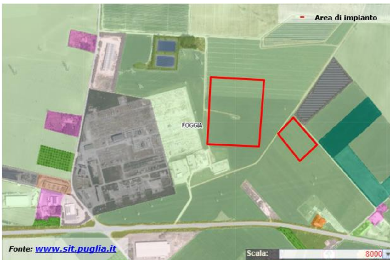
Figura 6. Carta dell'uso del suolo dell'area SET FOGGIA 380/150 kW e del suo immediato intorno

Le aree interessate dall'impianto fotovoltaico e dalle opere connesse appartengono alle classi 2.1.2.1 - Seminativi semplici in aree irrigue, 2.2.1 - Vigneti, 2.2.3 - Oliveti,