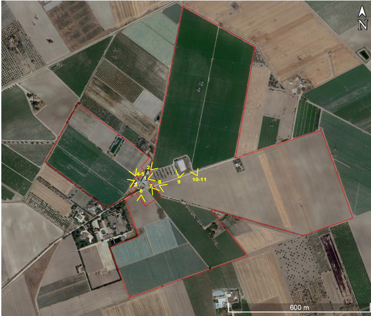
Figura 9. Punti di presa rilievi fotografici su ortofoto – dettaglio area impianto FV