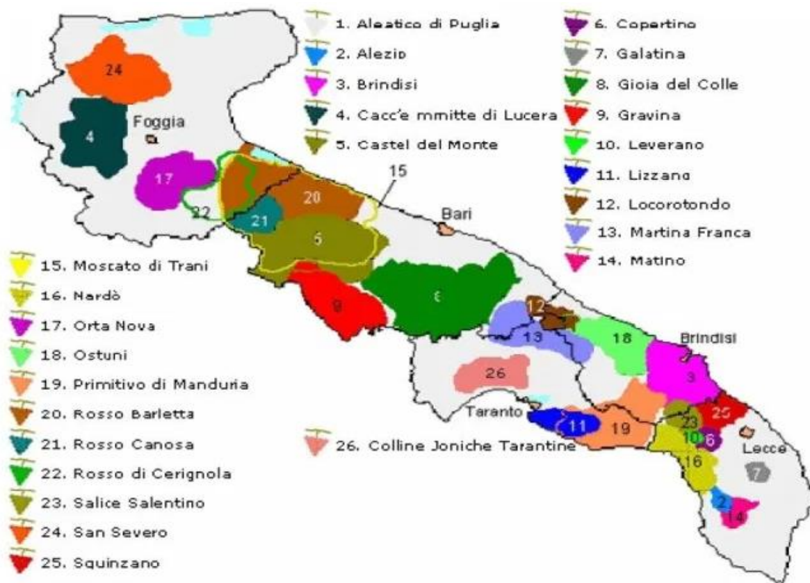
Figura 3. Zone di produzione delle DOC pugliesi