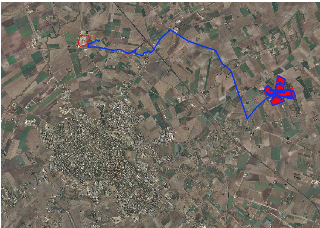
Figura 1. Area oggetto di studio – inquadramento su ortofoto