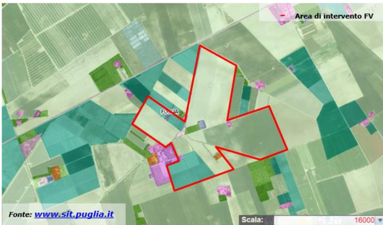
Figura 5. Carta dell'uso del suolo dell'area dell'impianto fotovoltaico e del suo immediato intorno