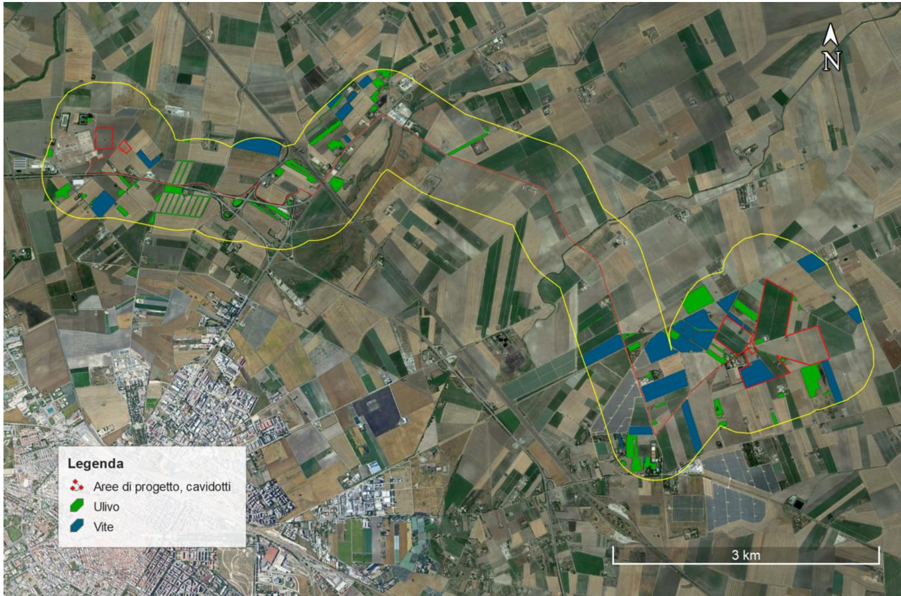
Figura 7. Rilievi area di intervento, area buffer 500 metri