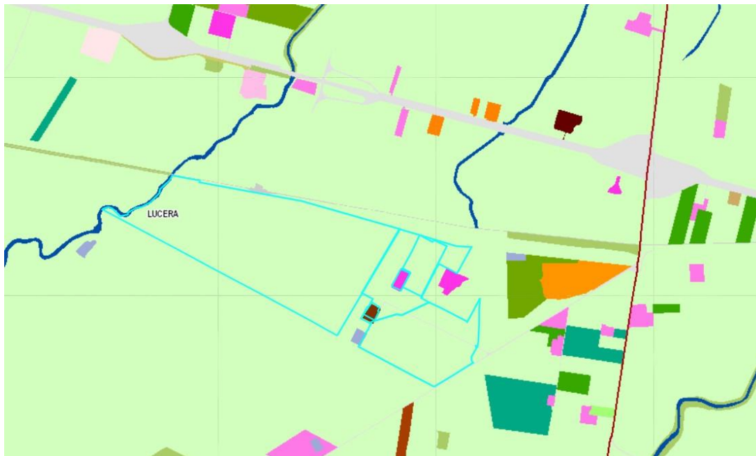
Figura 3.1 Uso del suolo

Le aree in cui ricade l'impianto fotovoltaico sono classificate come "Seminativo semplice in aree irrigue".