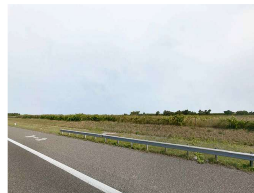
Inquadratura 4: Stato di fatto.