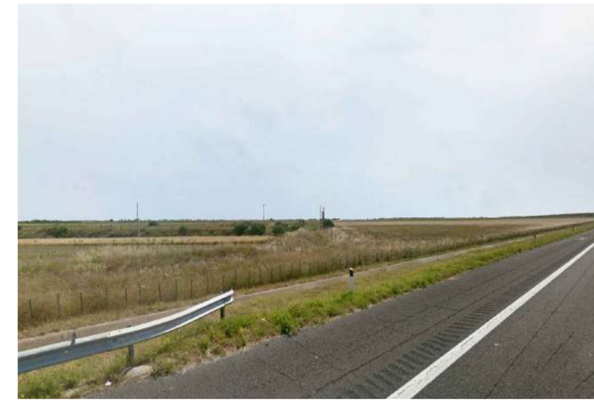
Inquadratura 1: Stato di fatto.