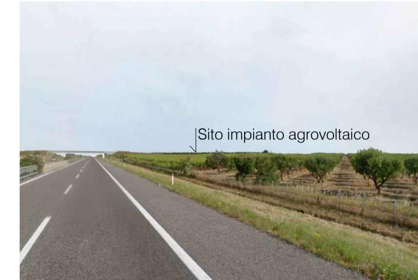
Inquadratura 2: Stato di progetto.