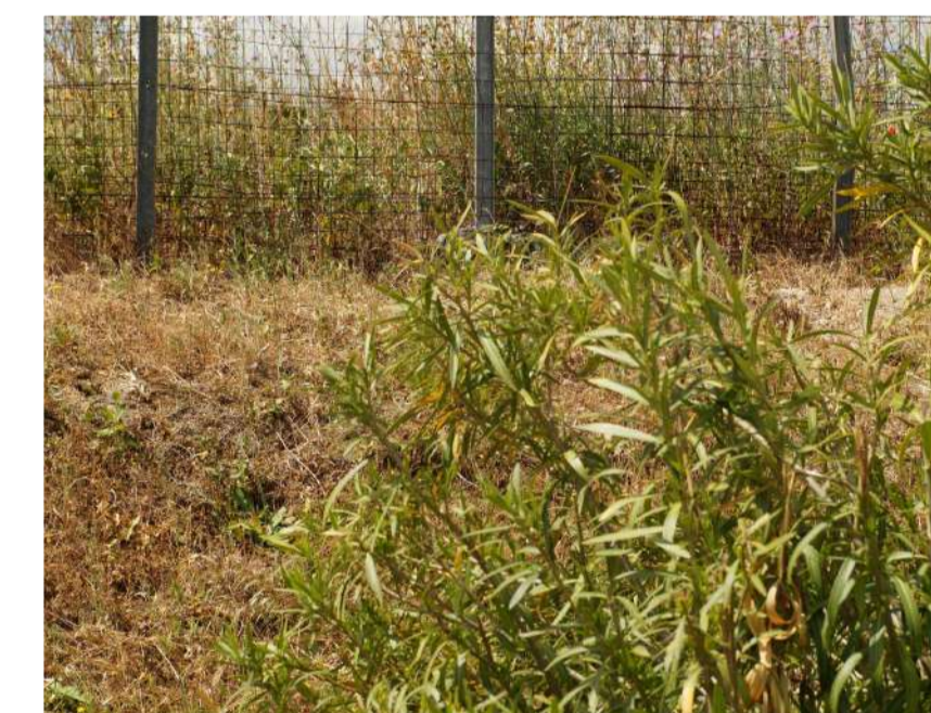
Inquadratura 5: Stato di progetto.