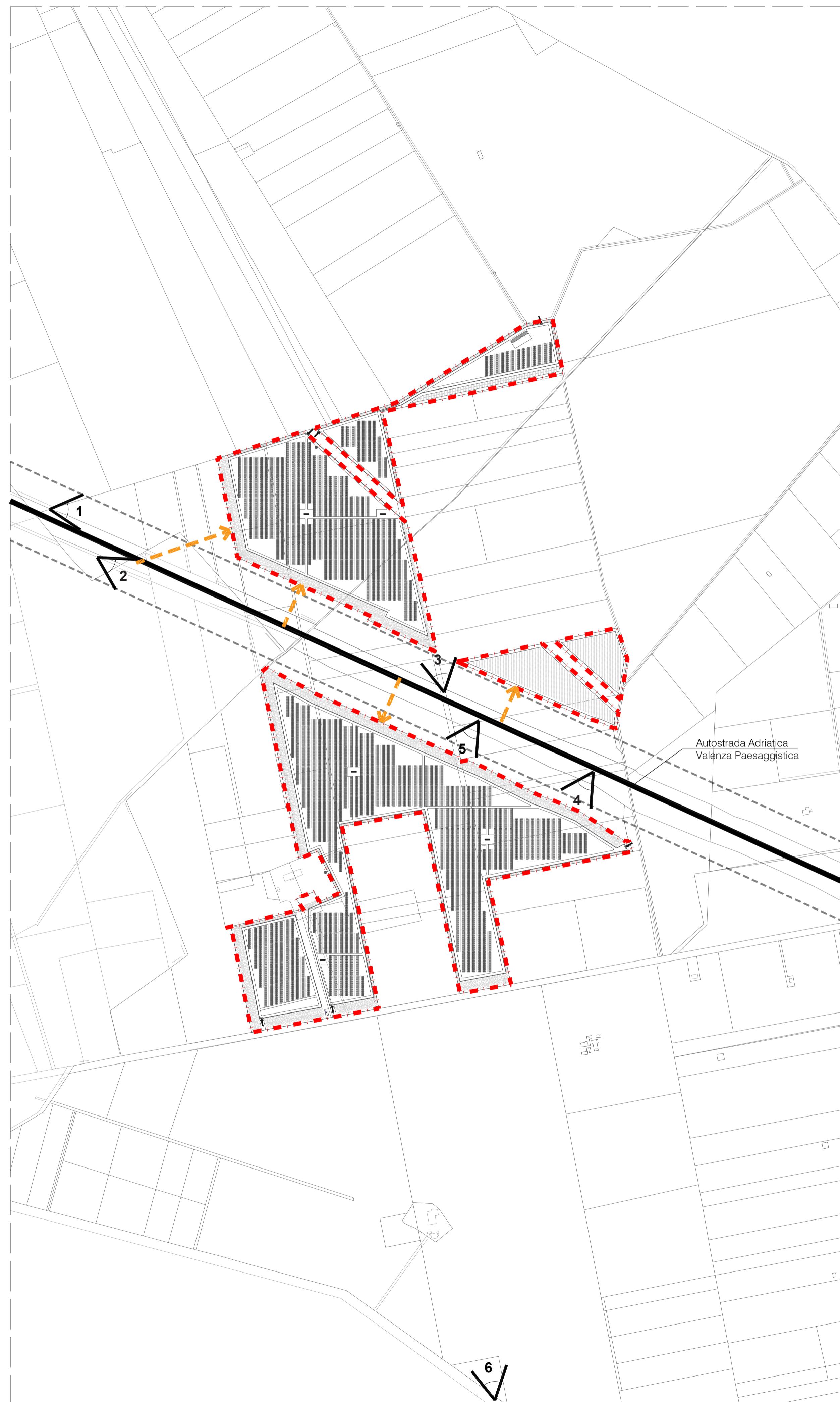
Rilievo fotografico: Stato di fatto.