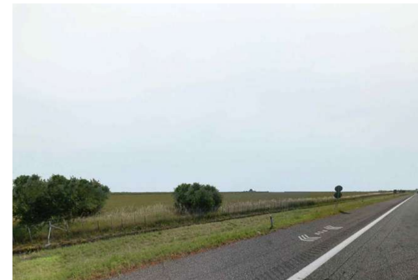
Inquadratura 3: Stato di fatto.