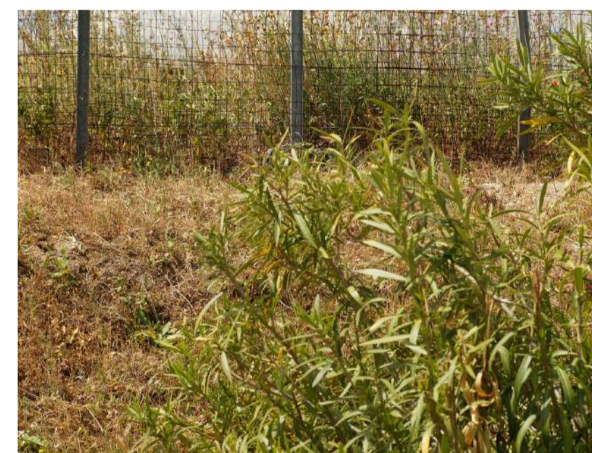
Inquadratura 5: Stato di fatto.