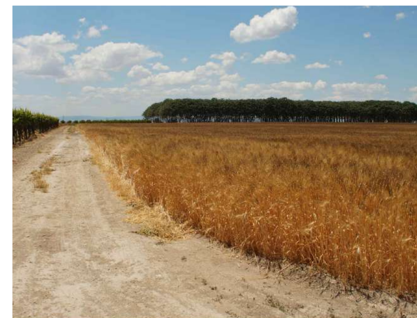
Inquadratura 6: Stato di fatto.