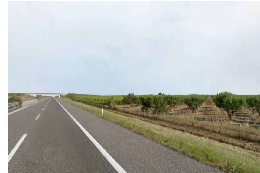
Inquadratura 2: Stato di fatto.