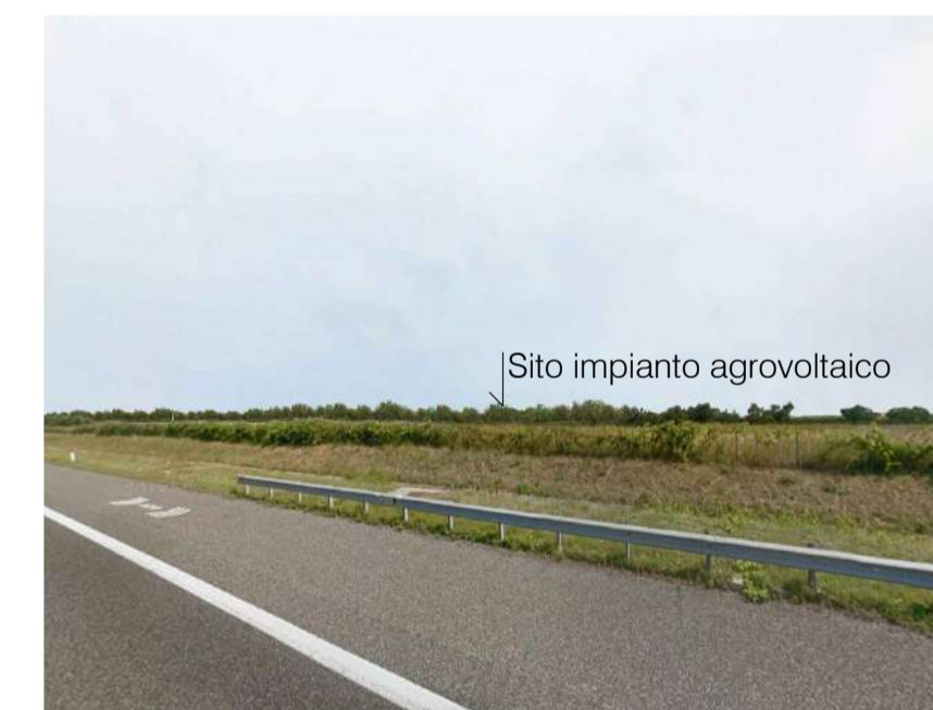
Inquadratura 4: Stato di progetto.