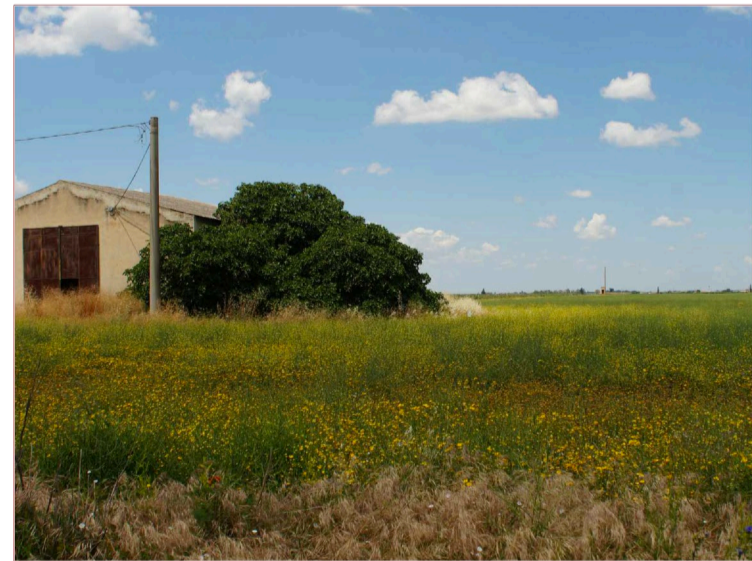
Sito: Tratturo Vista 2