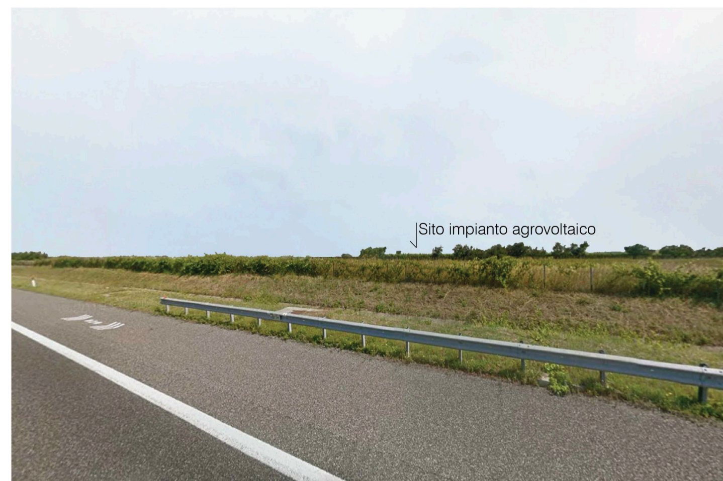
Orta Nova 1. Inquadatura 5 - Stato di progetto. Vista impianto senza fascia di mitigazione.