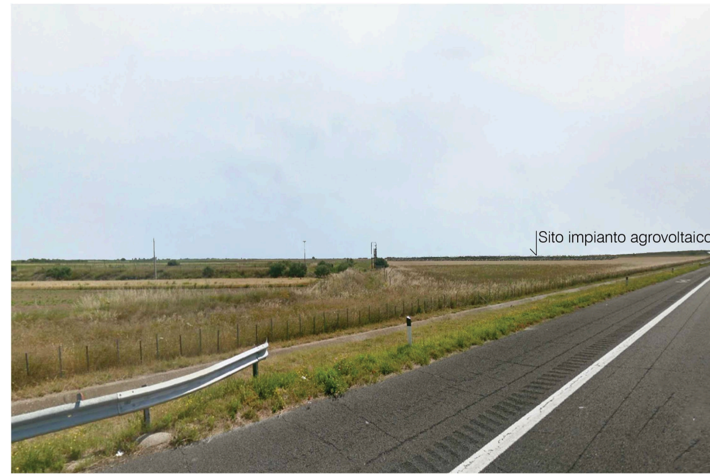
Orta Nova 1. Inquadatura 2 - Stato di progetto. Vista impianto senza fascia di mitigazione.