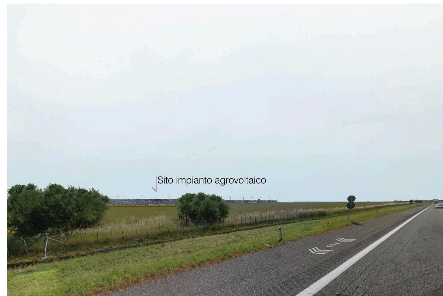
Orta Nova 1. Inquadatura 4 - Stato di progetto. Vista impianto senza fascia di mitigazione.