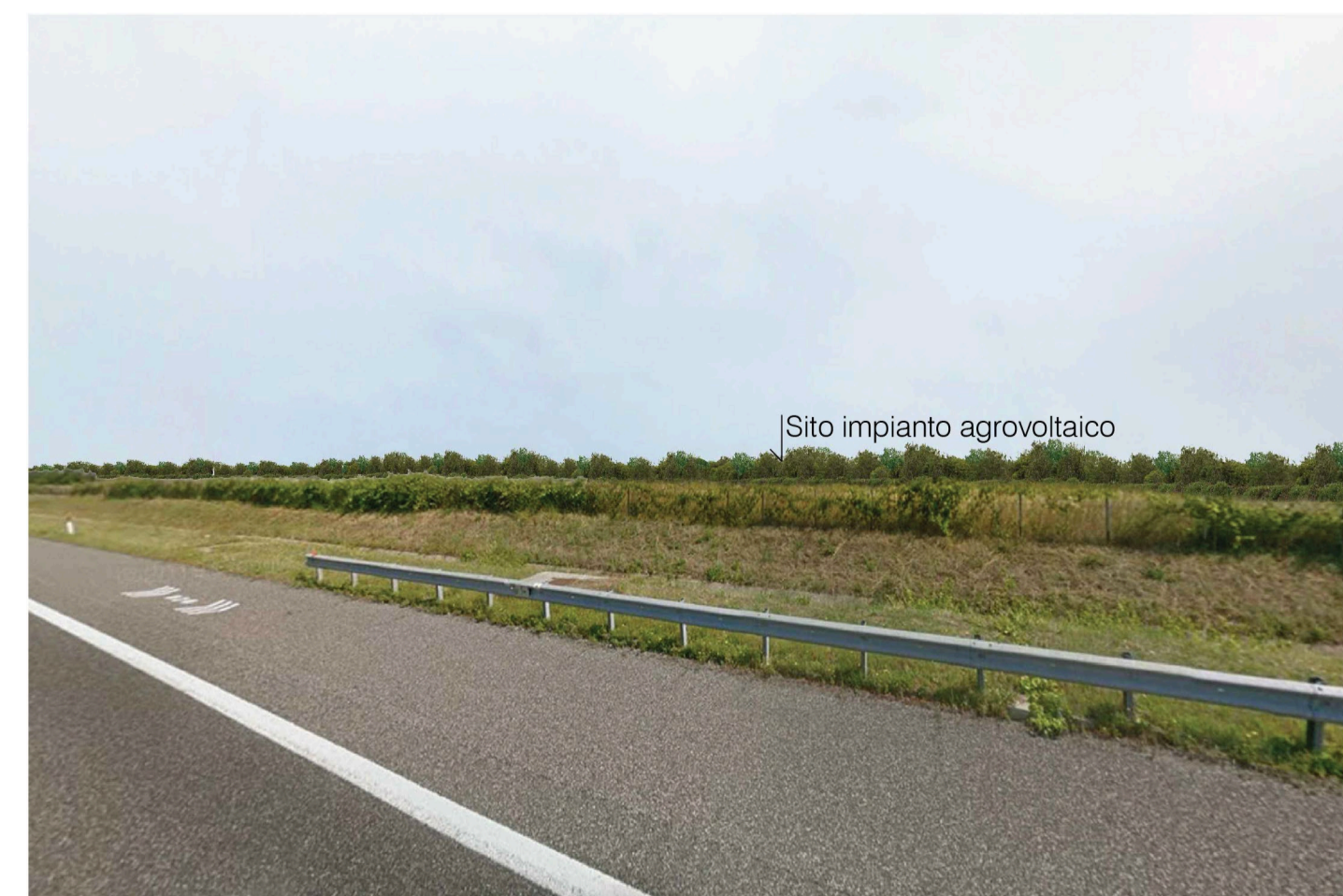
Orta Nova 1. Inquadatura 5 - Stato di progetto. Vista impianto con fascia di mitigazione.