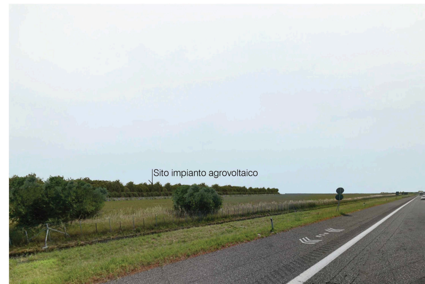
Orta Nova 1. Inquadatura 4 - Stato di progetto. Vista impianto con fascia di mitigazione.