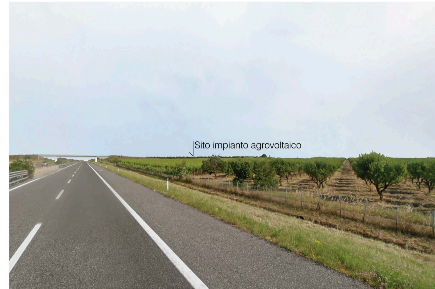
Orta Nova 1. Inquadatura 3 - Stato di progetto. Vista impianto con fascia di mitigazione.