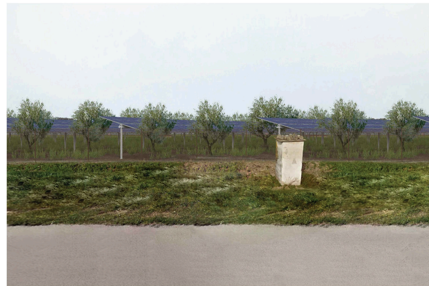
Orta Nova 1. Inquadratura 4 - Stato di progetto. Vista impianto senza fascia di mitigazione.