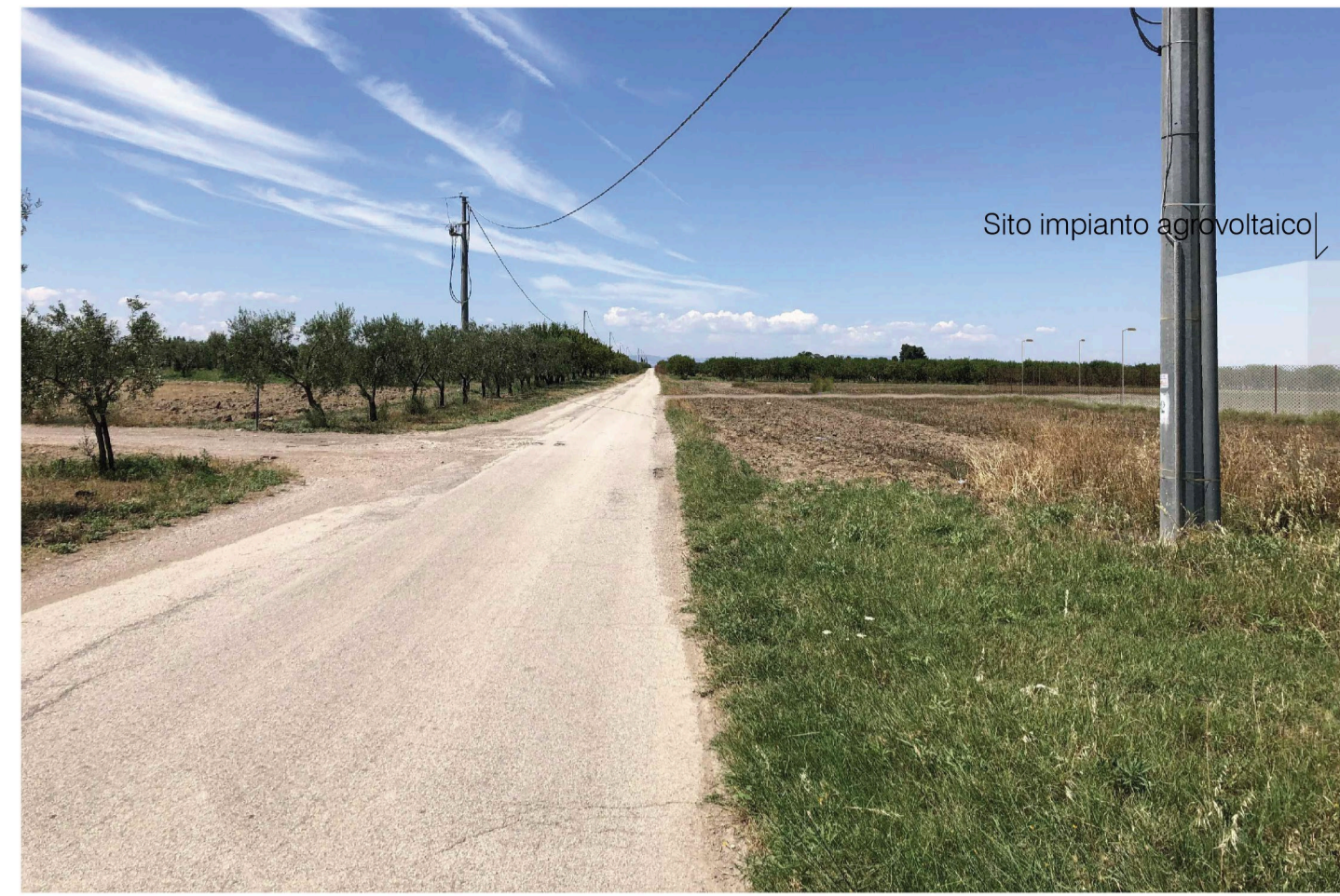
Orta Nova 1. Inquadratura 2 - Stato di progetto. Vista impianto senza fascia di mitigazione.