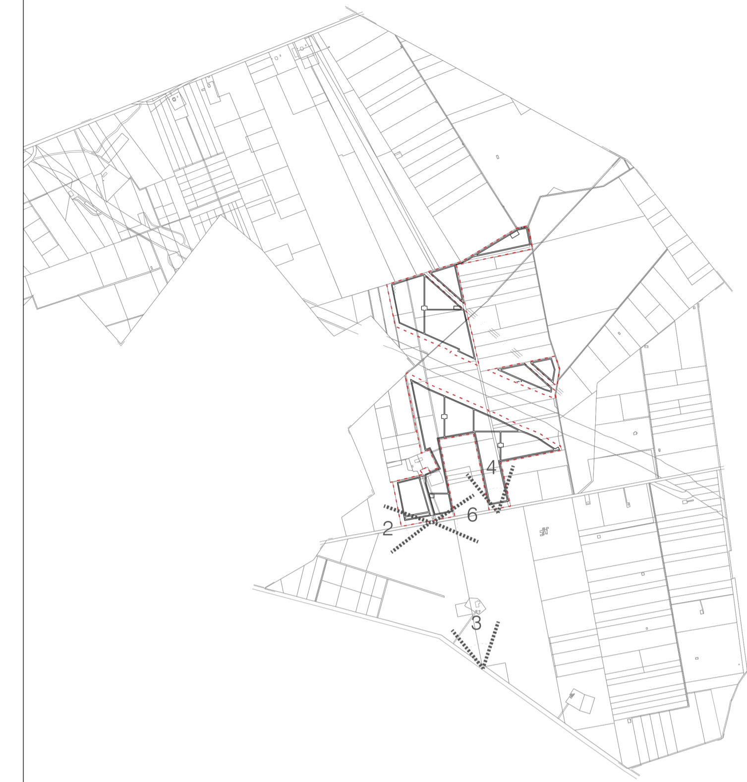
K-PLAN AREA DI INTERVENTO