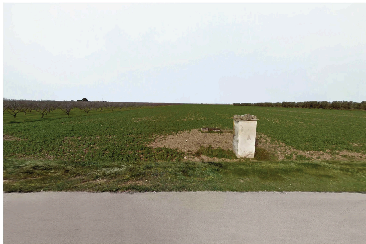
Orta Nova 1. Inquadratura 4 - Stato di fatto