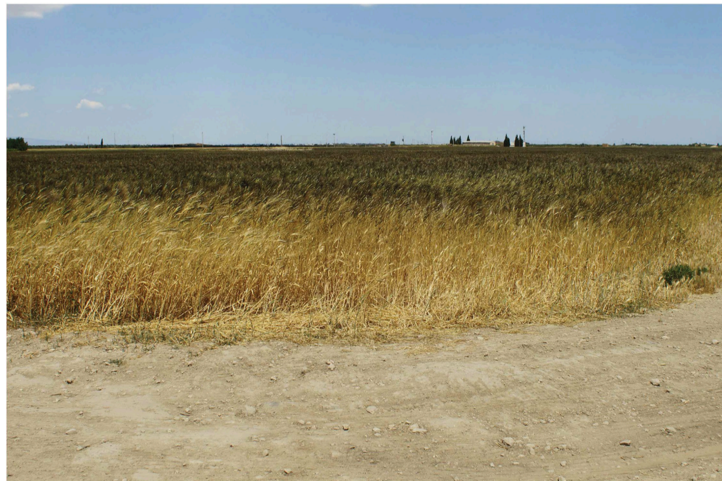
Orta Nova 1. Inquadratura 3 - Stato di fatto