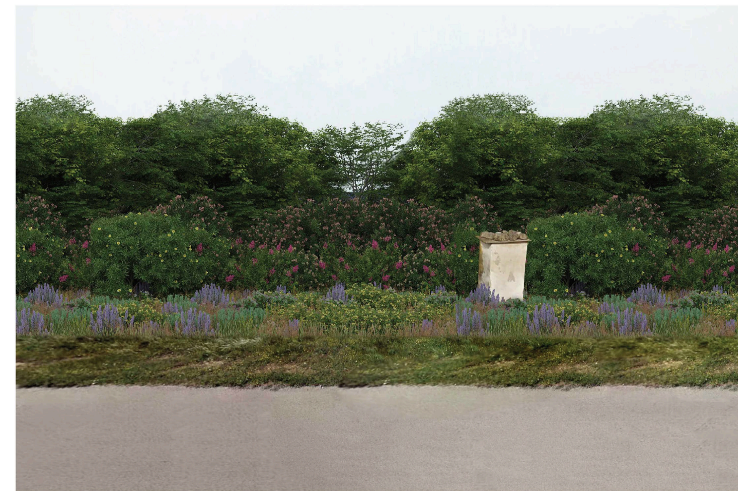
Orta Nova 1. Inquadratura 4 - Stato di progetto. Vista impianto con fascia di mitigazione.