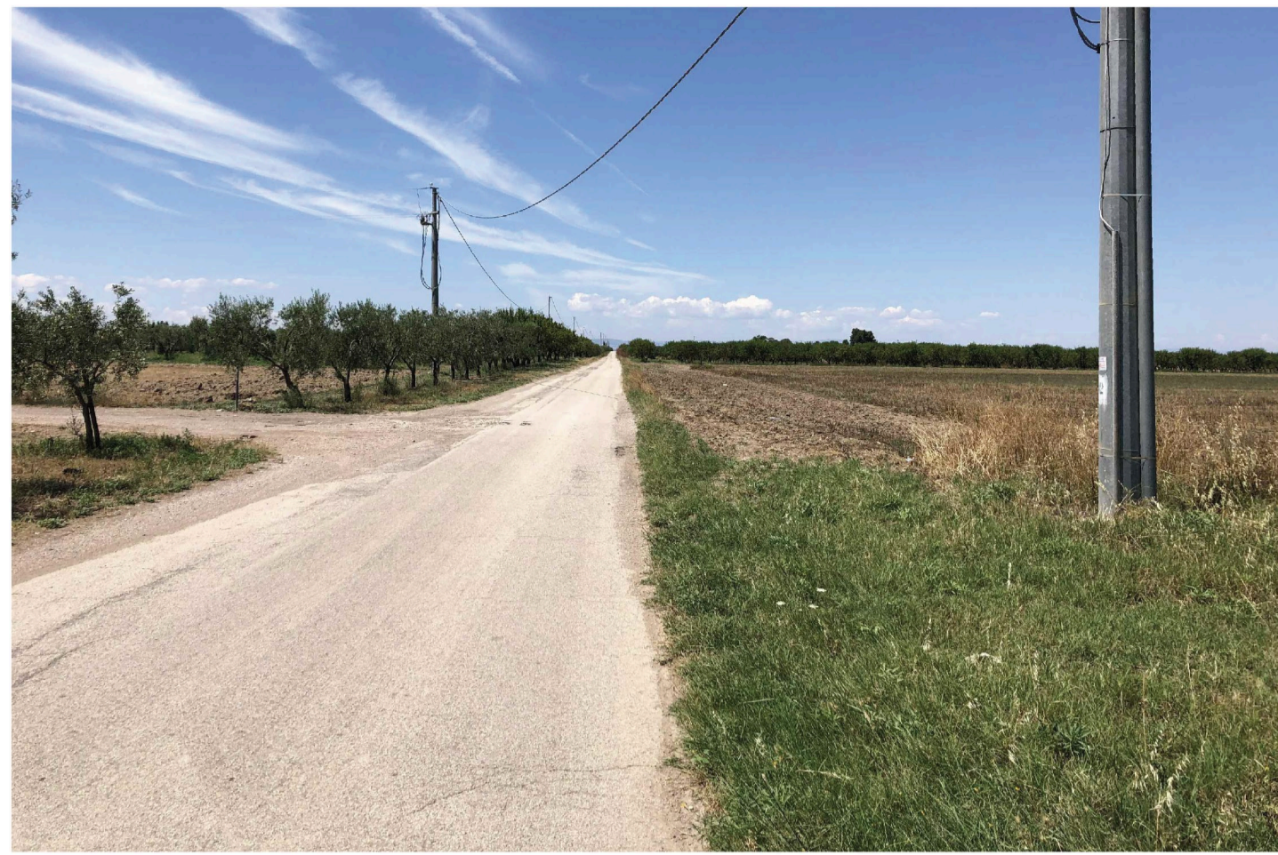
Orta Nova 1. Inquadratura 2 - Stato di fatto