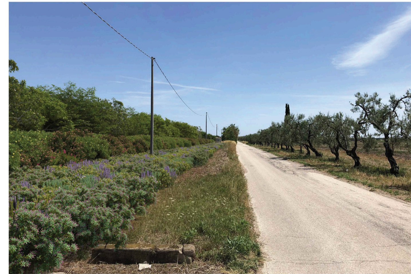
Orta Nova 1. Inquadratura 6 - Stato di progetto. Vista impianto con fascia di mitigazione.