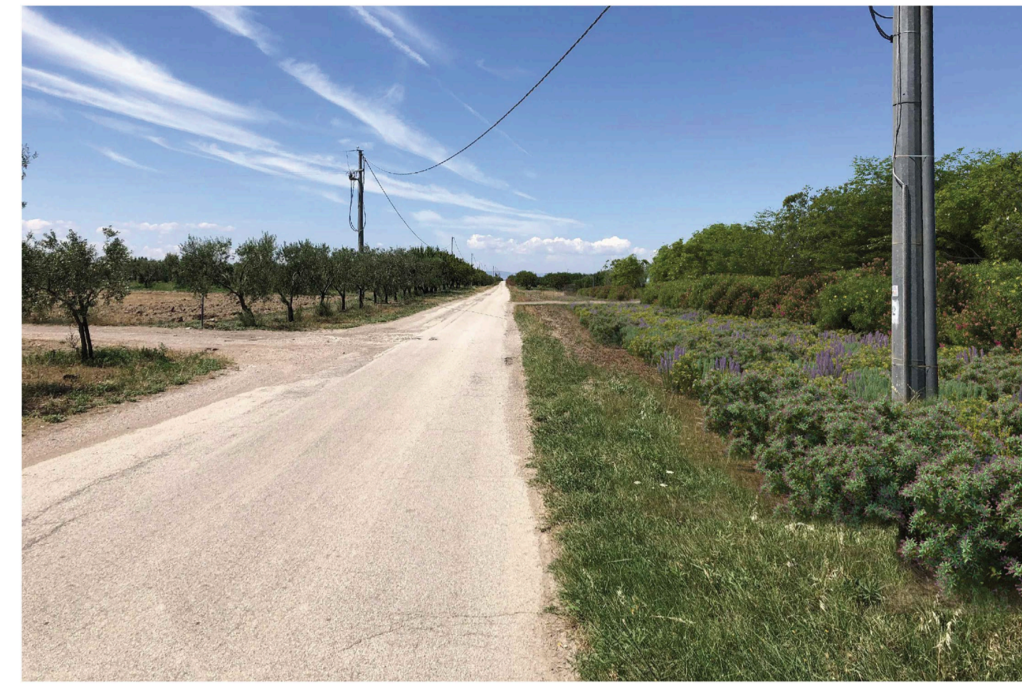
Orta Nova 1. Inquadratura 2 - Stato di progetto. Vista impianto con fascia di mitigazione.