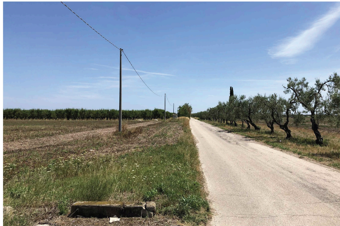
Orta Nova 1. Inquadratura 6 - Stato di fatto