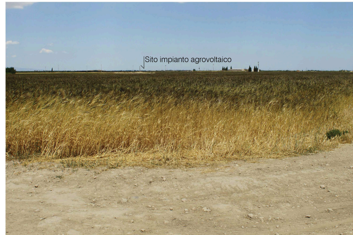
Orta Nova 1. Inquadratura 3 - Stato di progetto. Vista impianto senza fascia di mitigazione.