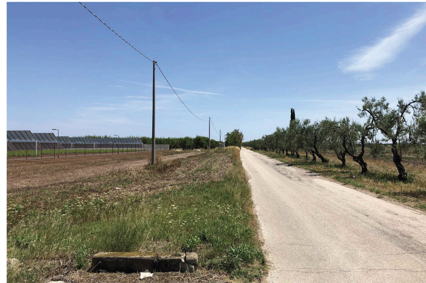
Orta Nova 1. Inquadratura 6 - Stato di progetto. Vista impianto senza fascia di mitigazione.