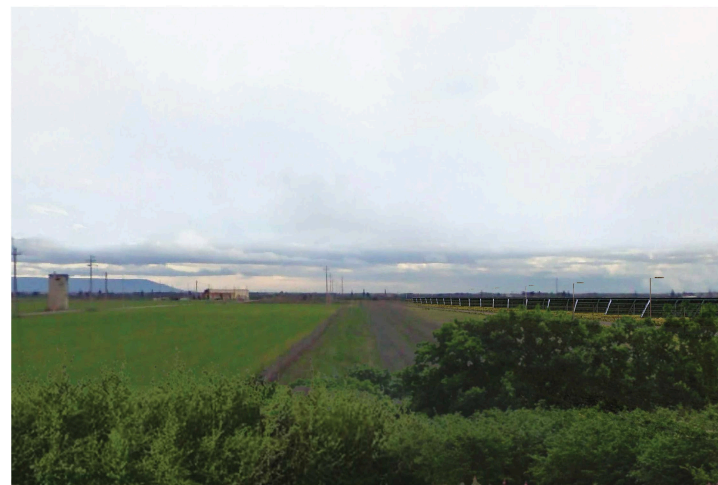
Orta Nova 2. Inquadatura 4 - Stato di progetto. Vista impianto senza fascia di mitigazione.