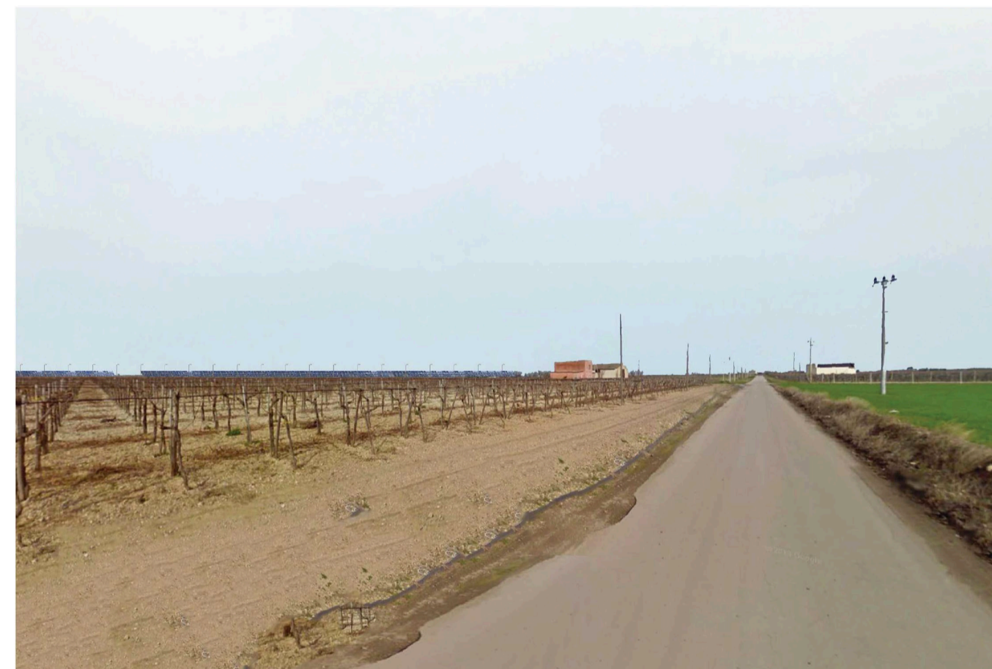
Orta Nova 2. Inquadatura 3 - Stato di progetto. Vista impianto senza fascia di mitigazione.