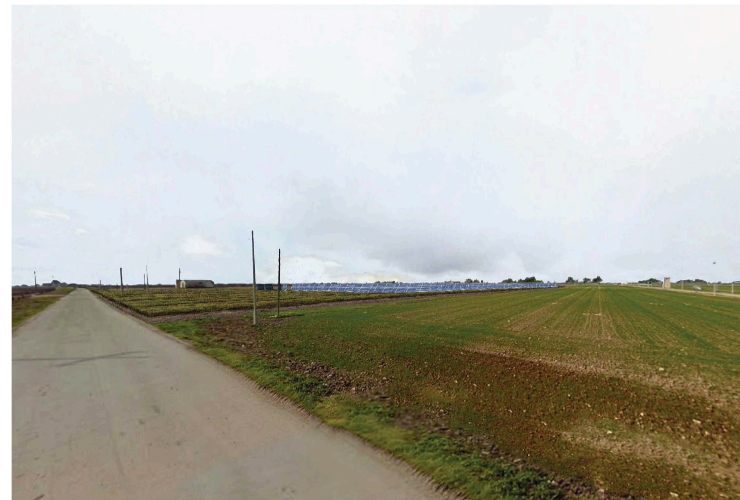
Orta Nova 2. Inquadatura 2 - Stato di progetto. Vista impianto senza fascia di mitigazione.