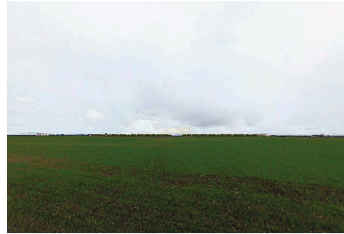
Orta Nova 2. Inquadatura 1 - Stato di progetto. Vista impianto con fascia di mitigazione.