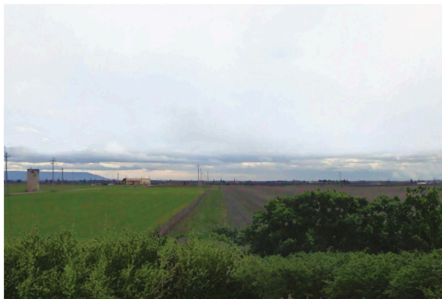
Orta Nova 2. Inquadatura 4 - Sato di fatto