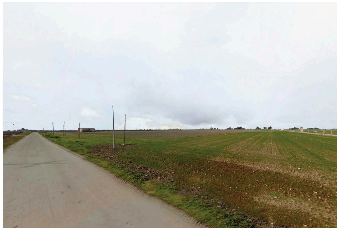
Orta Nova 2. Inquadatura 2 - Sato di fatto