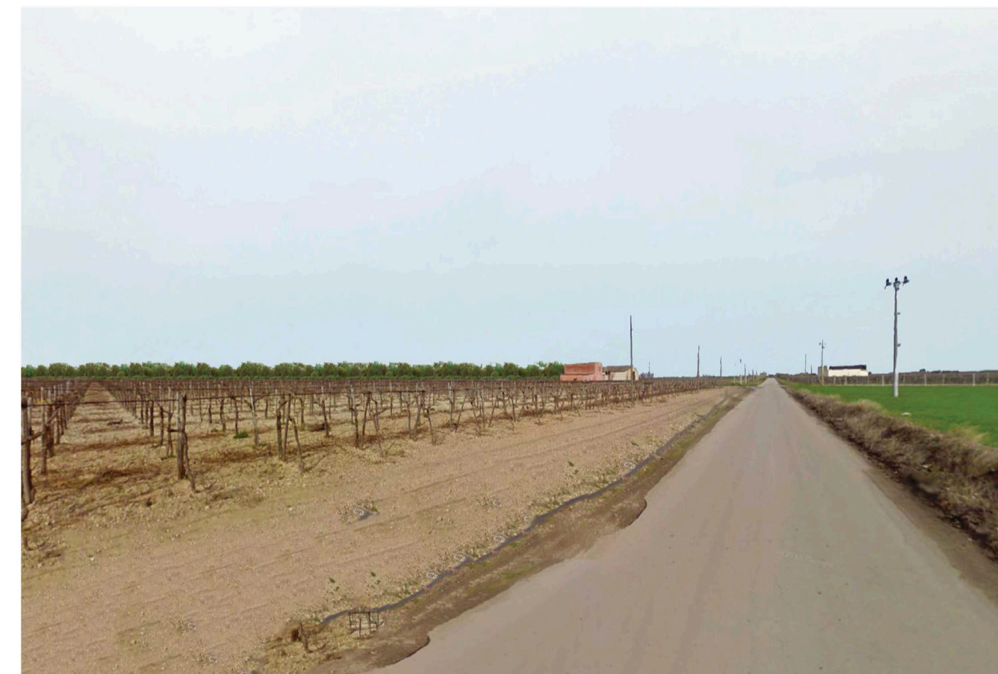
Orta Nova 2. Inquadatura 3 - Stato di progetto. Vista impianto con fascia di mitigazione.