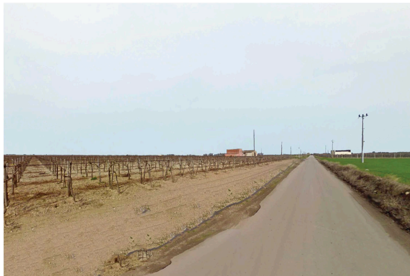
Orta Nova 2. Inquadatura 3 - Sato di fatto