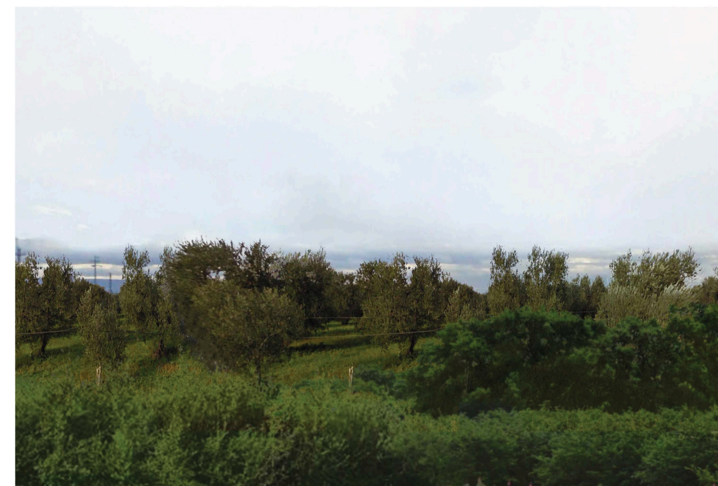
Orta Nova 2. Inquadatura 4 - Stato di progetto. Vista impianto con fascia di mitigazione.