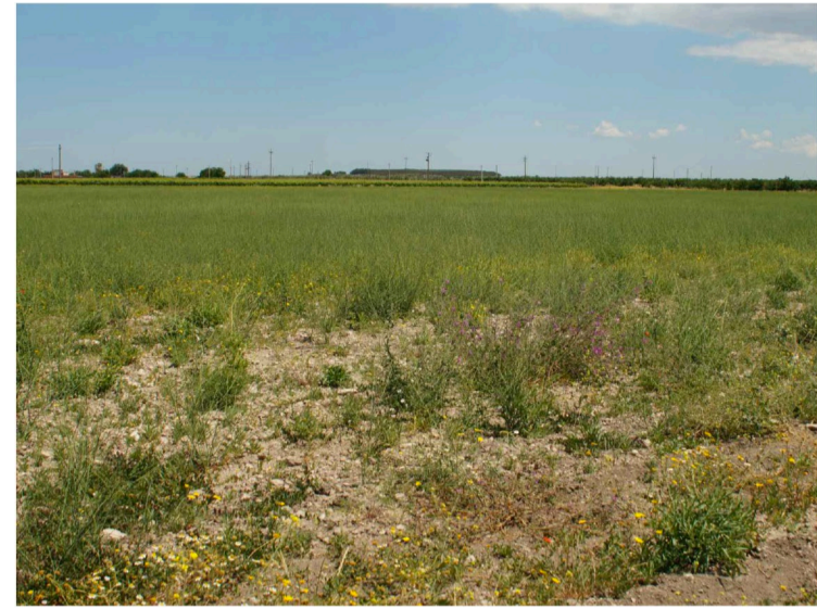
Sito: Vista 2