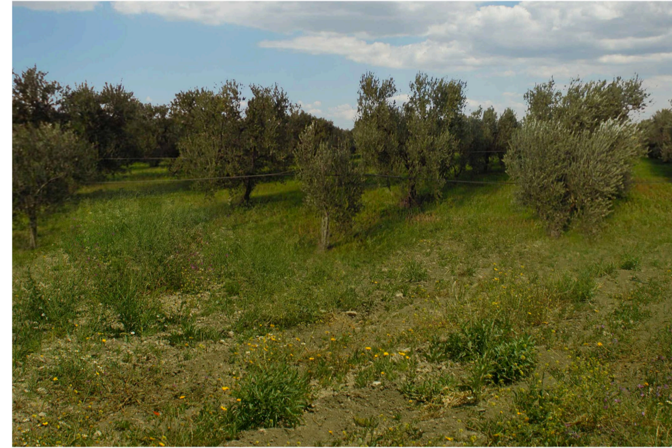
Sito: Stato di Progetto