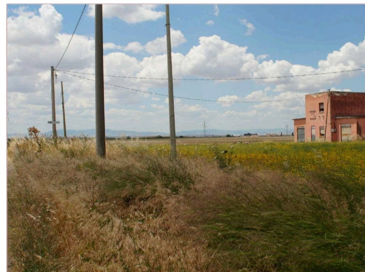
Sito: Tratturo Vista 1