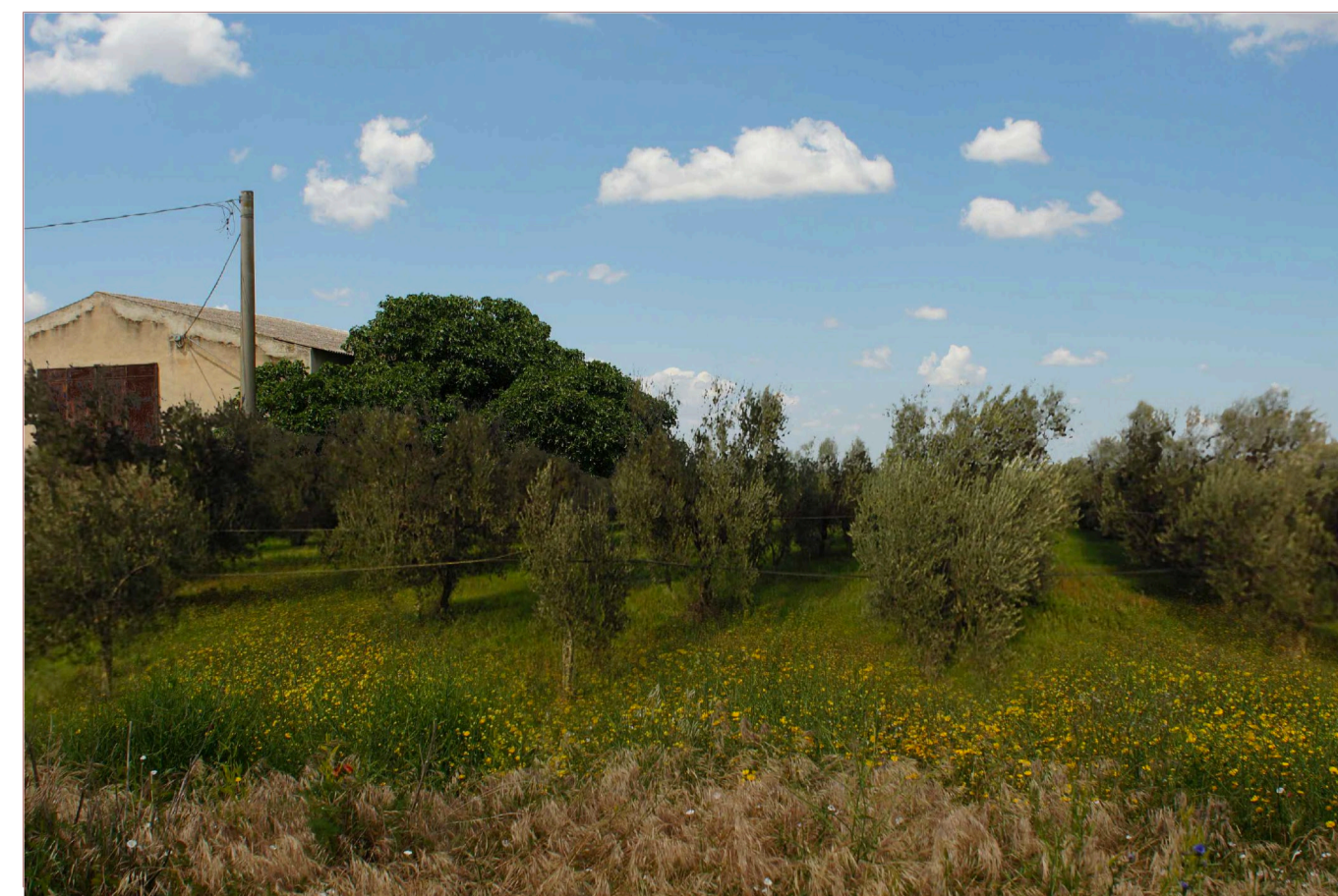
Sito: Tratturo. Stato di Progetto