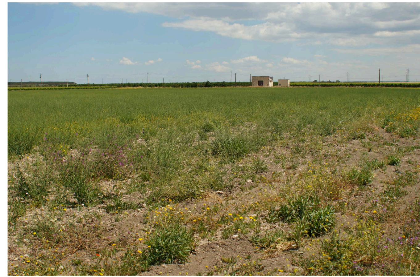
Sito: . Stato di Fatto