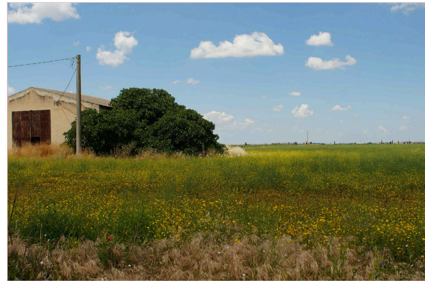
Sito: Tratturo. Stato di Fatto