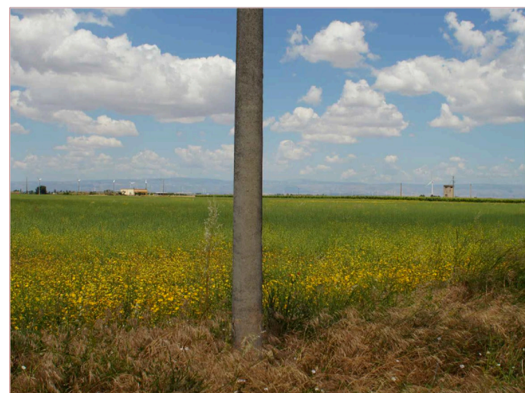
Sito: Tratturo Vista 3