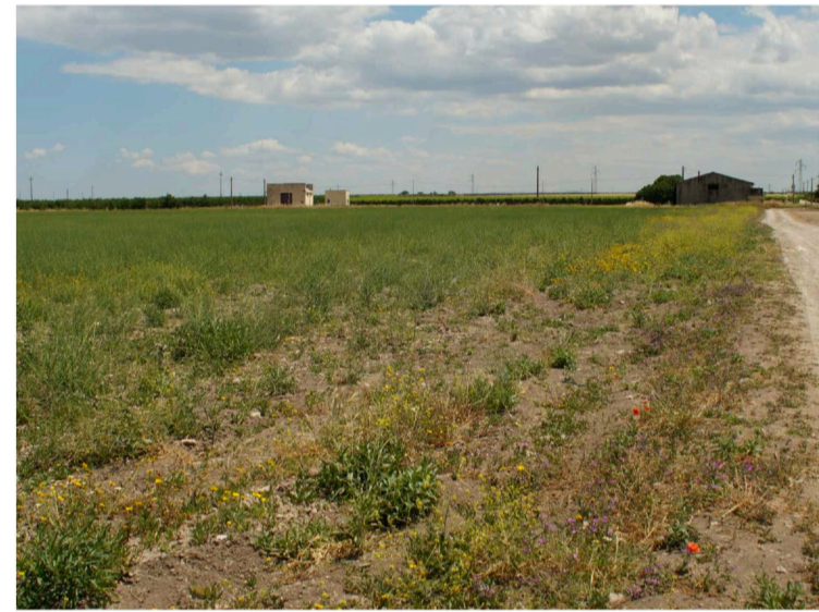
Sito: Vista 3