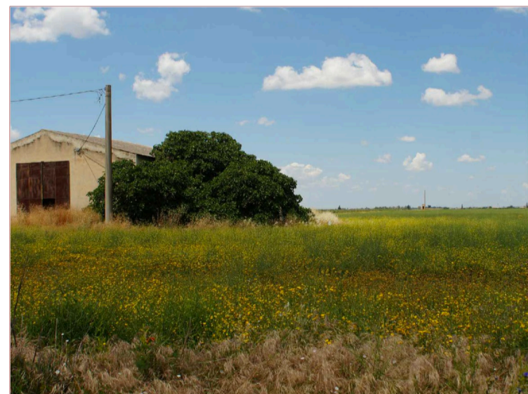
Sito: Tratturo Vista 2