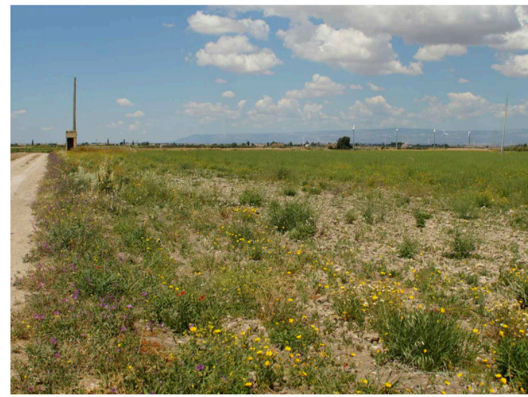
Sito: Vista 1