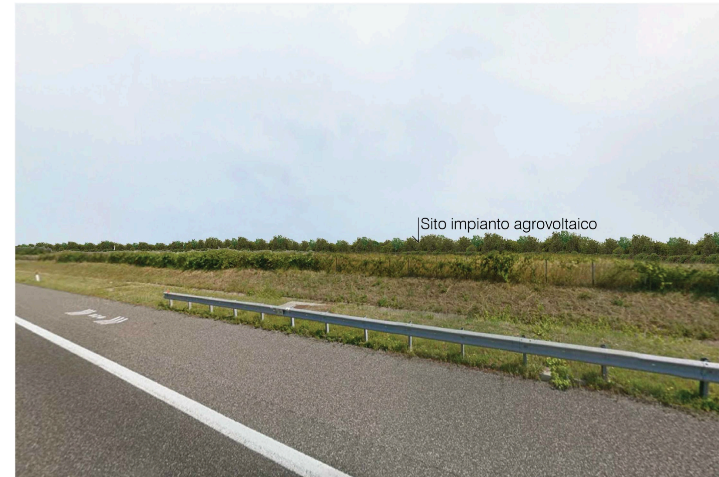
Orta Nova 1. Inquadatura 5 - Stato di progetto. Vista impianto con fascia di mitigazione.