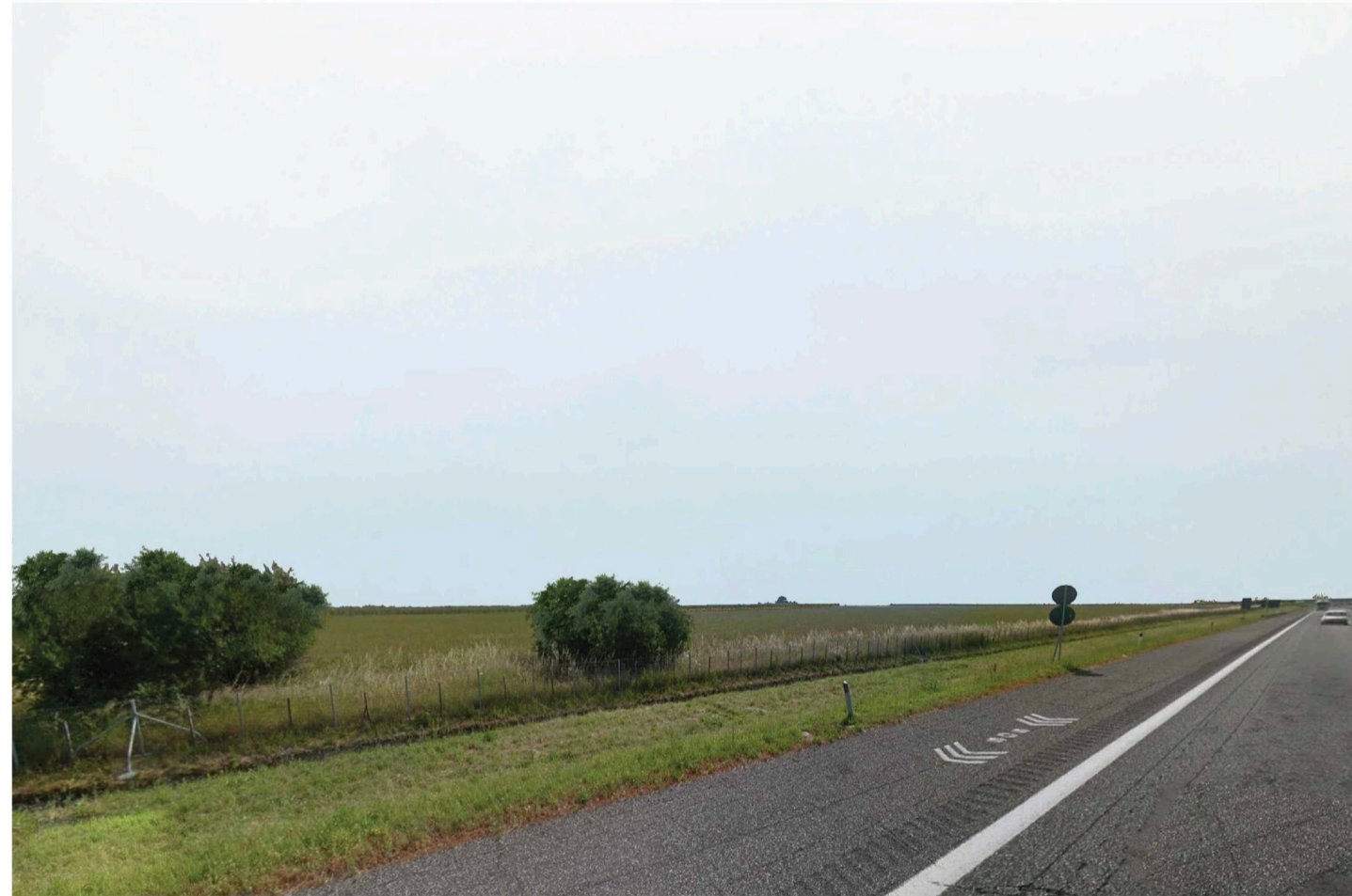
Orta Nova 1. Inquadatura 4 - Sato di fatto