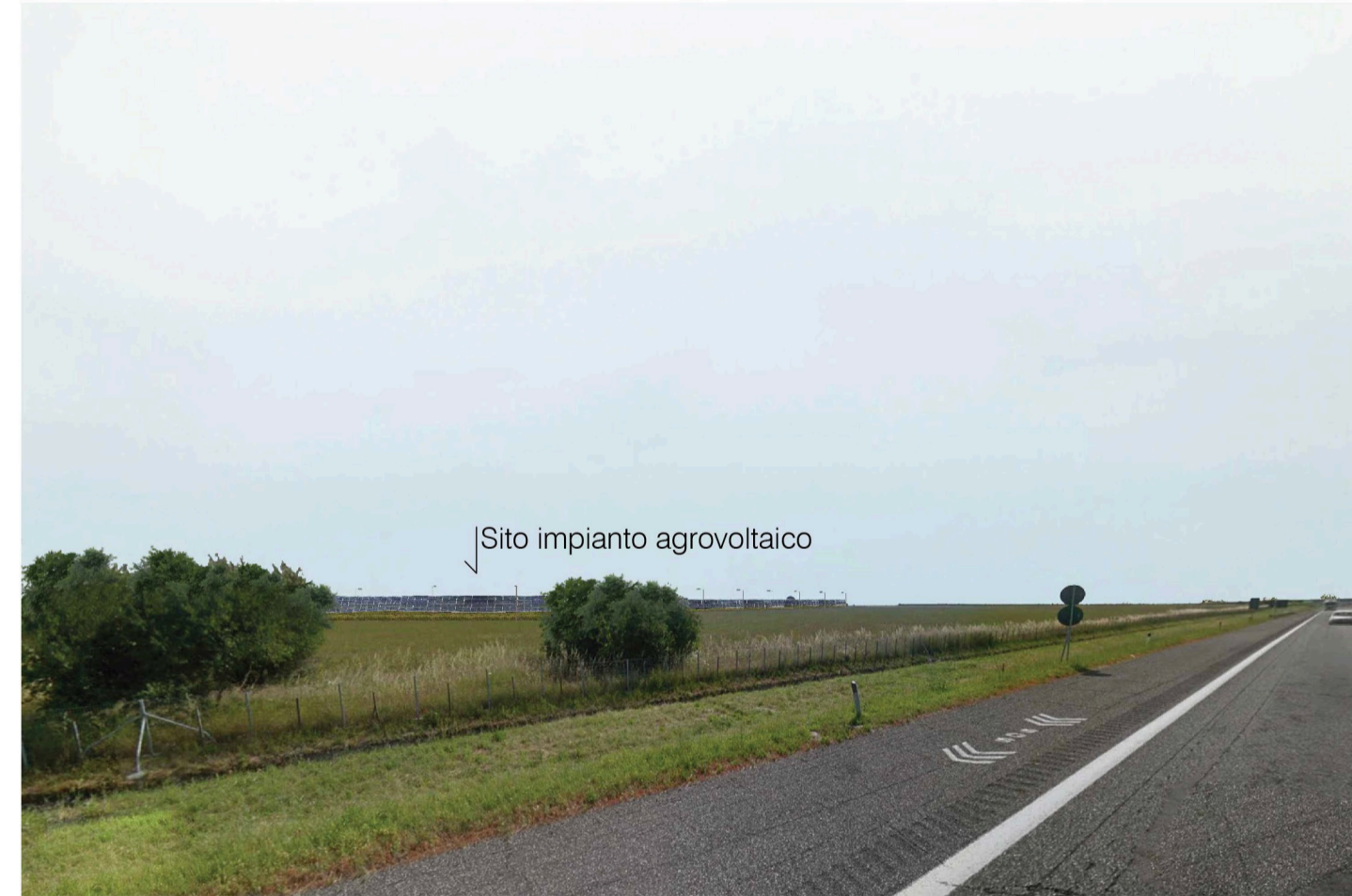
Orta Nova 1. Inquadatura 4 - Stato di progetto. Vista impianto senza fascia di mitigazione.