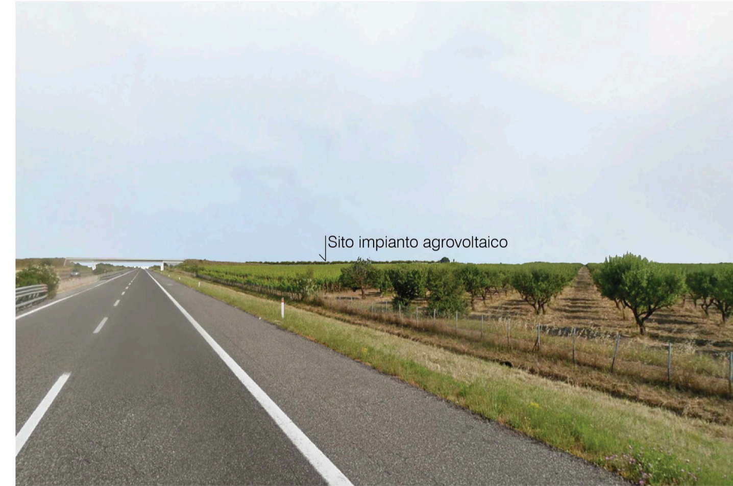
Orta Nova 1. Inquadatura 3 - Stato di progetto. Vista impianto con fascia di mitigazione.