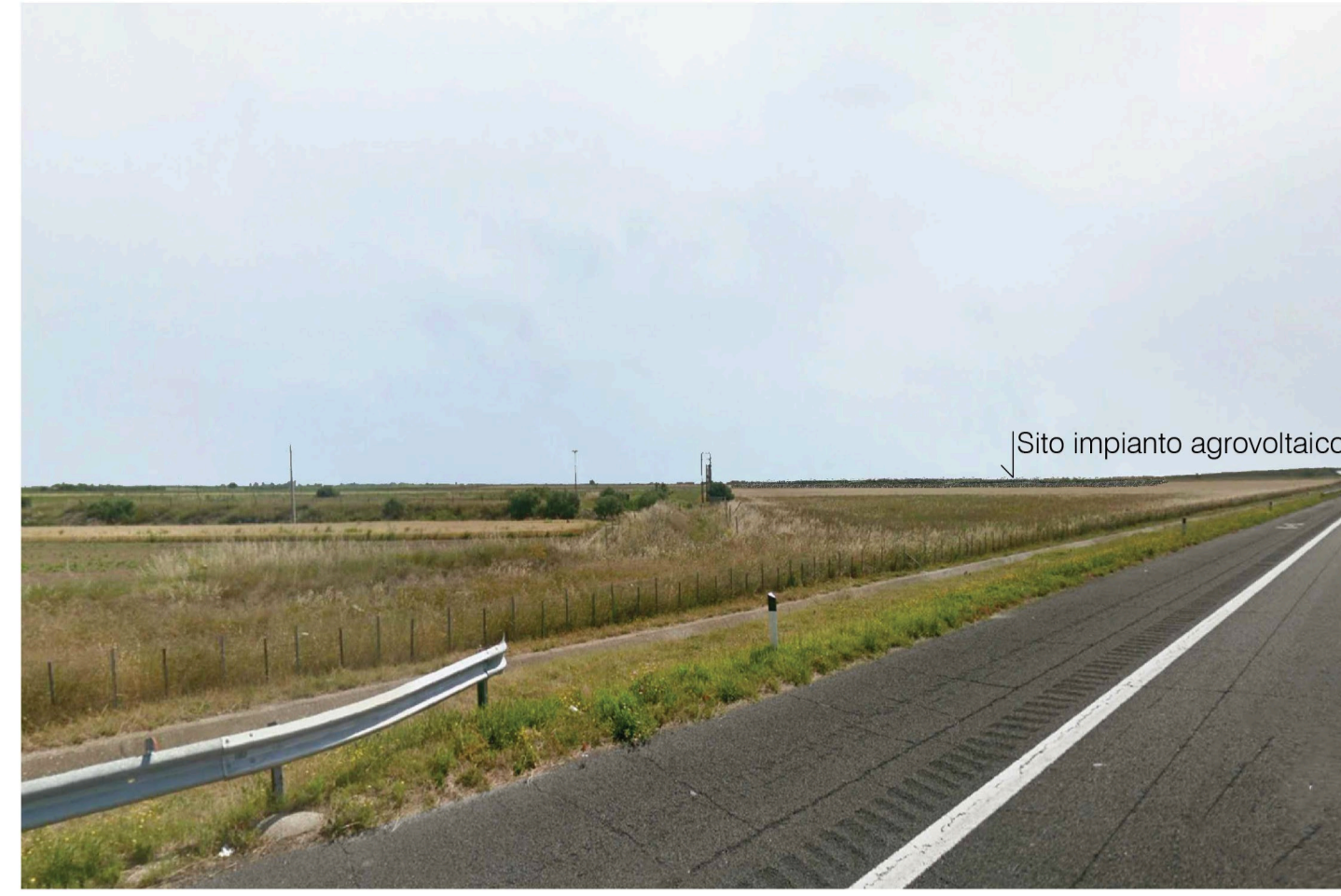
Orta Nova 1. Inquadatura 2 - Stato di progetto. Vista impianto senza fascia di mitigazione.