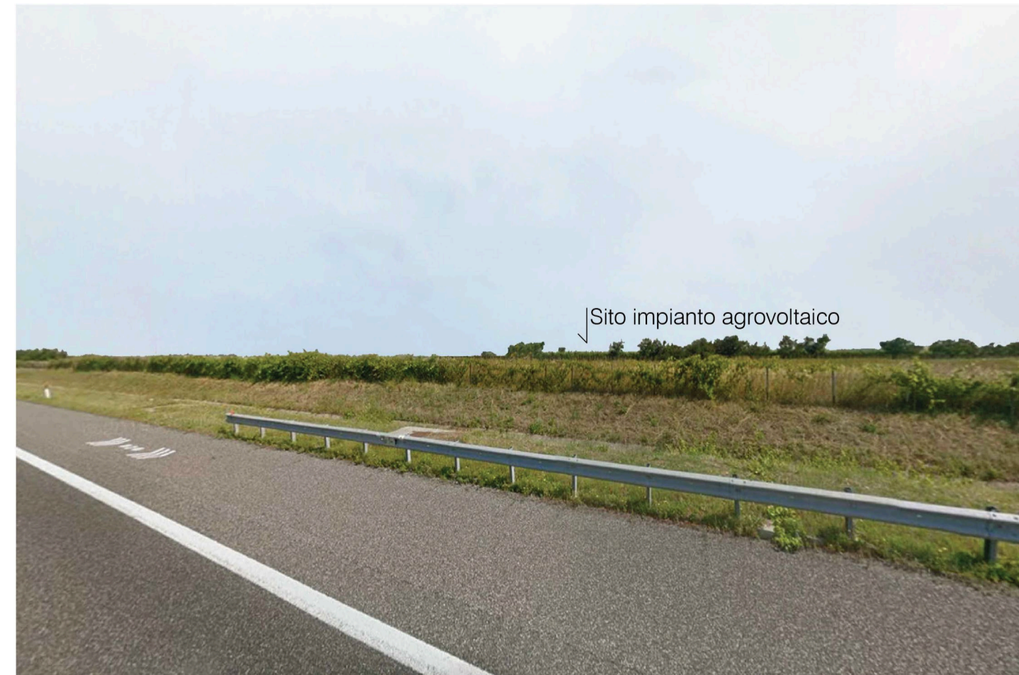
Orta Nova 1. Inquadatura 5 - Stato di progetto. Vista impianto senza fascia di mitigazione.