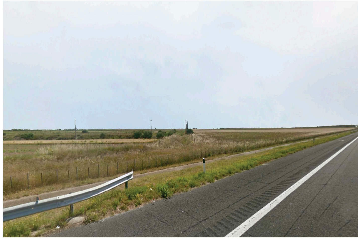
Orta Nova 1. Inquadatura 2 - Sato di fatto