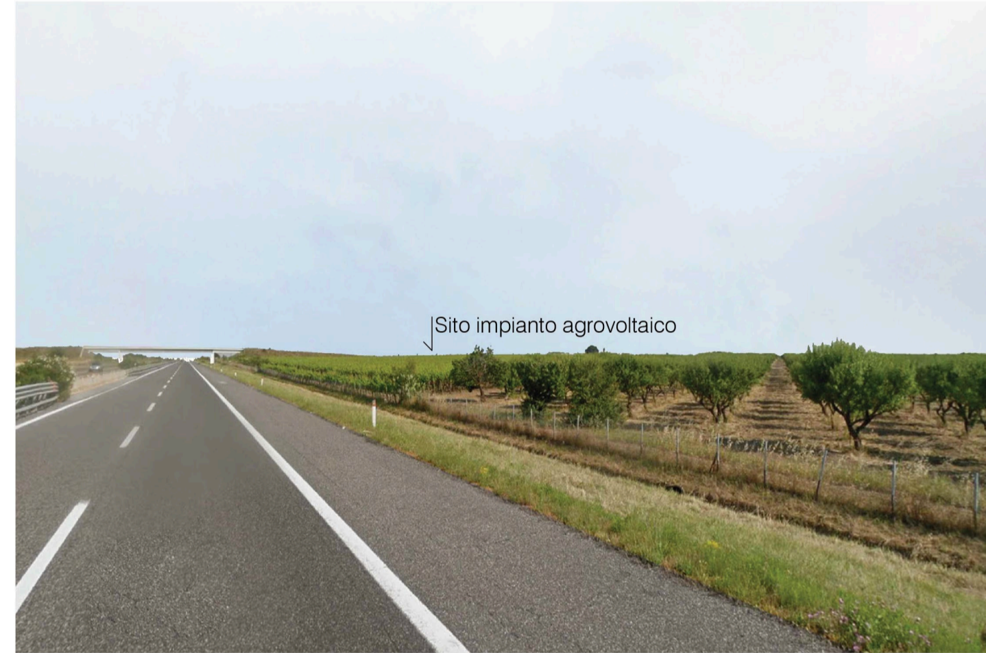
Orta Nova 1. Inquadatura 3 - Stato di progetto. Vista impianto senza fascia di mitigazione.