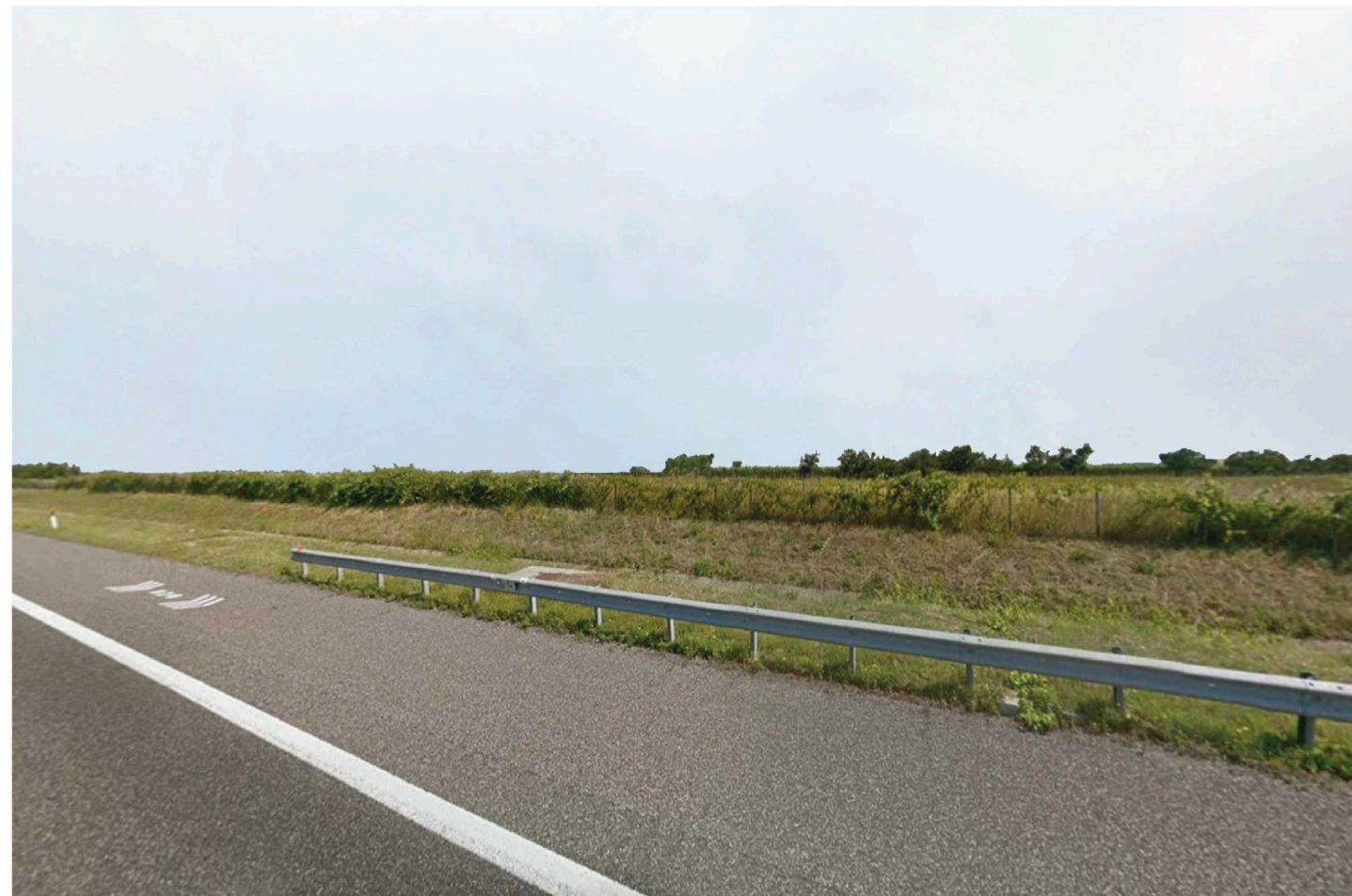
Orta Nova 1. Inquadatura 5 - Sato di fatto