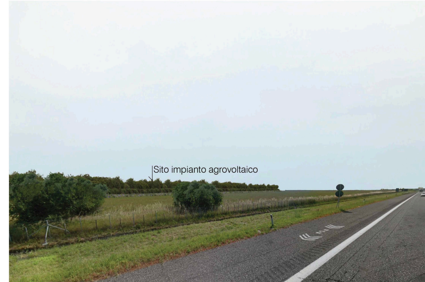
Orta Nova 1. Inquadatura 4 - Stato di progetto. Vista impianto con fascia di mitigazione.