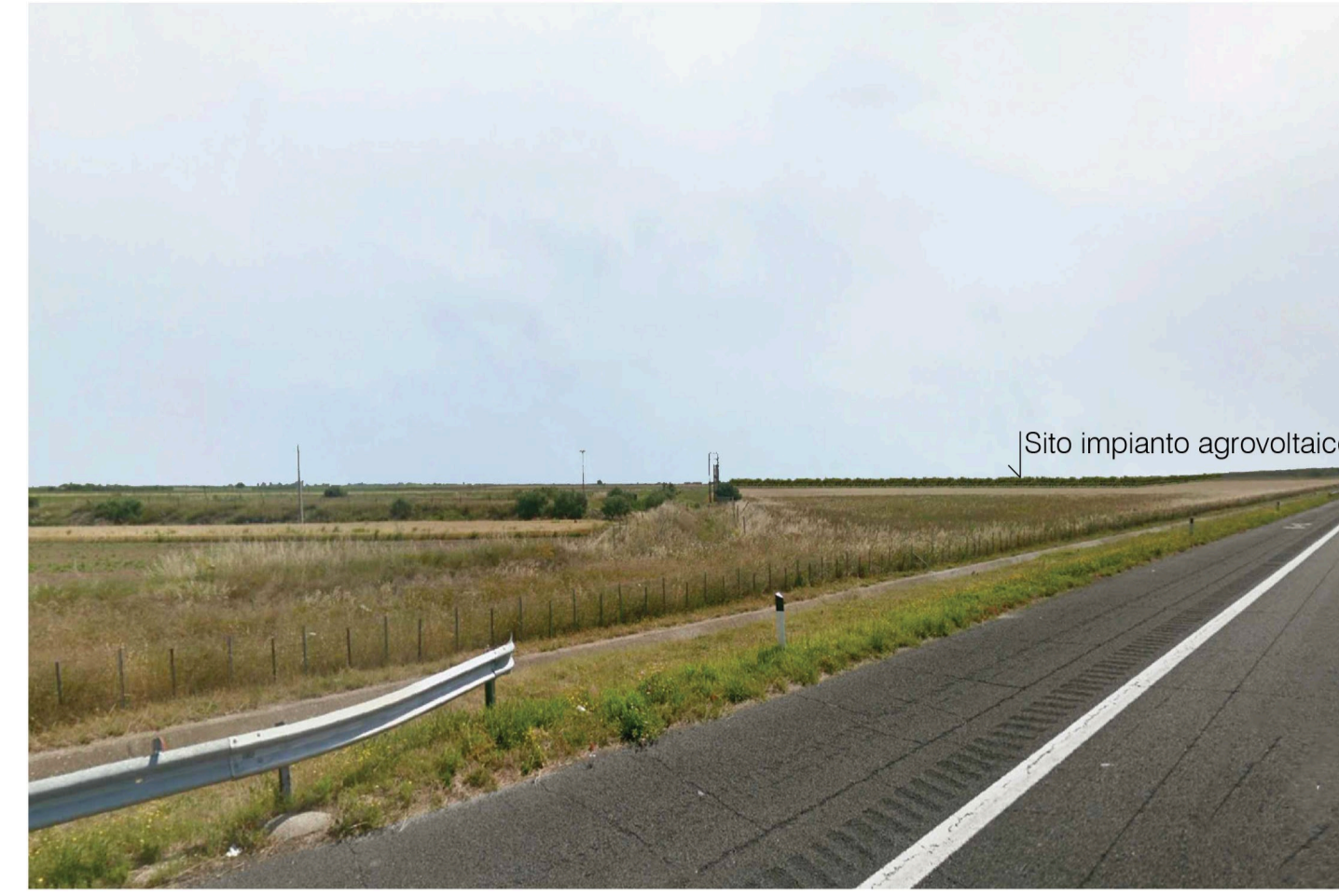
Orta Nova 1. Inquadatura 2 - Stato di progetto. Vista impianto con fascia di mitigazione.