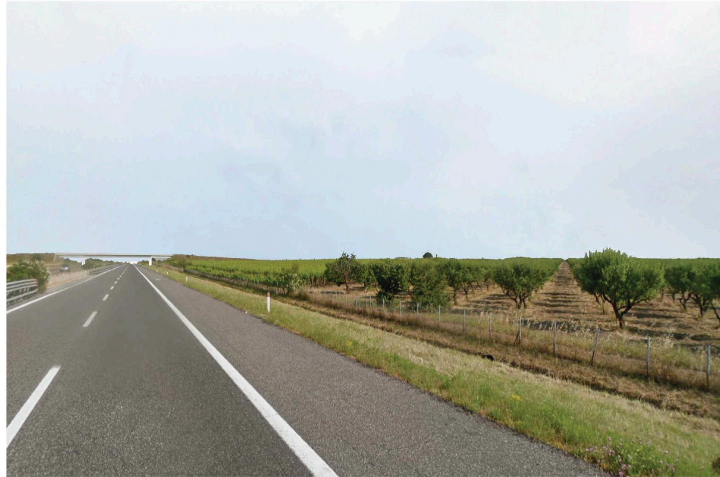
Orta Nova 1. Inquadatura 3 - Sato di fatto