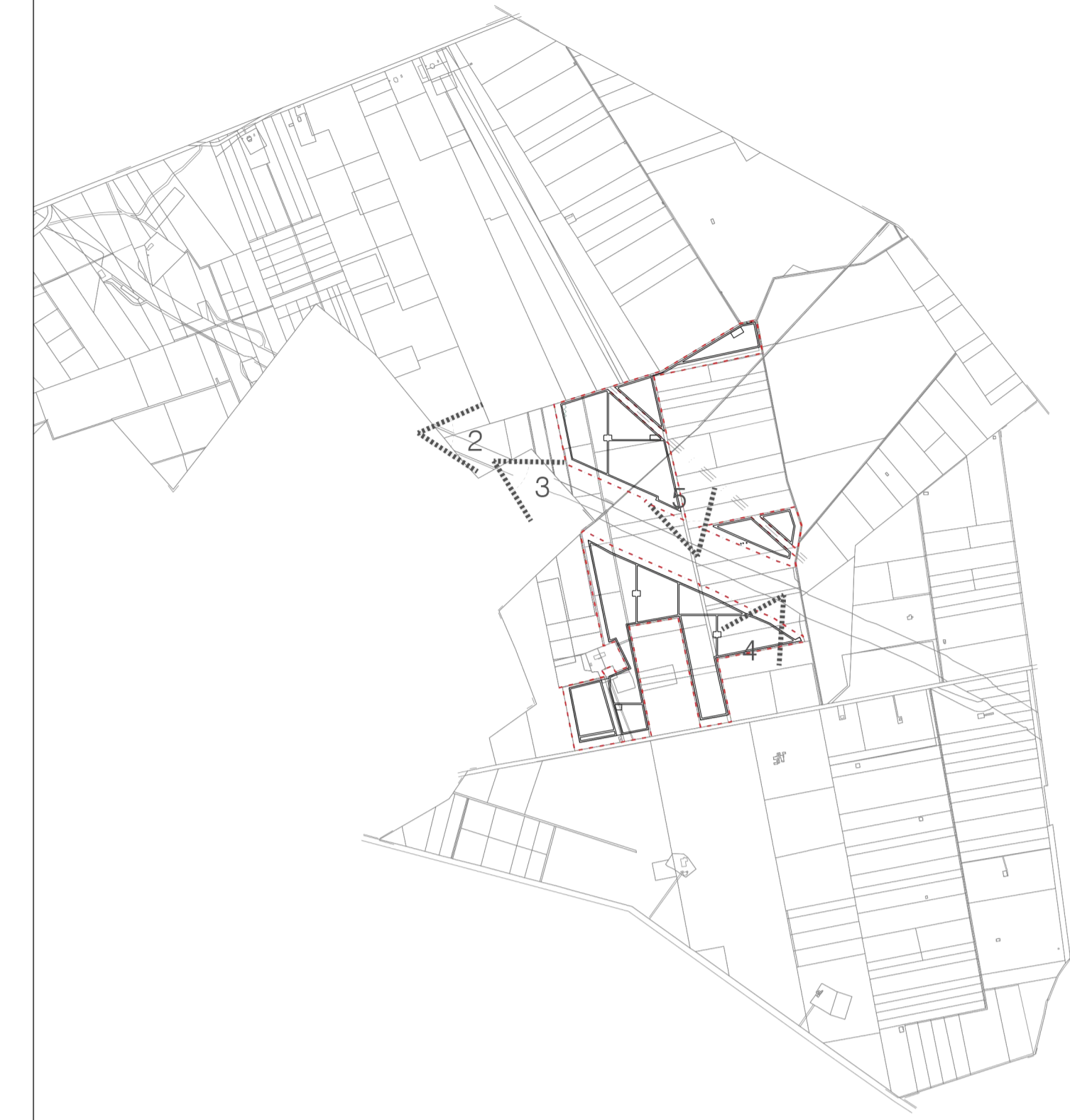
K-PLAN AREA DI INTERVENTO