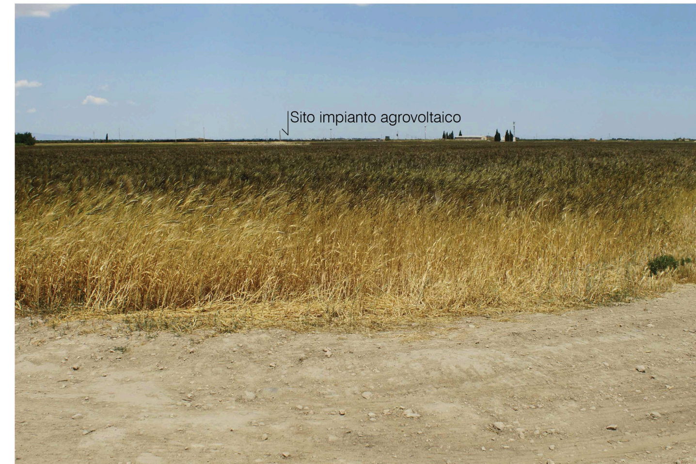
Orta Nova 1. Inquadratura 3 - Stato di progetto. Vista impianto con fascia di mitigazione.