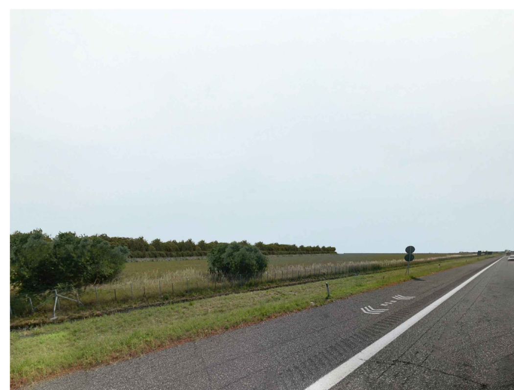
Fotoinserimento - con fascia di mitigazione di 5 m