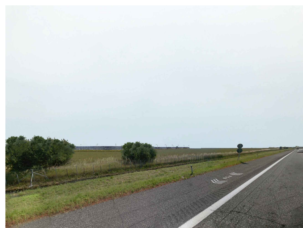
Fotoinserimento - senza fascia di mitigazione