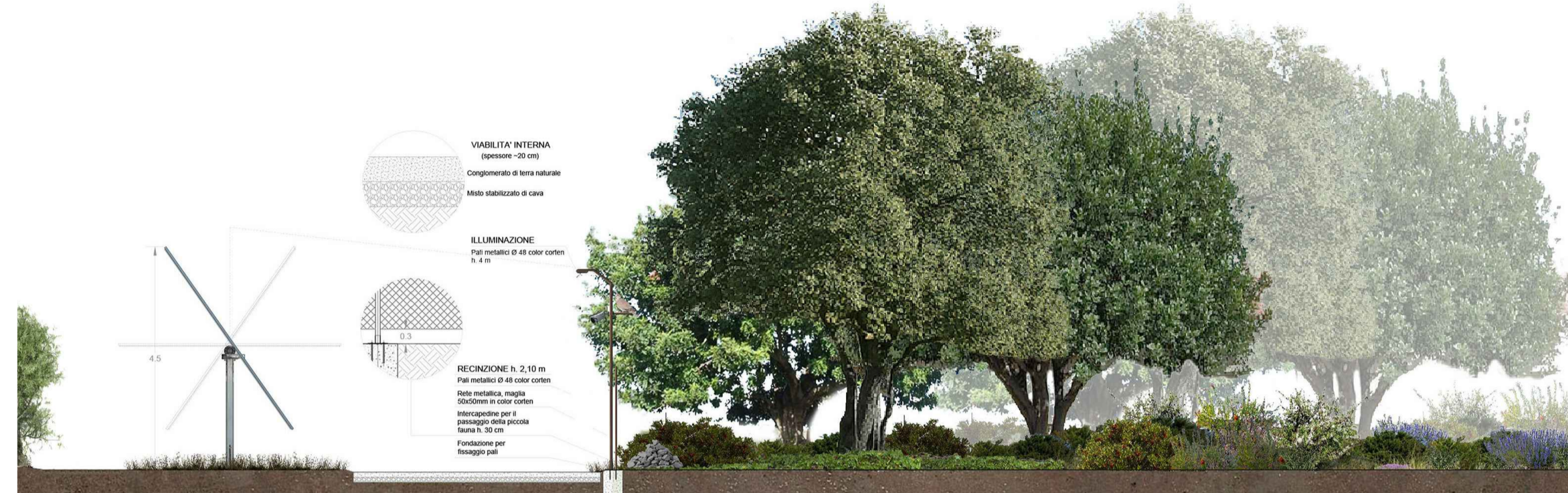
Sezione fascia di mitigazione da 20 mt

ASPARAGUS ACUTIFOLIUS CALICOTOME INFESTA CERATONIA SILIQUA CISTUS MONSPELIENSIS DAPHNE GNIDIUM FICUS CARICA HEDERA HELIT PISTACIA LENTISCUS PYRUS SPINOSA QUERCUS ILEX THYMUS CAPITATUS