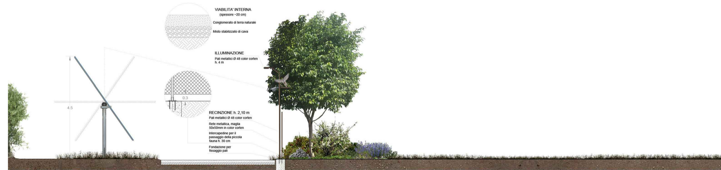
Sezione fascia di mitigazione da 5 mt

ASPARAGUS ACUTIFOLIUS CALICOTOME INFESTA CERATONIA SILIQUA DAPHNE GNIDIUM FICUS CARICA HEDERA HELIT PISTACIA LENTISCUS PYRUS SPINOSA QUERCUS ILEX