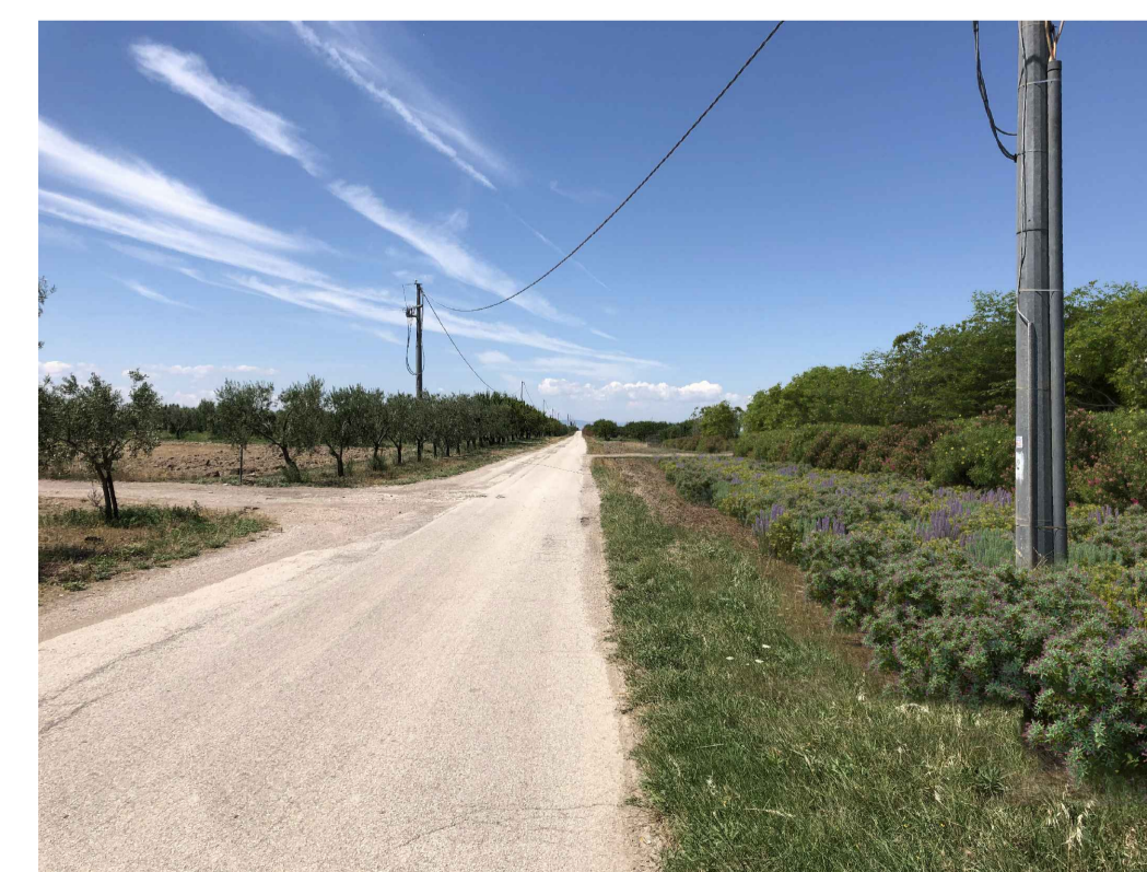
Fotoinserimento - con fascia di mitigazione di 20 m