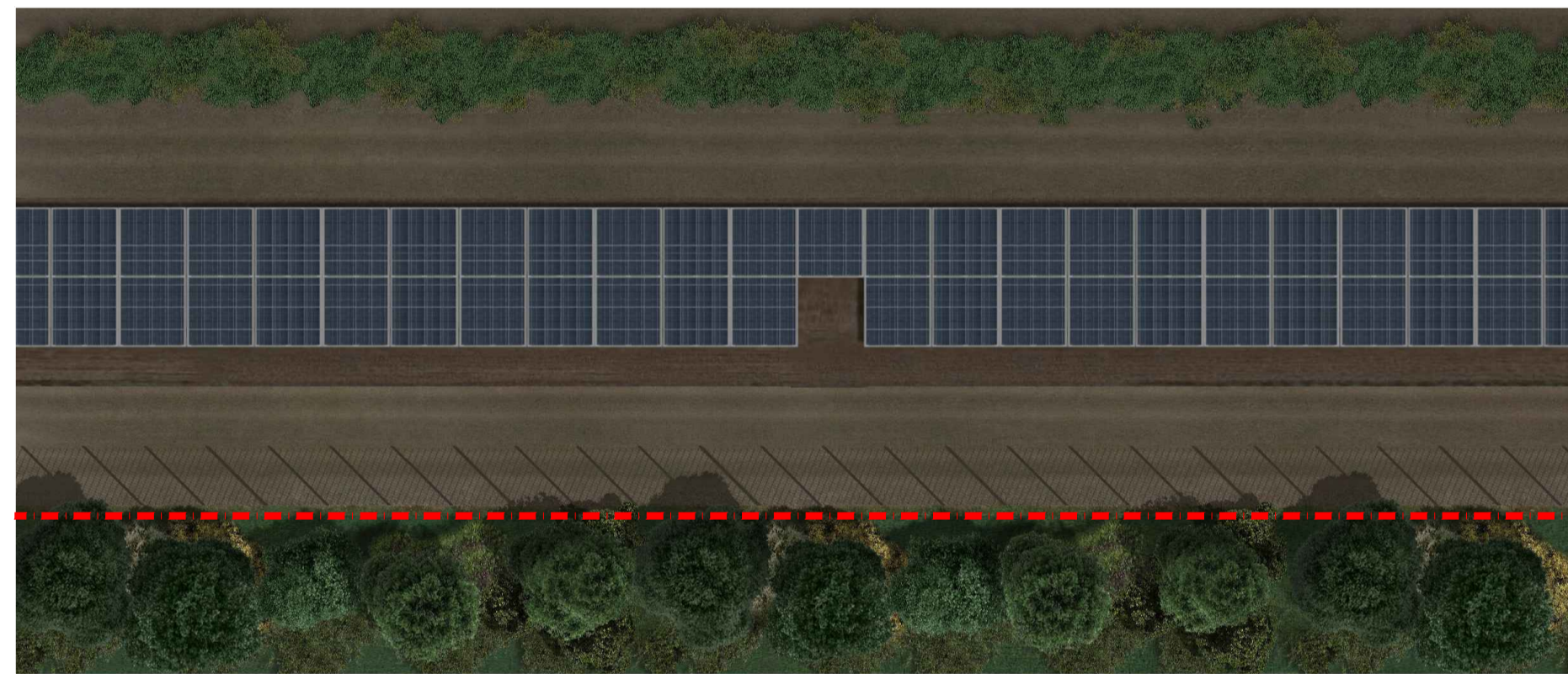
Ortofoto fascia di mitigazione da 5 mt

ASPARAGUS ACUTIFOLIUS CALICOTOME INFESTA CERATONIA SILIQUA CISTUS MONSPELIENSIS DAPHNE GNIDIUM FICUS CARICA HEDERA HELIT PISTACIA LENTISCUS PYRUS SPINOSA QUERCUS ILEX THYMUS CAPITATUS