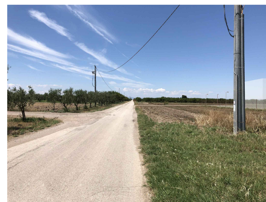
Fotoinserimento - senza fascia di mitigazione