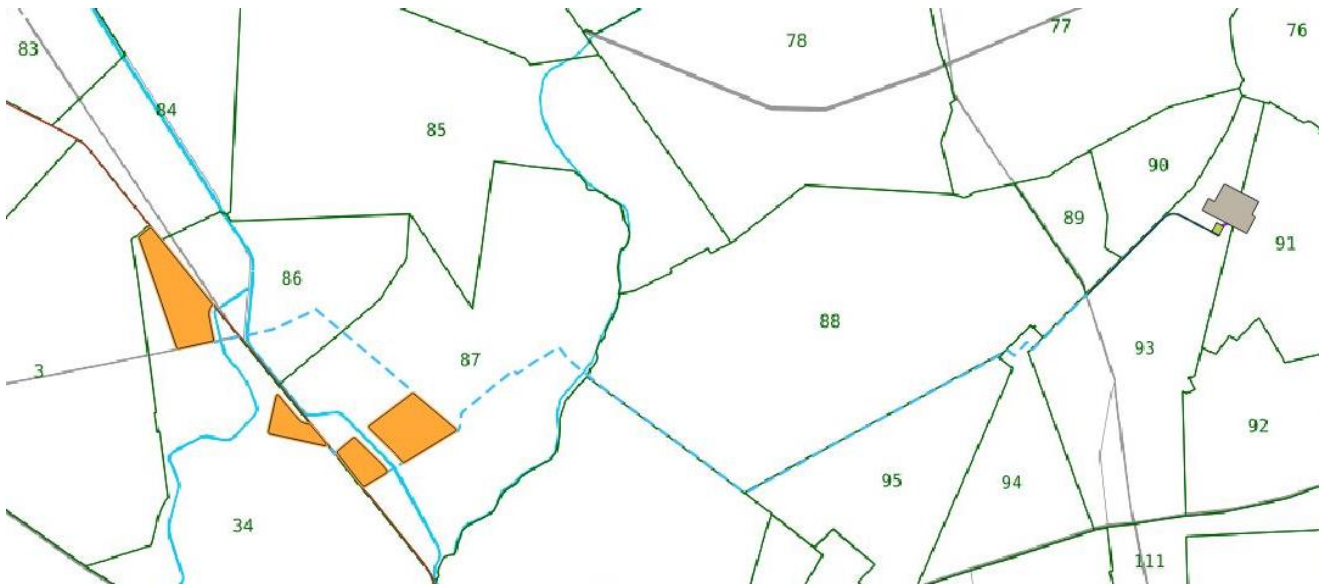
Figura 2-2: inquadramento su base catastale

La Sottostazione Elettrica , sarà invece ubicata alla: