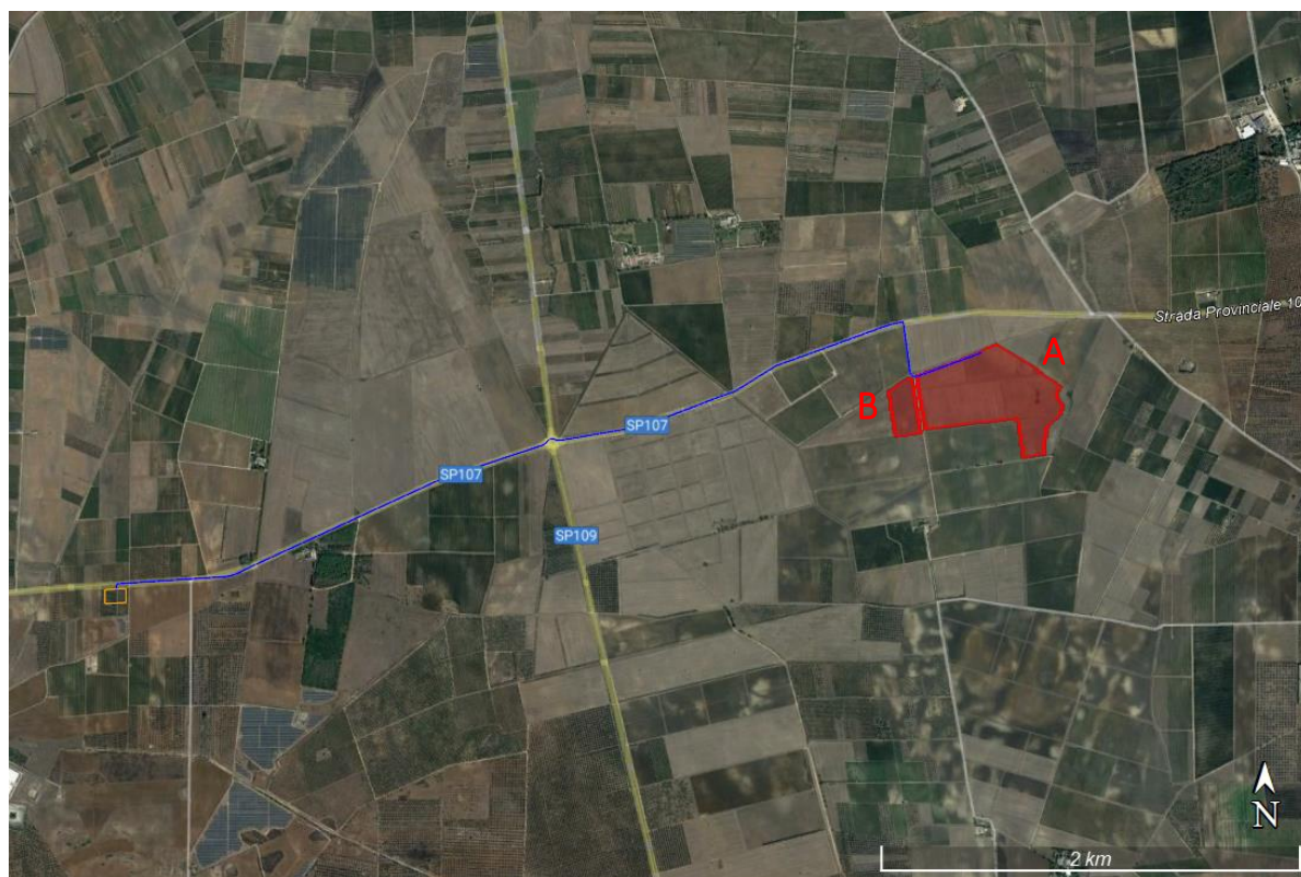
Figura 2.1: Localizzazione dell'area di intervento (ROSSO: impianto; BLU: connessione).

Complessivamente l'area presenta un'estensione catastale pari a circa 27,7 ettari, di cui 24 ha cintati (area A 21 ha e area B 3 ha).