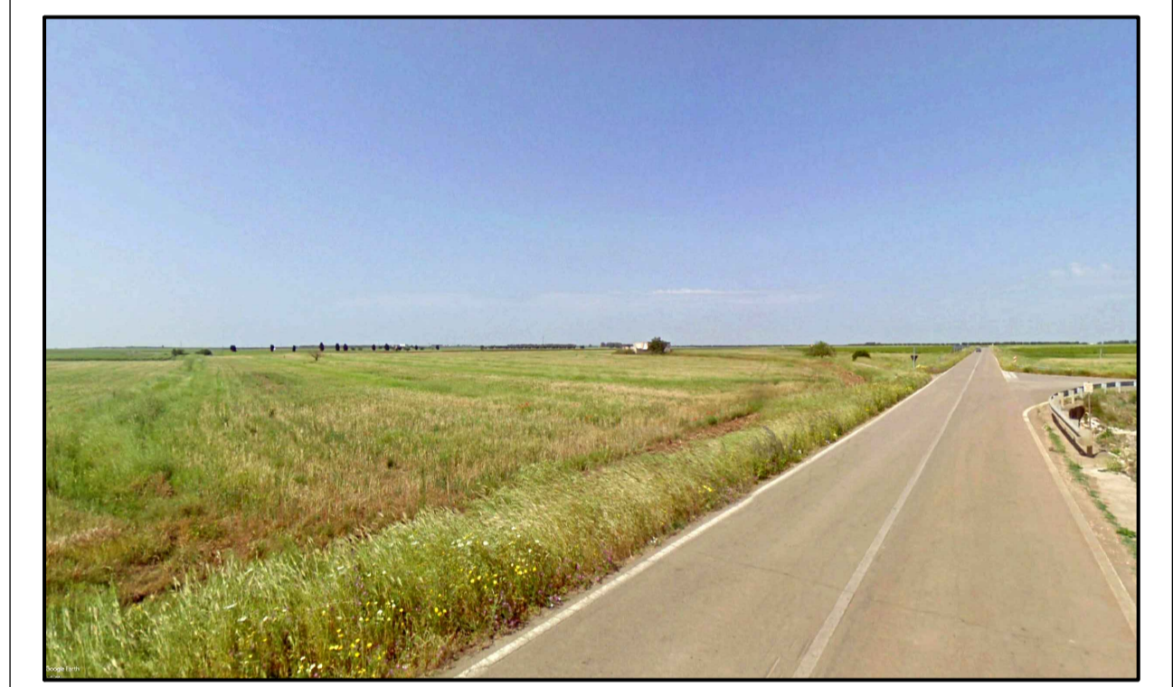
FOTOINSERIMENTO 4 - STATO DI FATTO