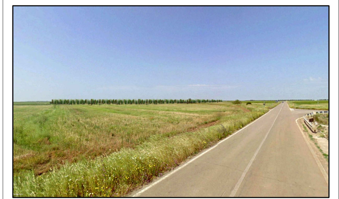
FOTOINSERIMENTO 4 - STATO DI PROGETTO