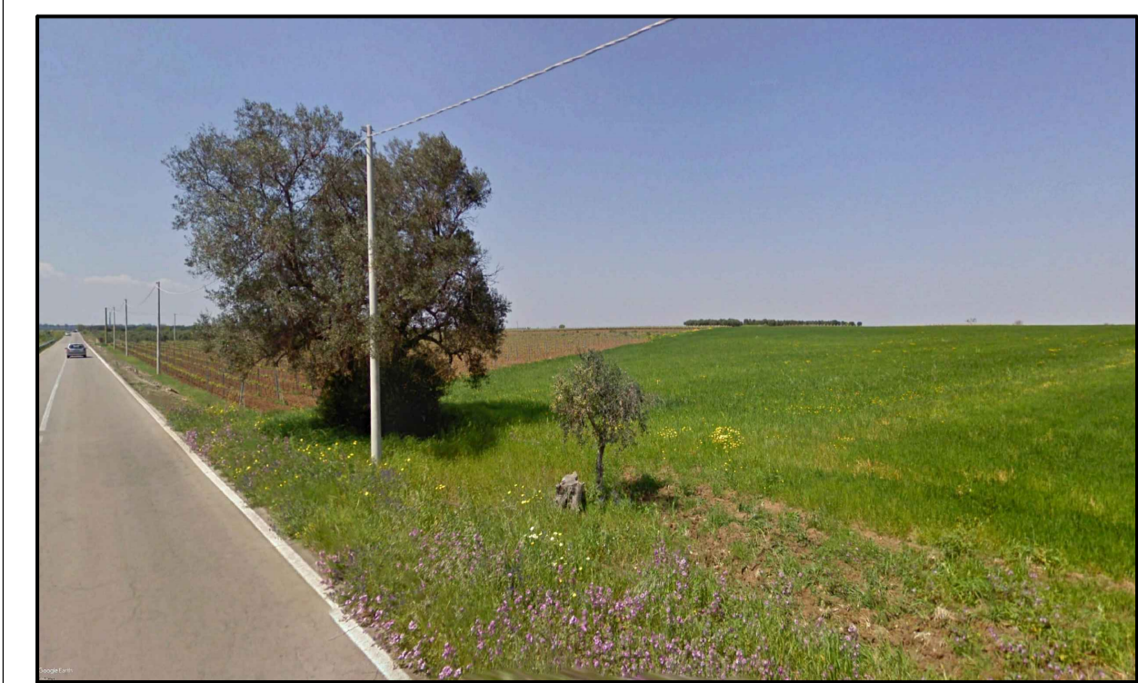
PUNTO DI PRESA FOTOGRAFICA 2