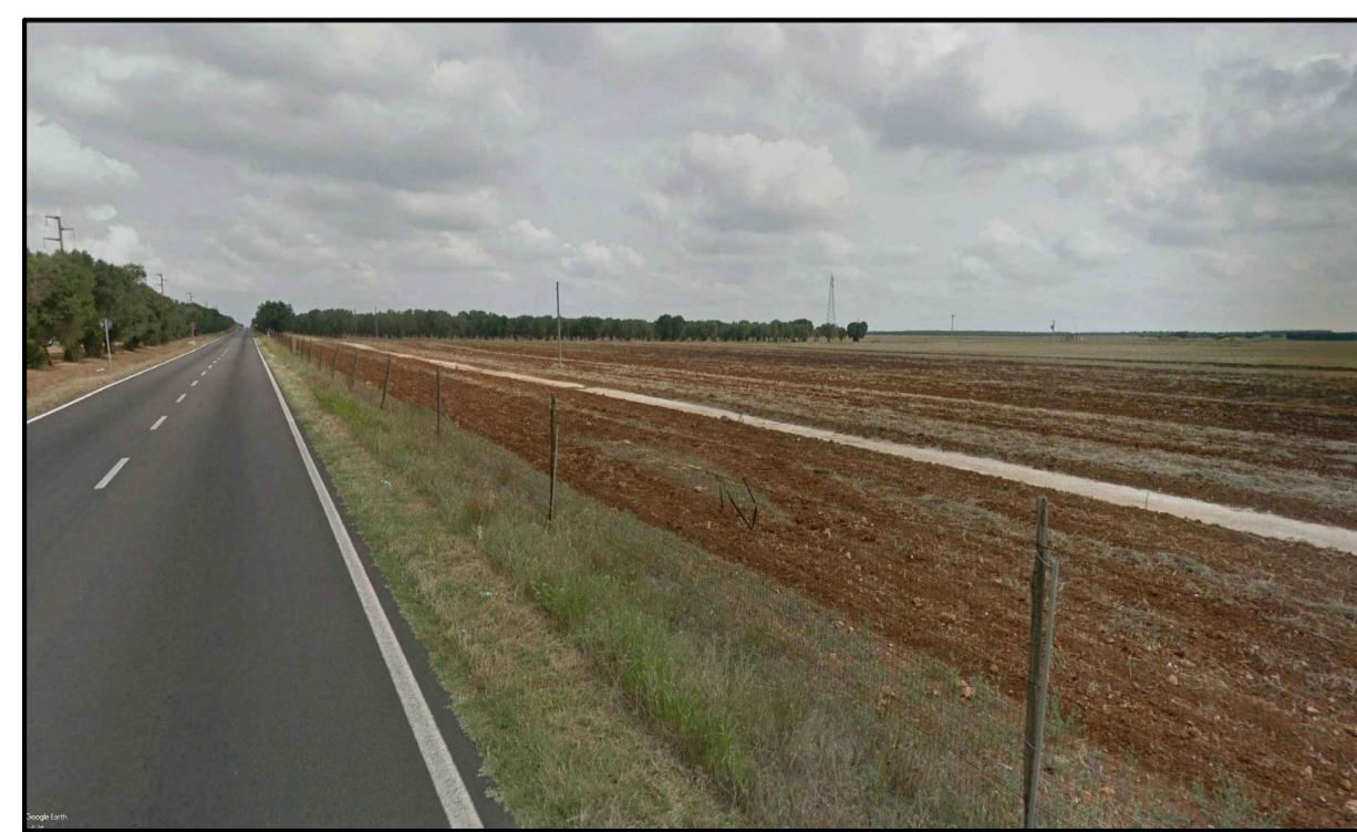
PUNTO DI PRESA FOTOGRAFICA 1