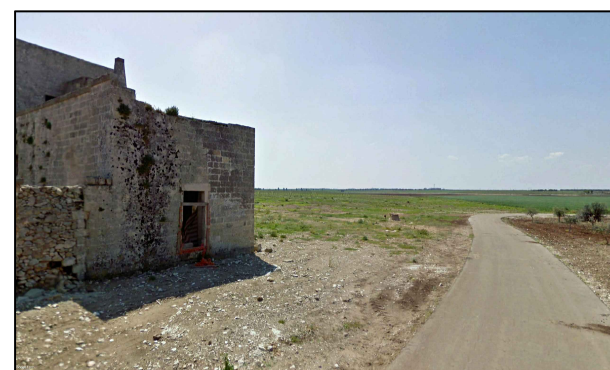
FOTOINSERIMENTO 10 - STATO DI FATTO