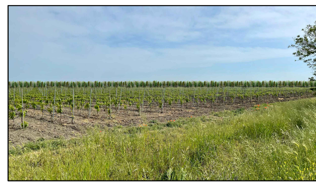
FOTOINSERIMENTO 13 - STATO DI PROGETTO