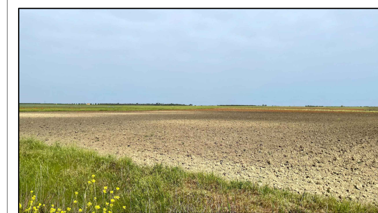
FOTOINSERIMENTO 14 - STATO DI FATTO