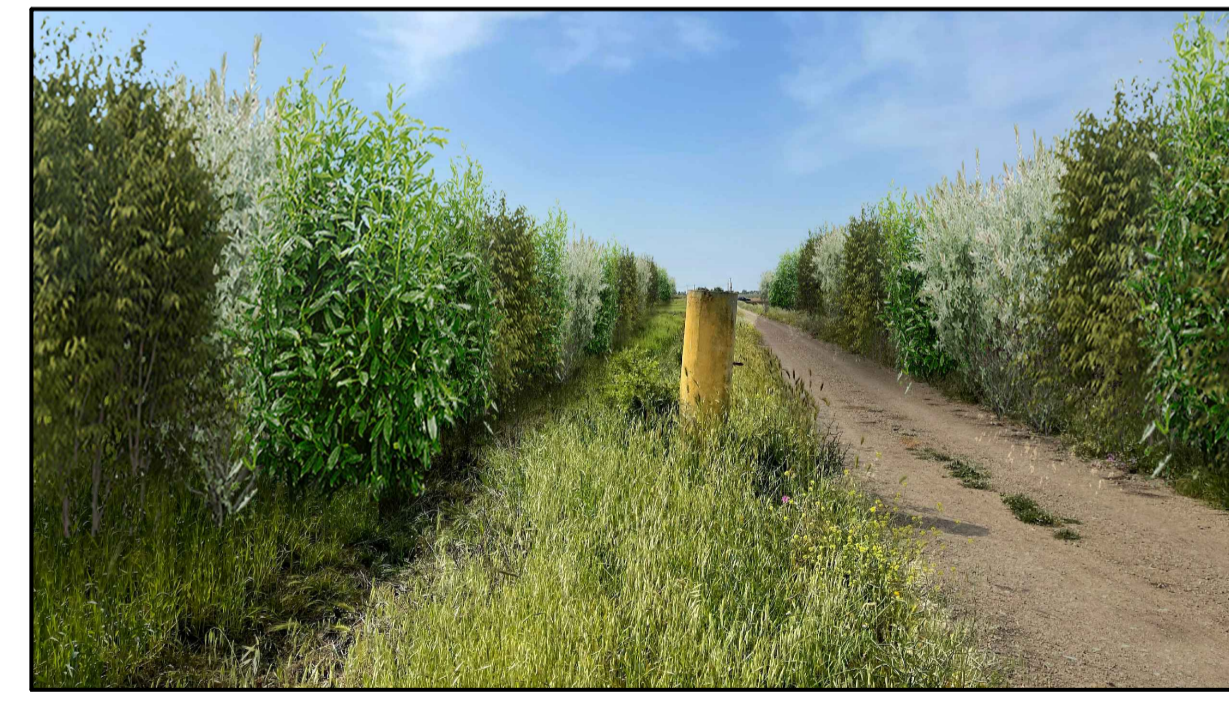
FOTOINSERIMENTO 12 - STATO DI PROGETTO