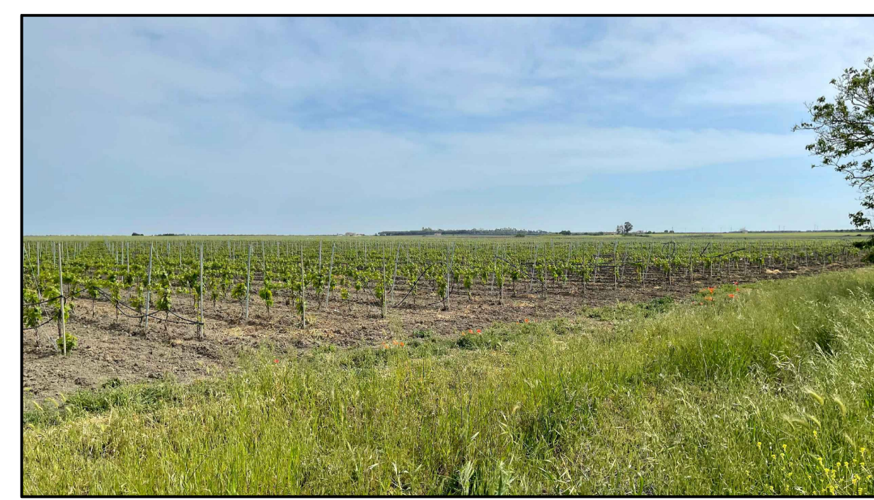
FOTOINSERIMENTO 13 - STATO DI FATTO