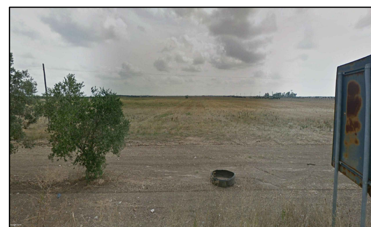
PUNTO DI PRESA FOTOGRAFICA 9