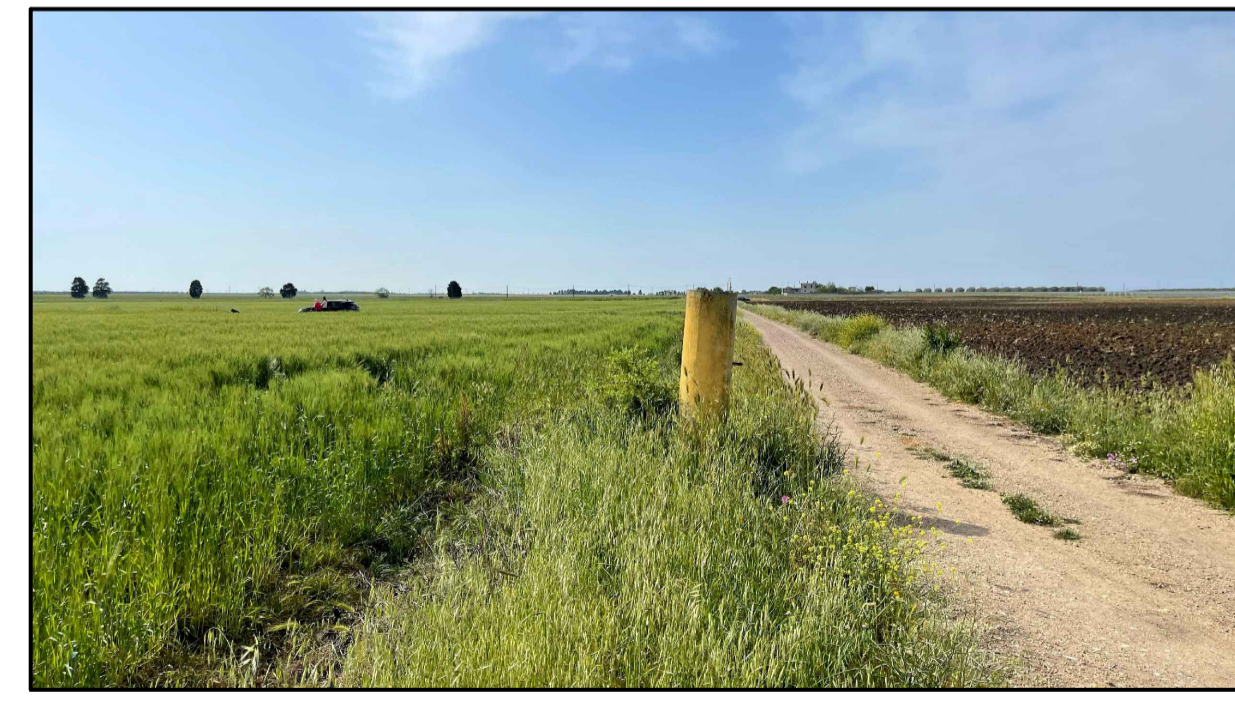
FOTOINSERIMENTO 12 - STATO DI FATTO