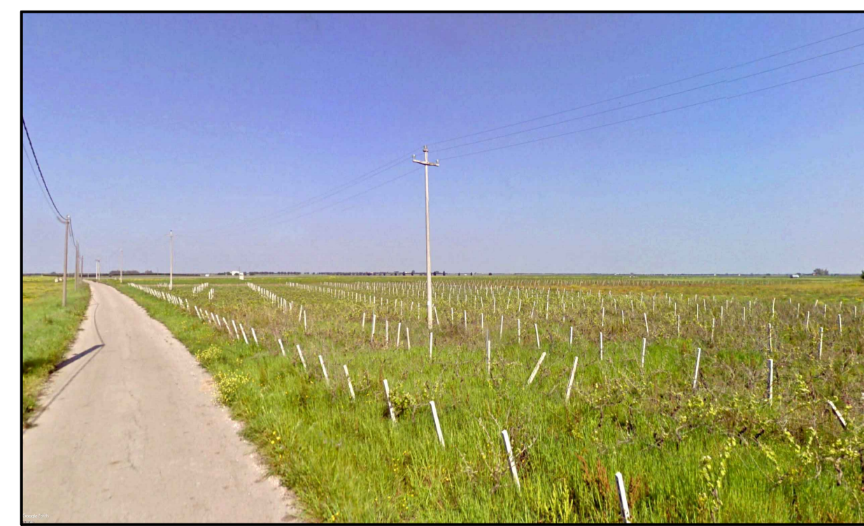
FOTOINSERIMENTO 6 - STATO DI FATTO