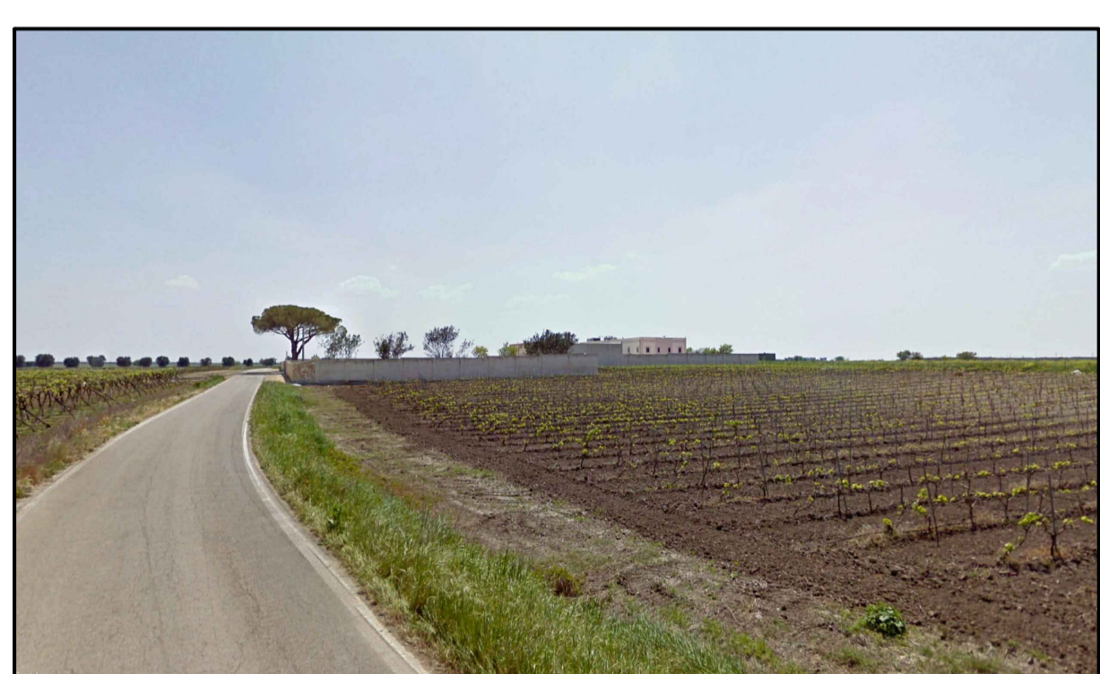
PUNTO DI PRESA FOTOGRAFICA 11