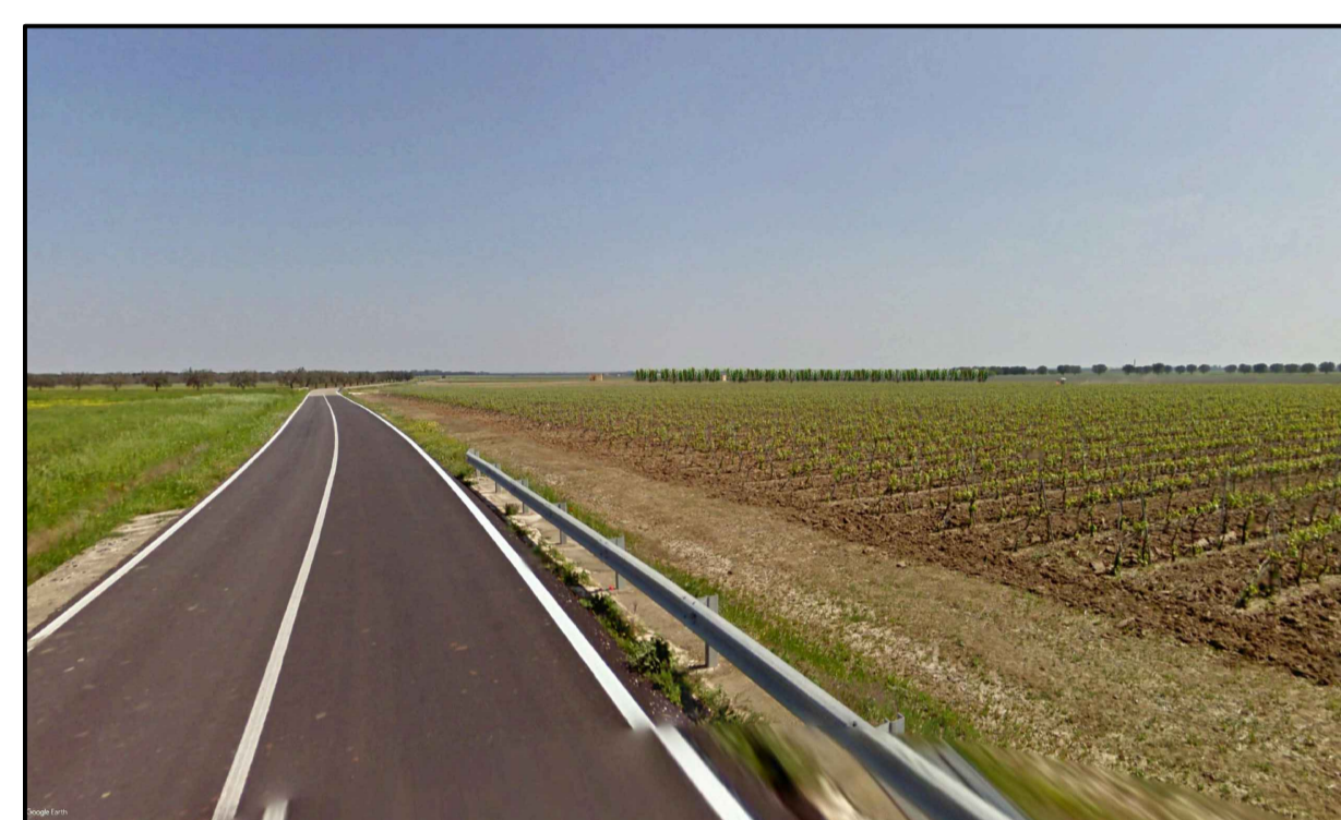
FOTOINSERIMENTO 8 - STATO DI FATTO