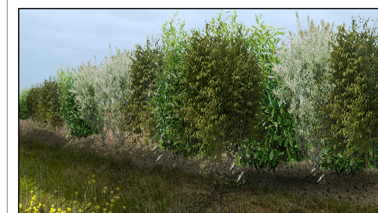
FOTOINSERIMENTO 14 - STATO DI PROGETTO