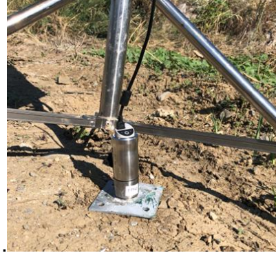
Terna 2 – Punto T2, Quota p.f. -1,5 m, Distanza asse f. 6 m