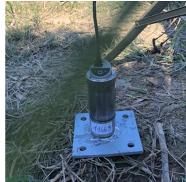
Terna 3 – Punto T3, Quota p.f. -1,5 m, Distanza asse f. 8 m