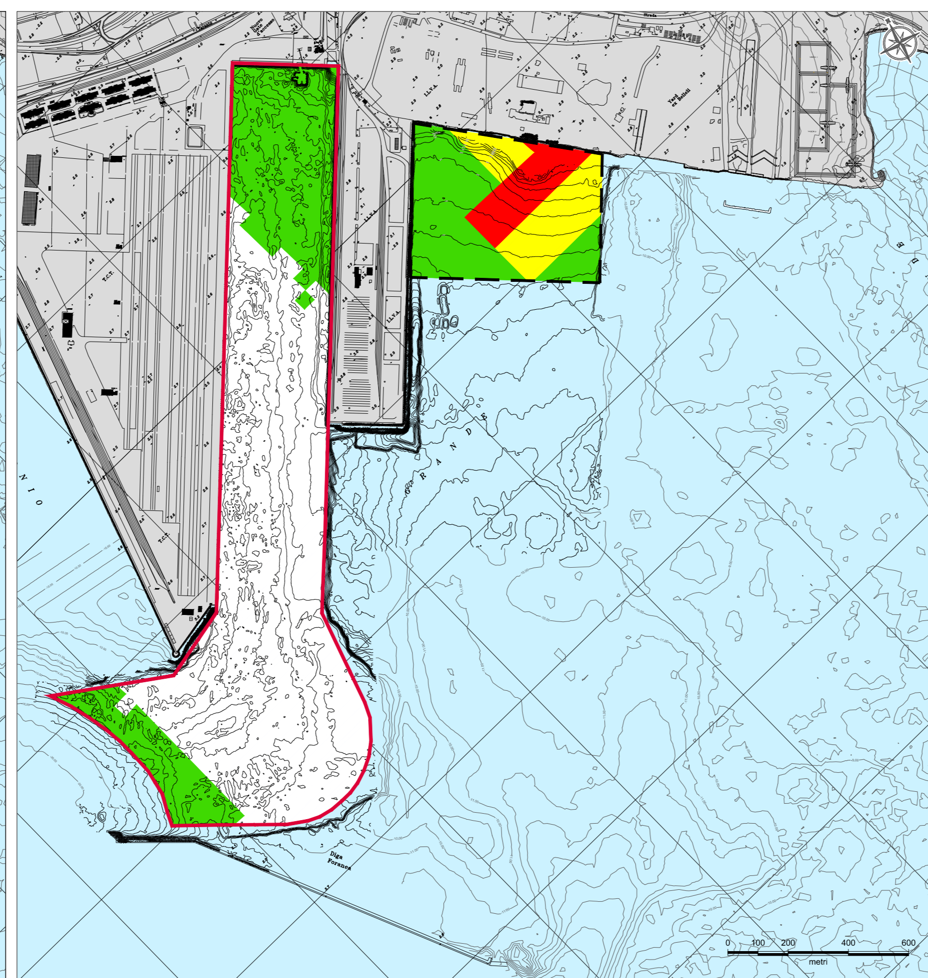
CARATTERIZZAZIONE DEI SEDIMENTI NELLO STRATO DA -2.00 A - 2.50 m