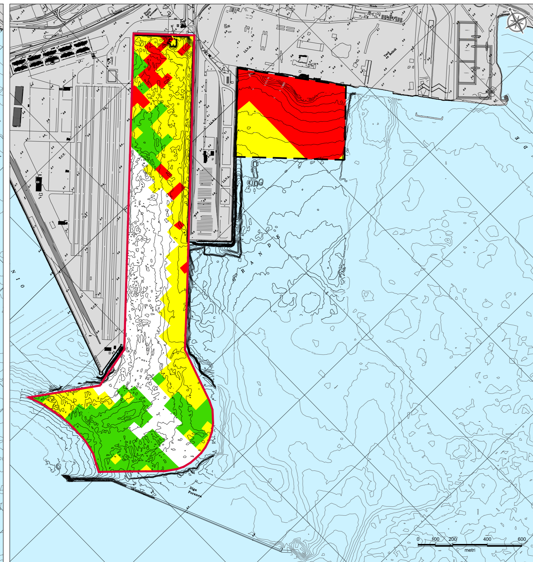
CARATTERIZZAZIONE DEI SEDIMENTI NELLO STRATO DA -0.50 A - 1.00 m