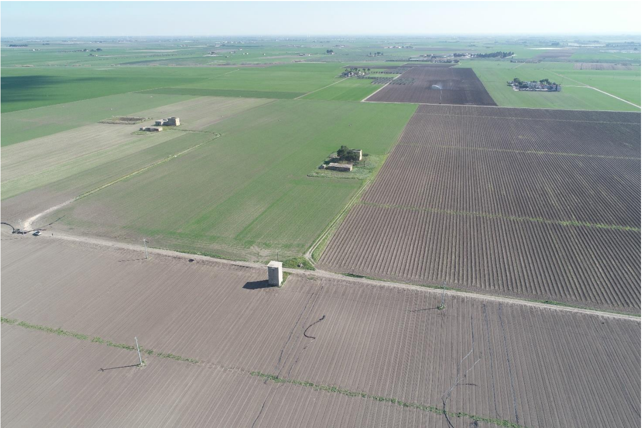
Punto di Presa 7

Coordinate: 41° 30' 49,434" N - 15° 37' 10,146" E