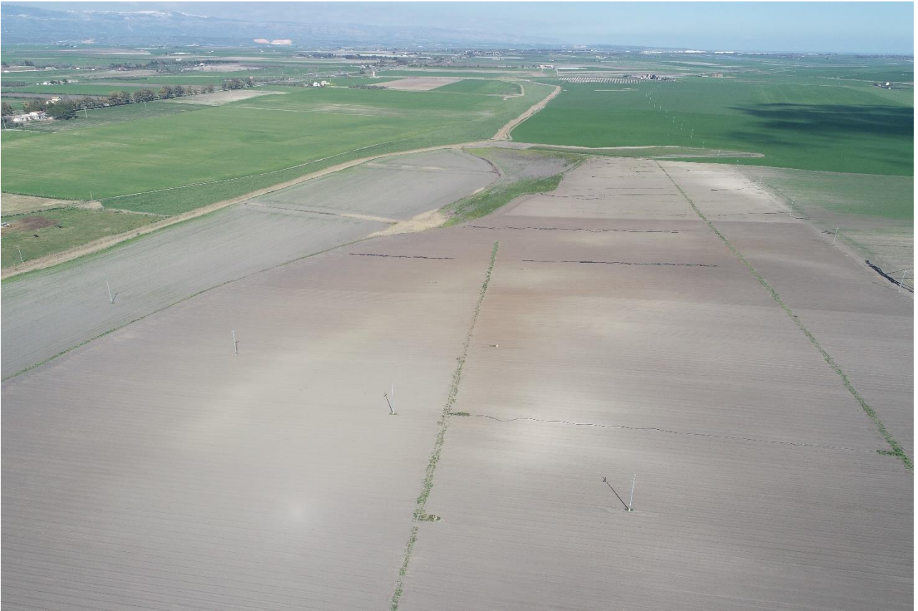
Punto di Presa 5

Coordinate: 41° 30' 49,428" N - 15° 37' 10,146" E