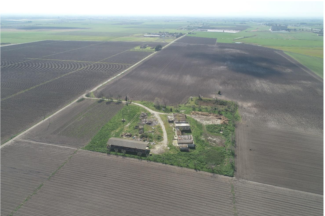
Punto di Presa 8

Coordinate: 41° 30' 49,434" N - 15° 37' 10,146" E