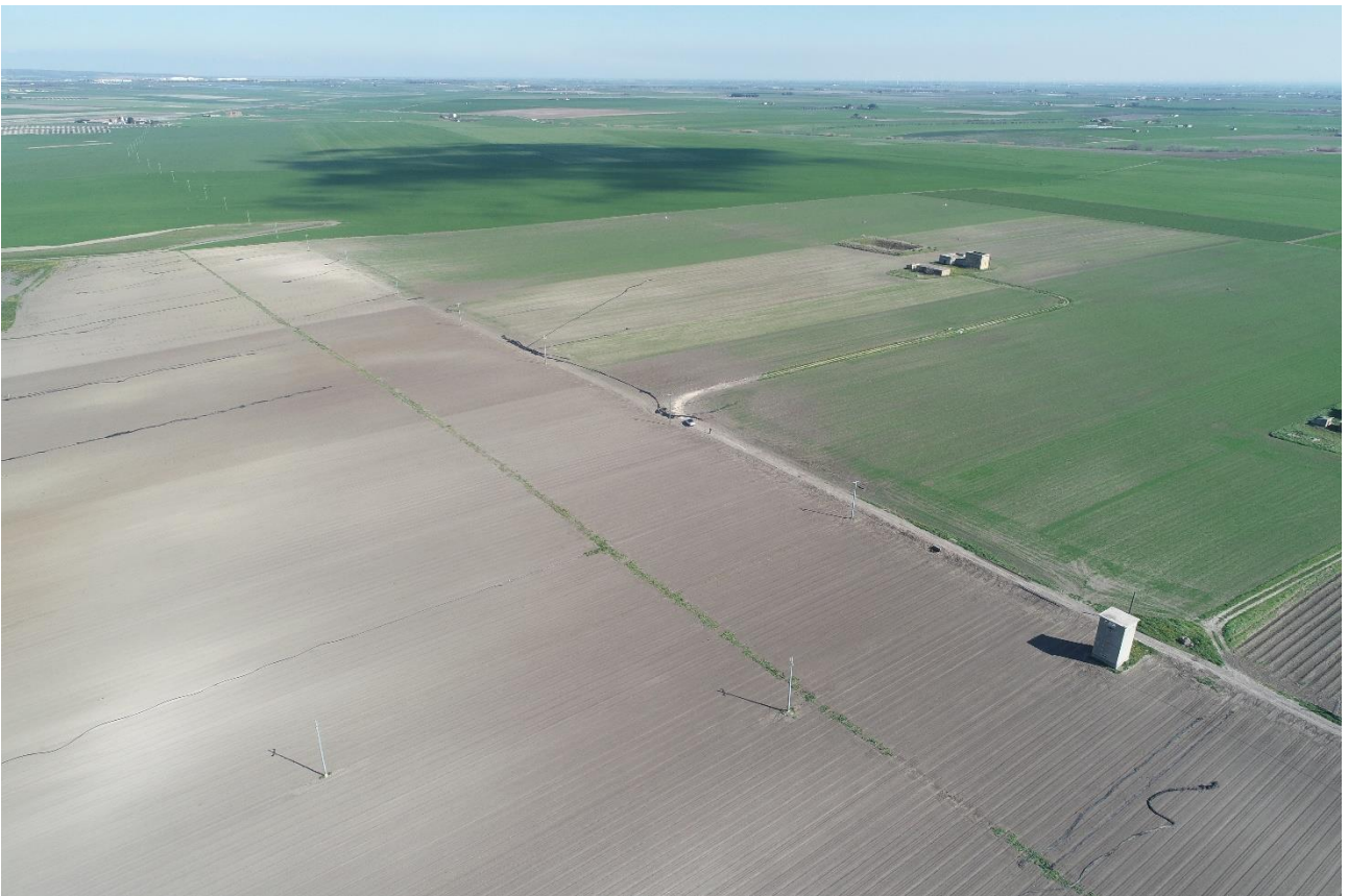
Punto di Presa 6

Coordinate: 41° 30' 49,428" N - 15° 37' 10,146" E